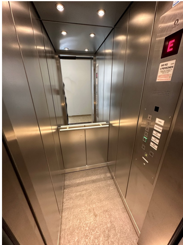
Aufzug neu 2022