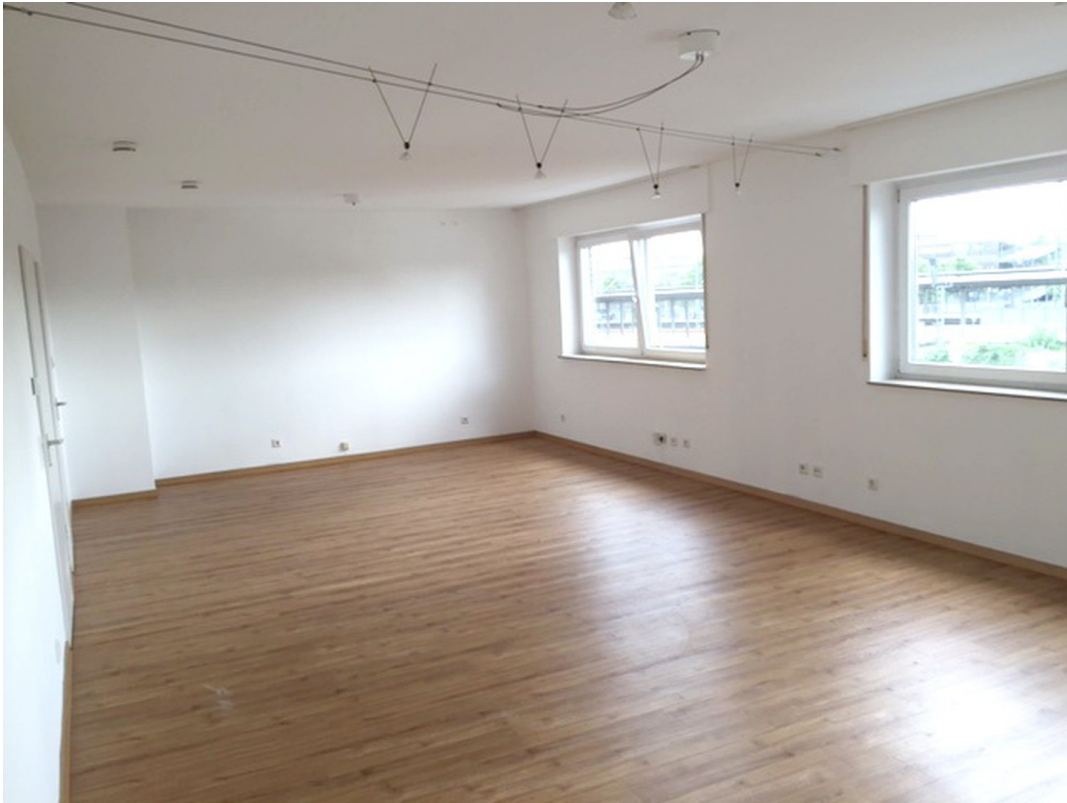
Wohnraum (Aufteilung möglich)