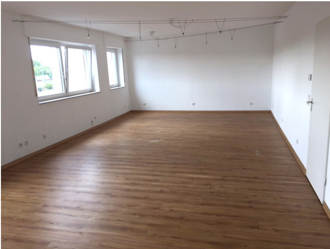
Wohnraum (Aufteilung möglich)