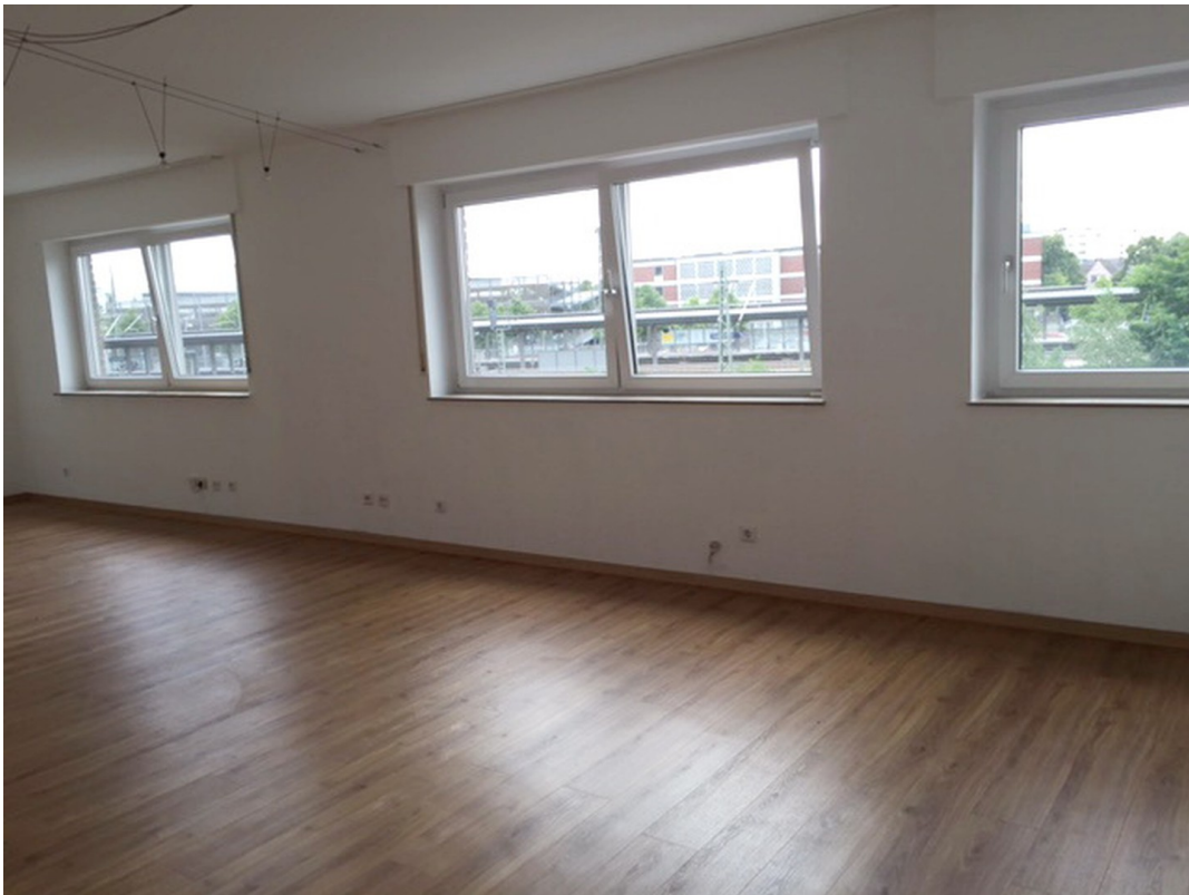
Wohnraum (Aufteilung möglich)