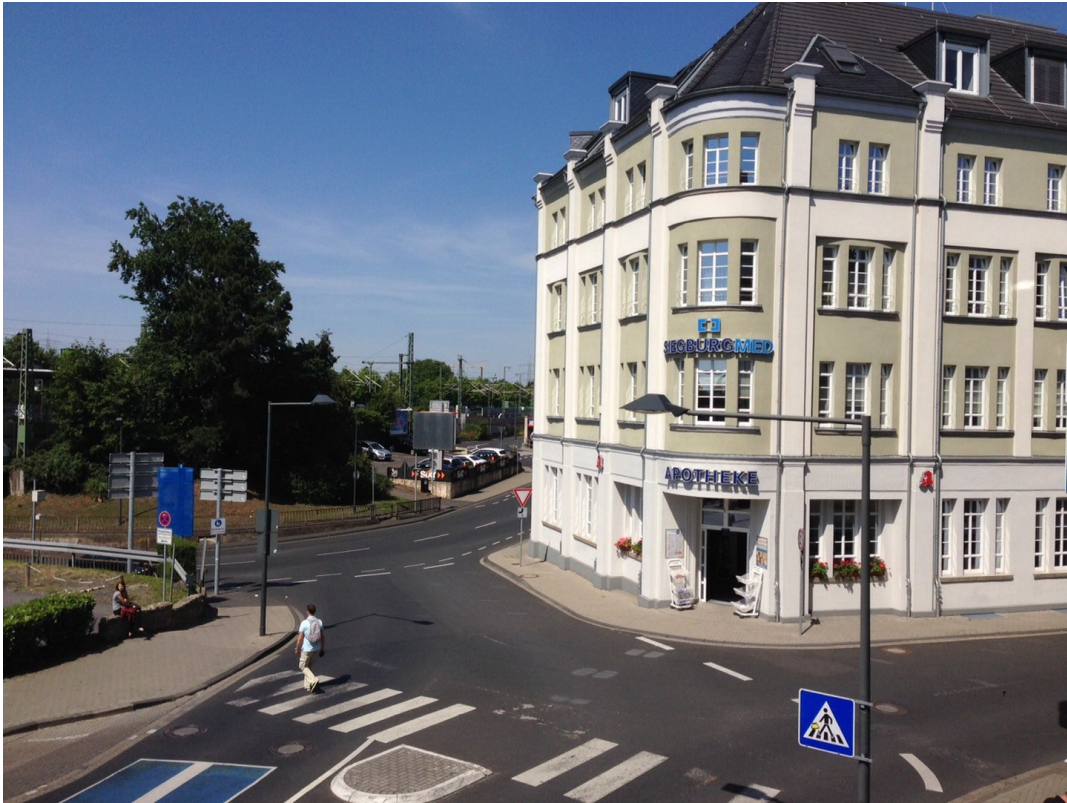
Ausblick Sieburg MED