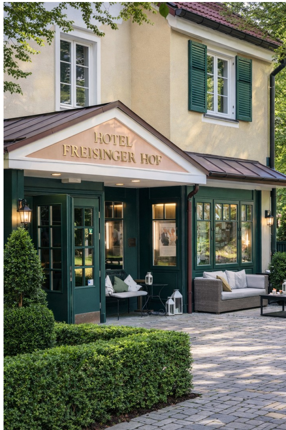
Freisinger Hof in 1min.