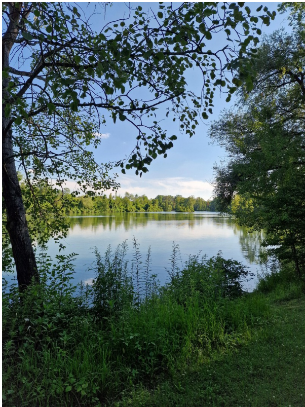
Poschinger Weiher Umgebung