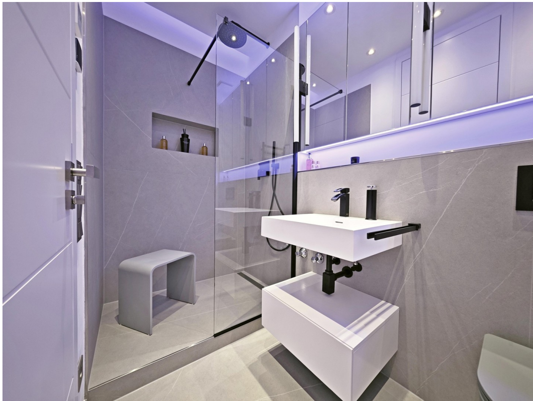
Zeitlos + Einbauschränke