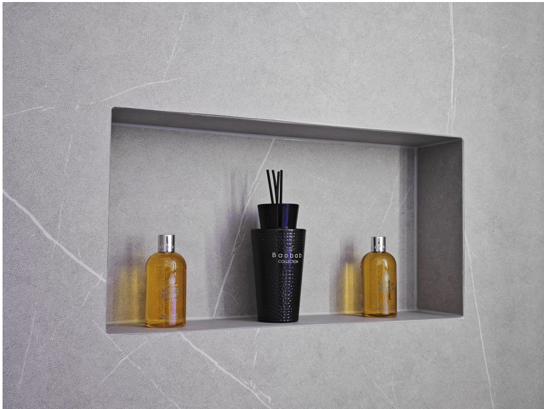
Praktische und wertige Details