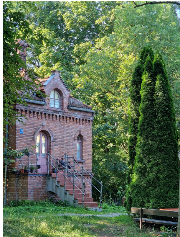
St-Emmeramsmühle in 5min