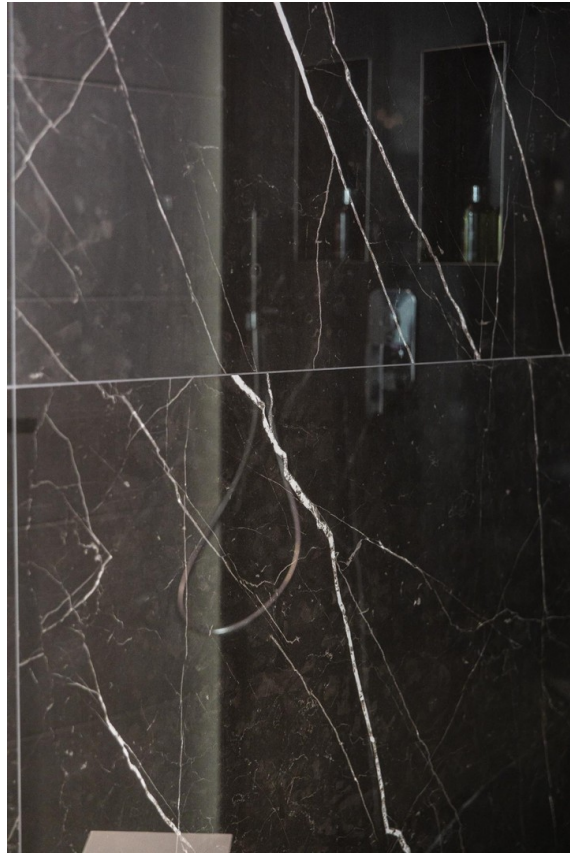
Nero Marquina Fliesen