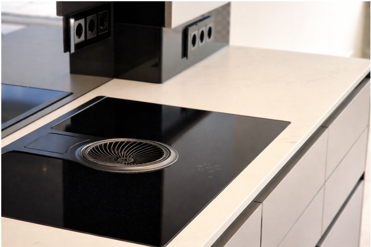
Dekton Arbeitsfläche, Abzug