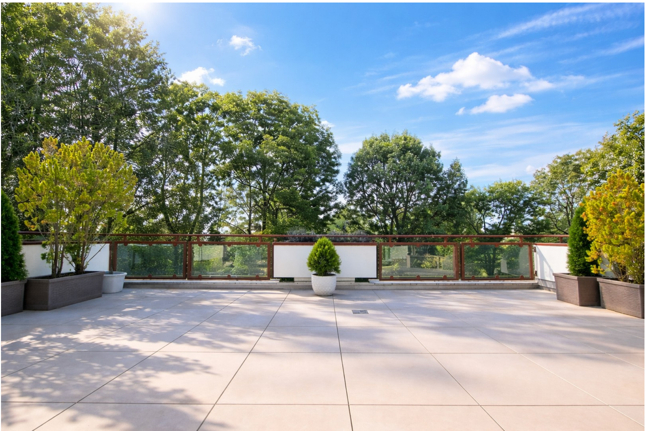
Grüne Oase mit Parkblick