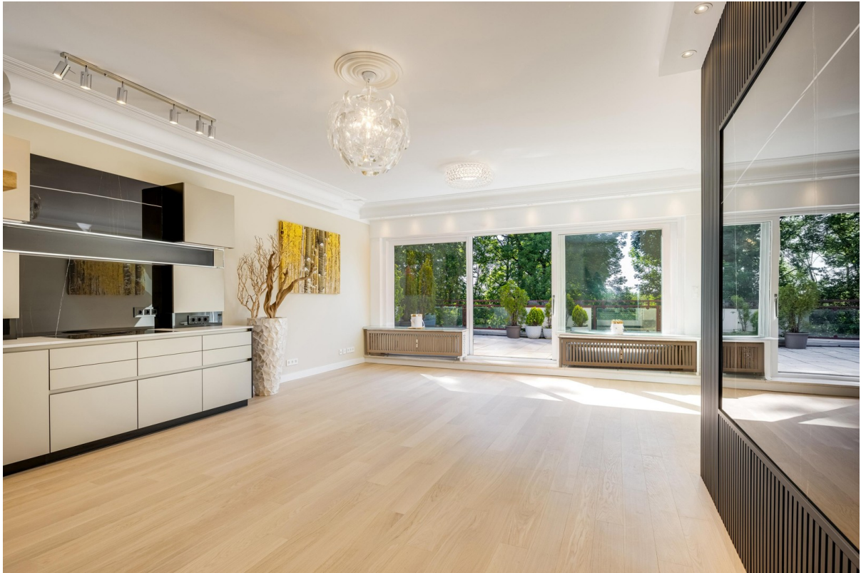
Wohn-Esszimmer mit Traumblick