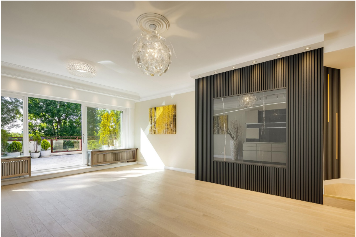
Wohnzimmer mit Designelementen