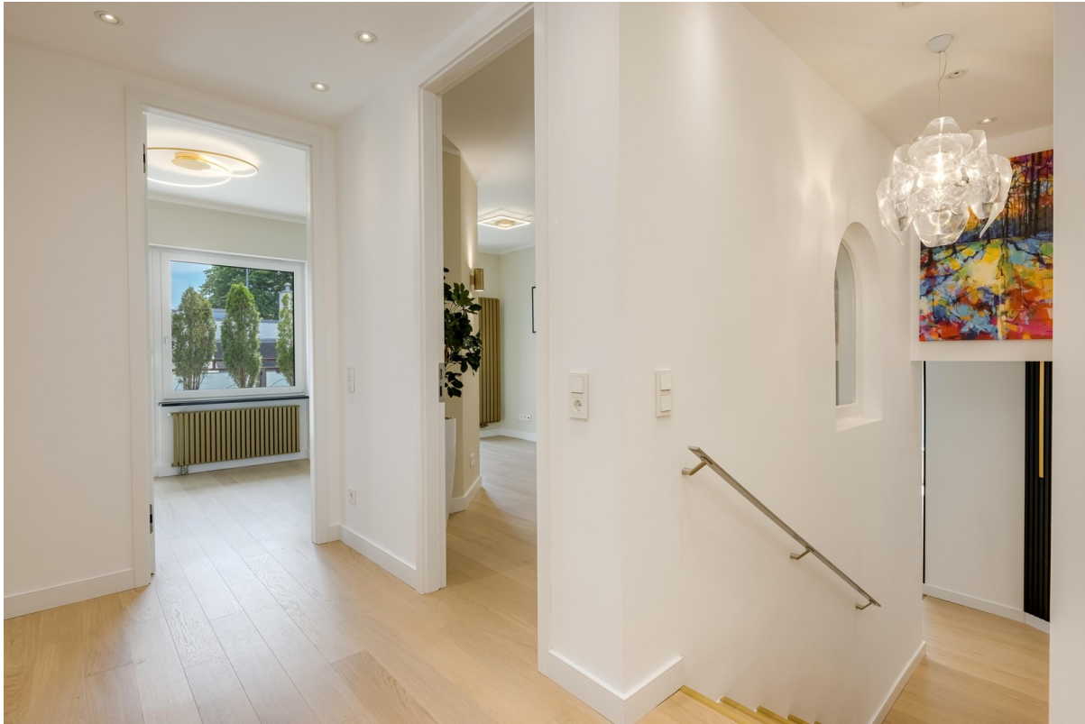
Treppe Richtung Wohn-Bereich