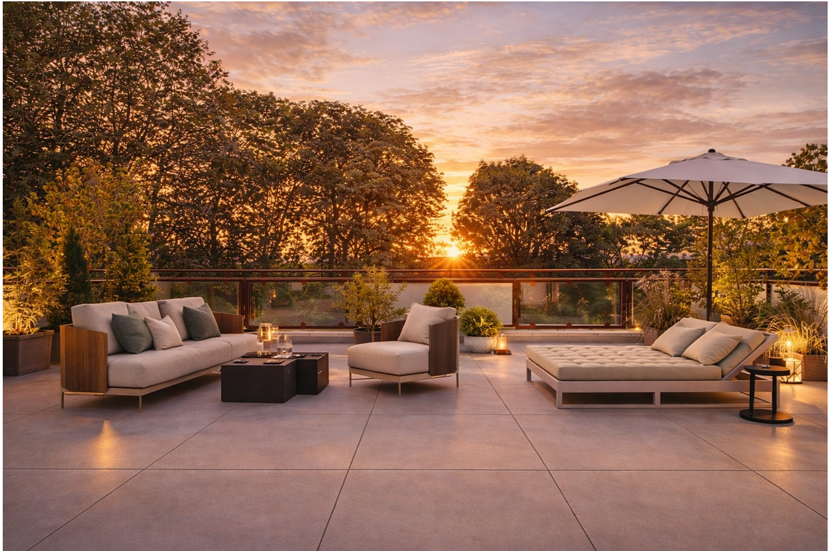
Traum-Blick ins Grüne