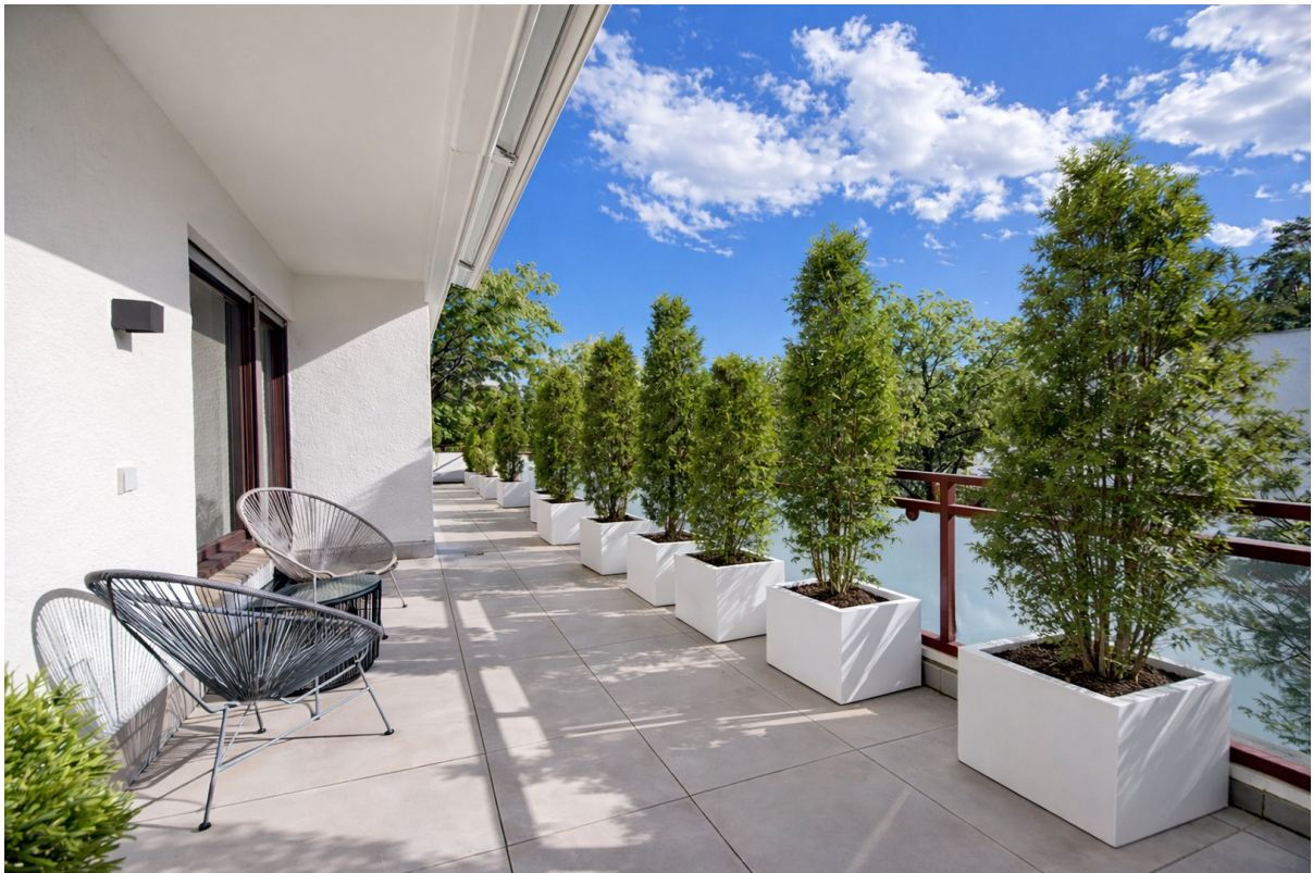
Süd-Dachterrasse vor Kind/Büro