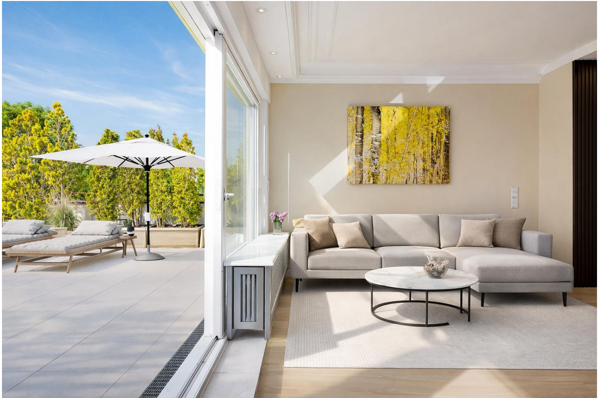
Couchbereich mit DT-Zugang