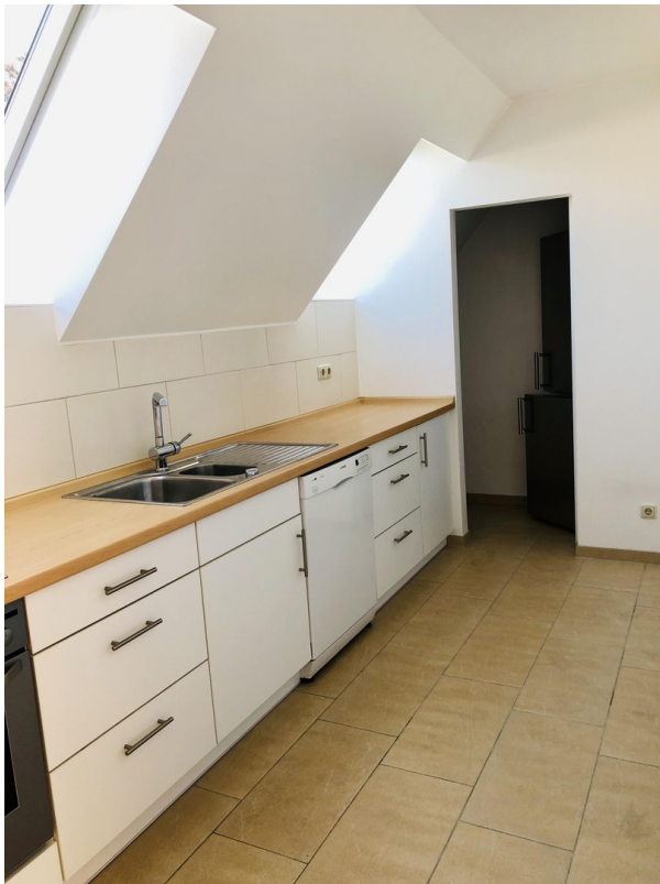
Küche mit Speise