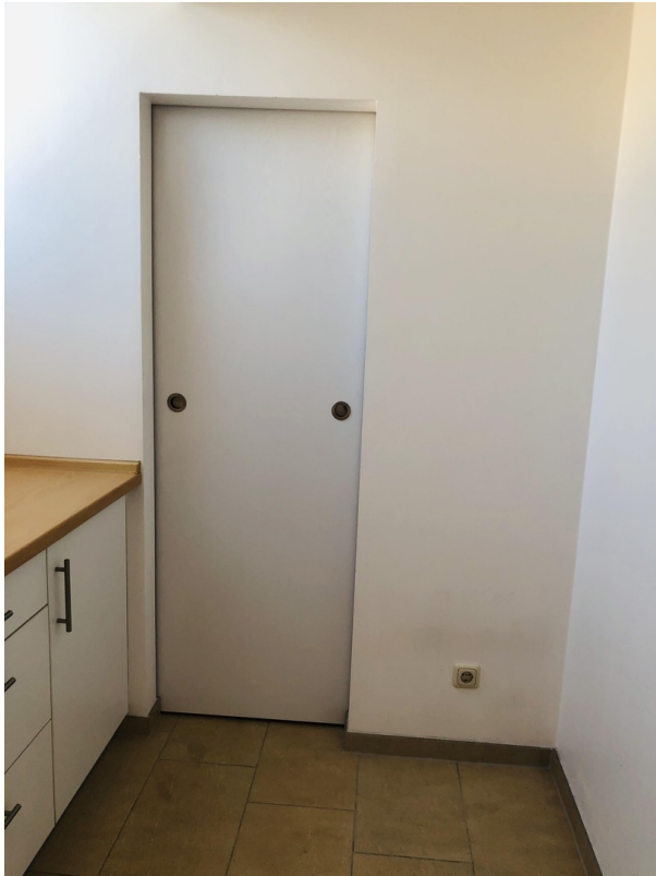
Küche, Eingang Speise