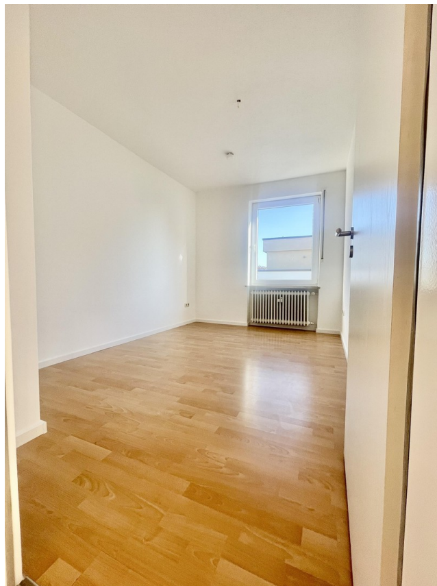
Zimmer 2 Süd