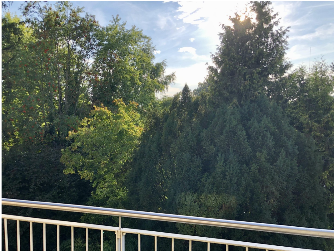
Terrasse ruhige Westlage