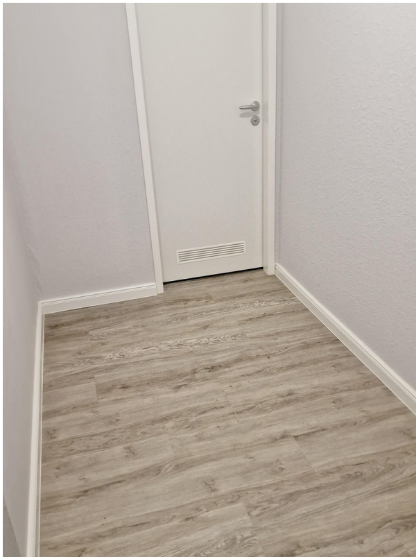
Platz für einen Schrank