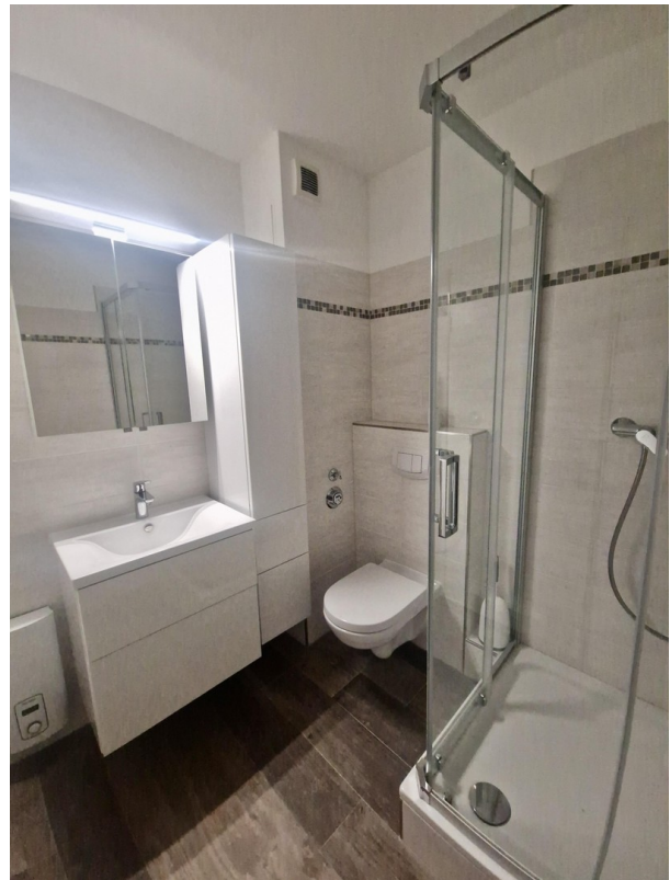
Mit hochwertigen Einbaumöbeln