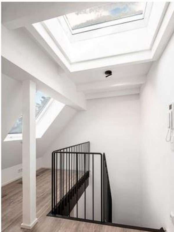
Treppenaufgang obere Ebene