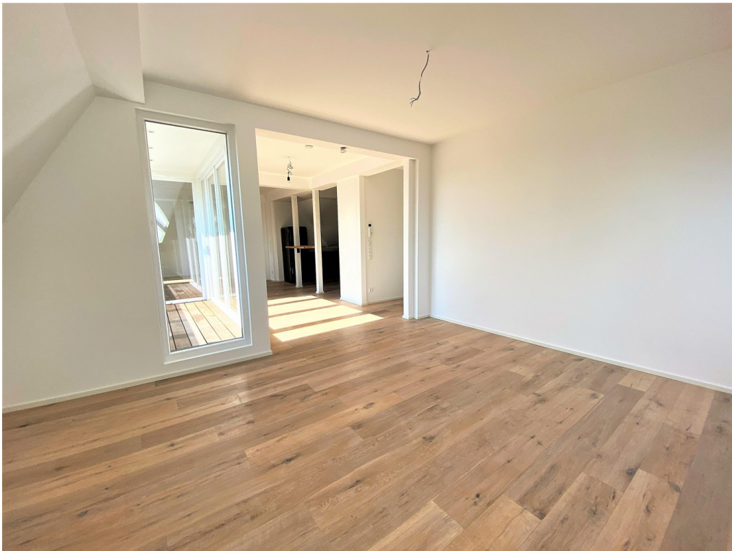
Essbereich mit Blick zur Küche