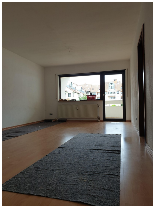
Wohn- und Schlafzimmer