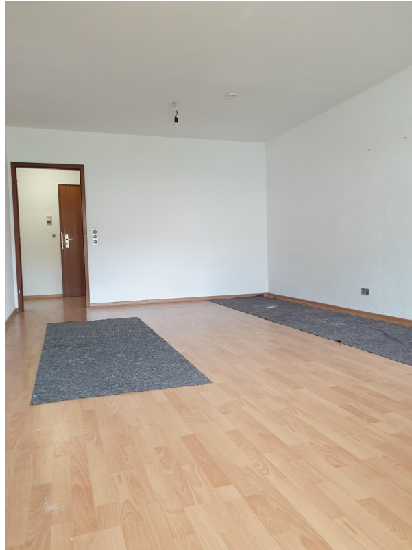
Wohn- und Schlafzimmer