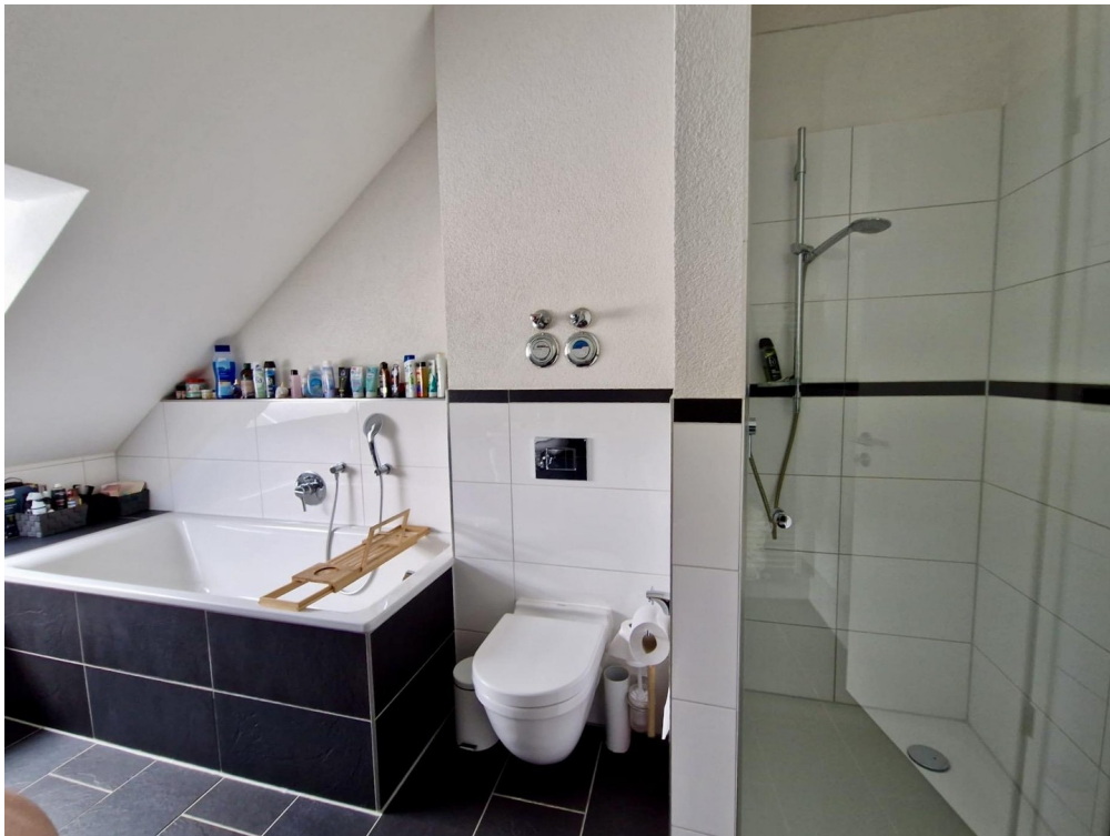
Bad mit Badewanne und Dusche