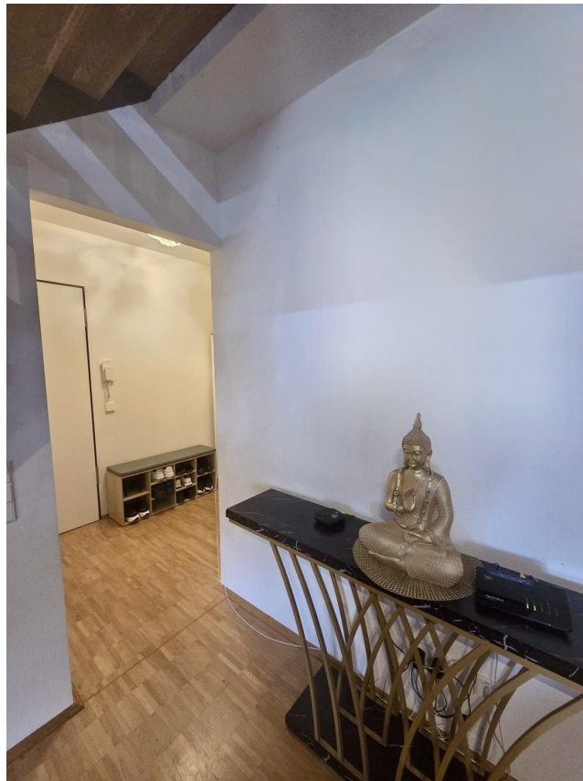
Wohnen Blick Richtung Flur