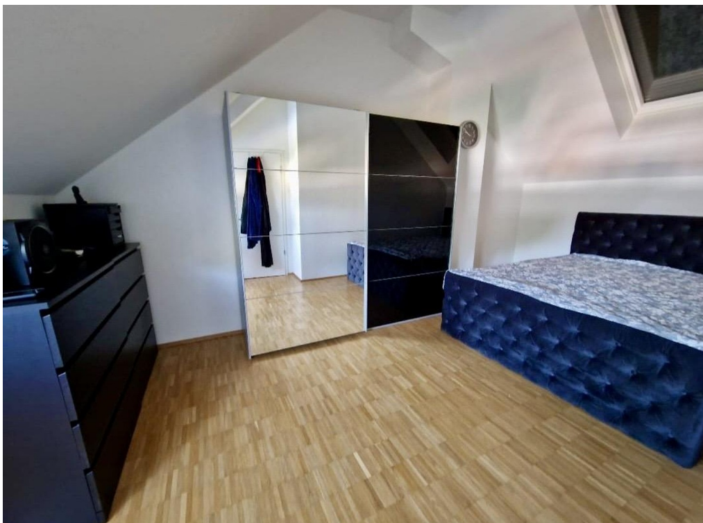
großes SZ auf Galerie Ebene