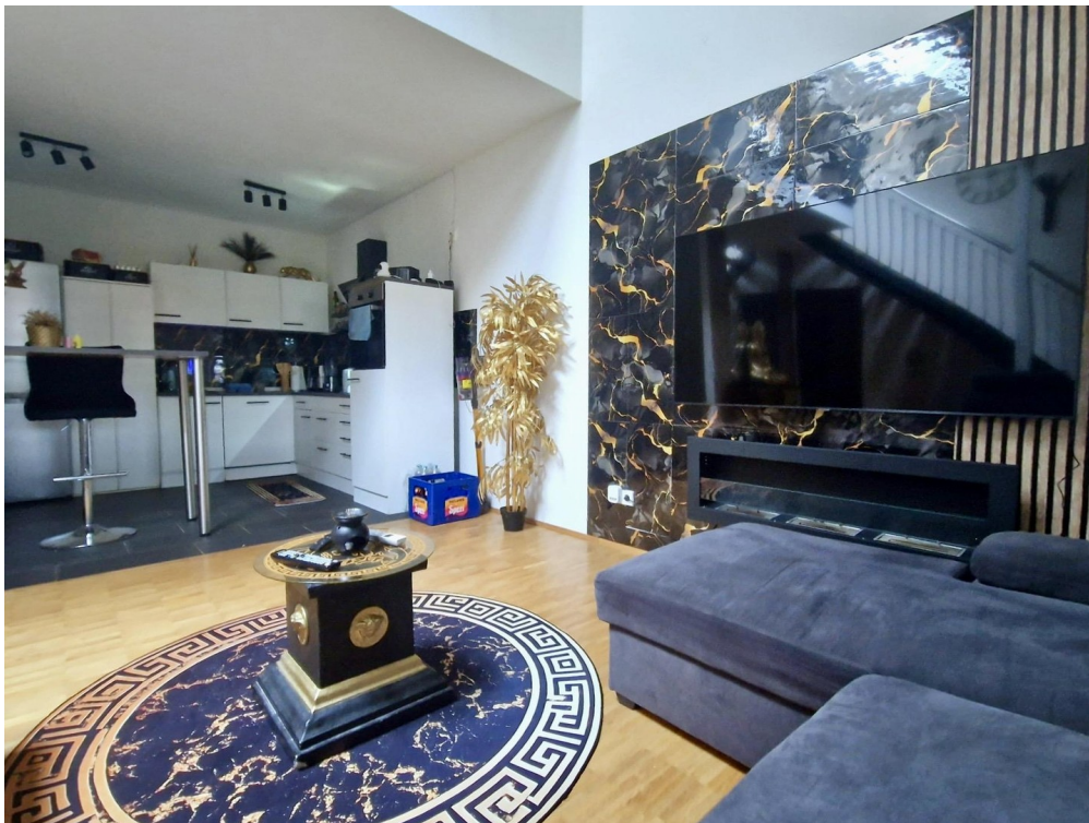
Wohnen / Küche