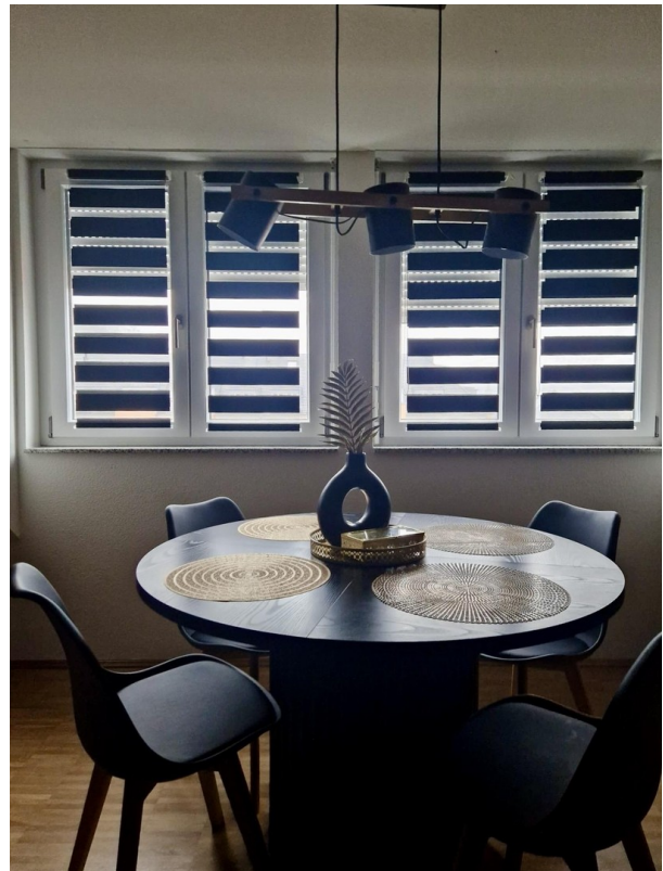
Essbereich im Wohnzimmer