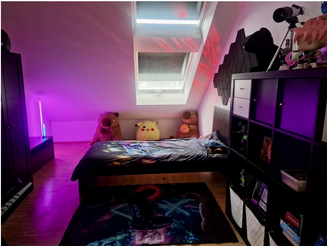
weiteres Zimmer Galerie Ebene