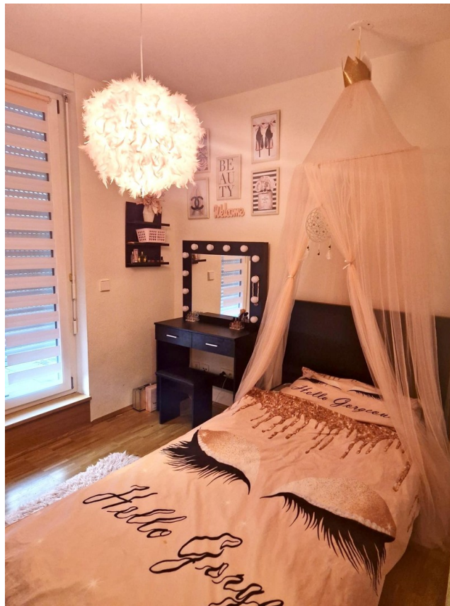
Büro mit Zugang Dachterrasse