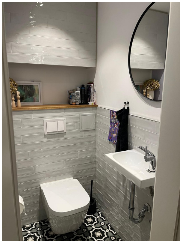
Gäste- WC 1