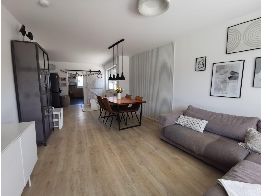
Ess- und Wohnzimmer