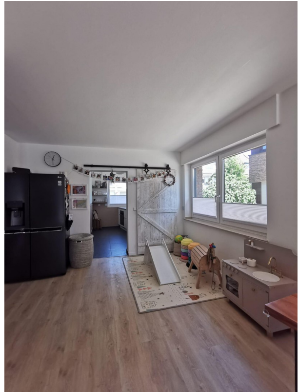
Blick vom Wohn- und Esszimmer