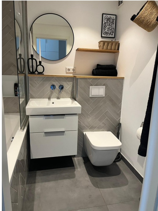
Badezimmer im EG