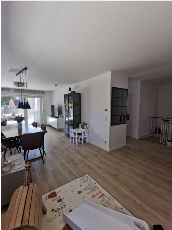
Blick in das Wohn- und Esszimm