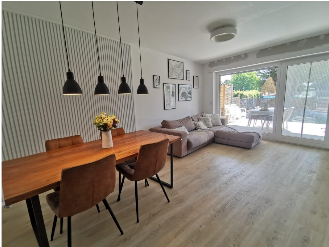
Ess- und Wohnzimmer