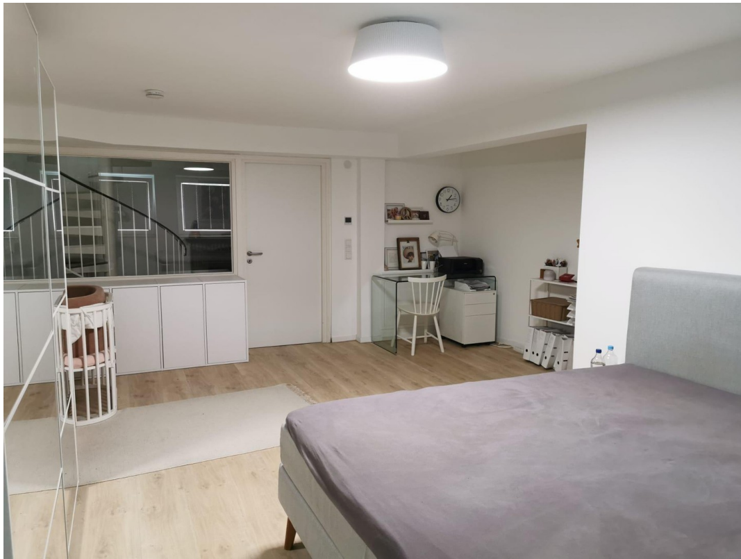
Elternschlafzimmer im UG