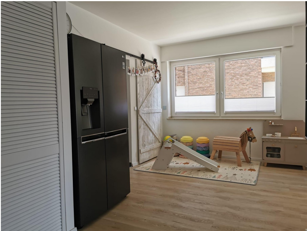
Spielbereich vor Küche