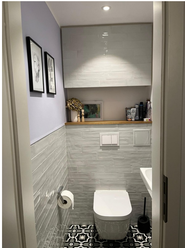
Gäste- WC 2