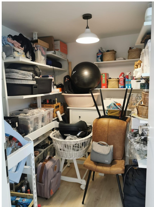
Abstellraum im Souterrain