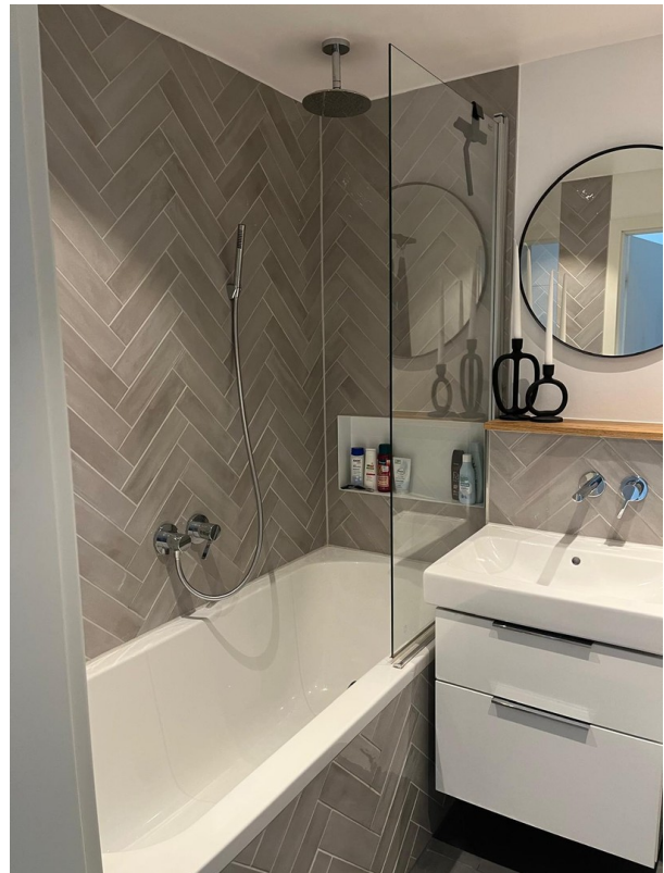
modernes Badezimmer im EG