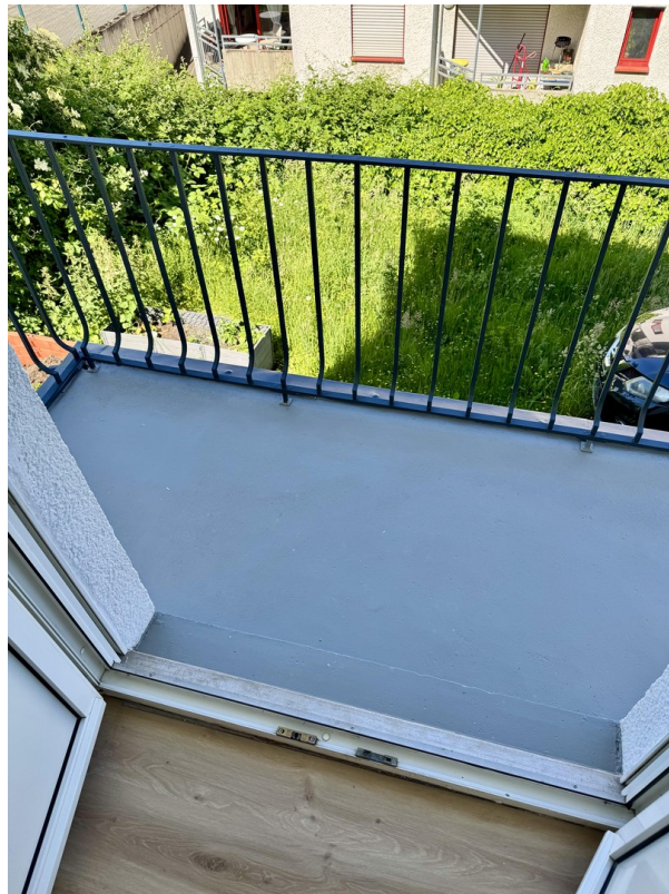
Frisch saniertes Balkon