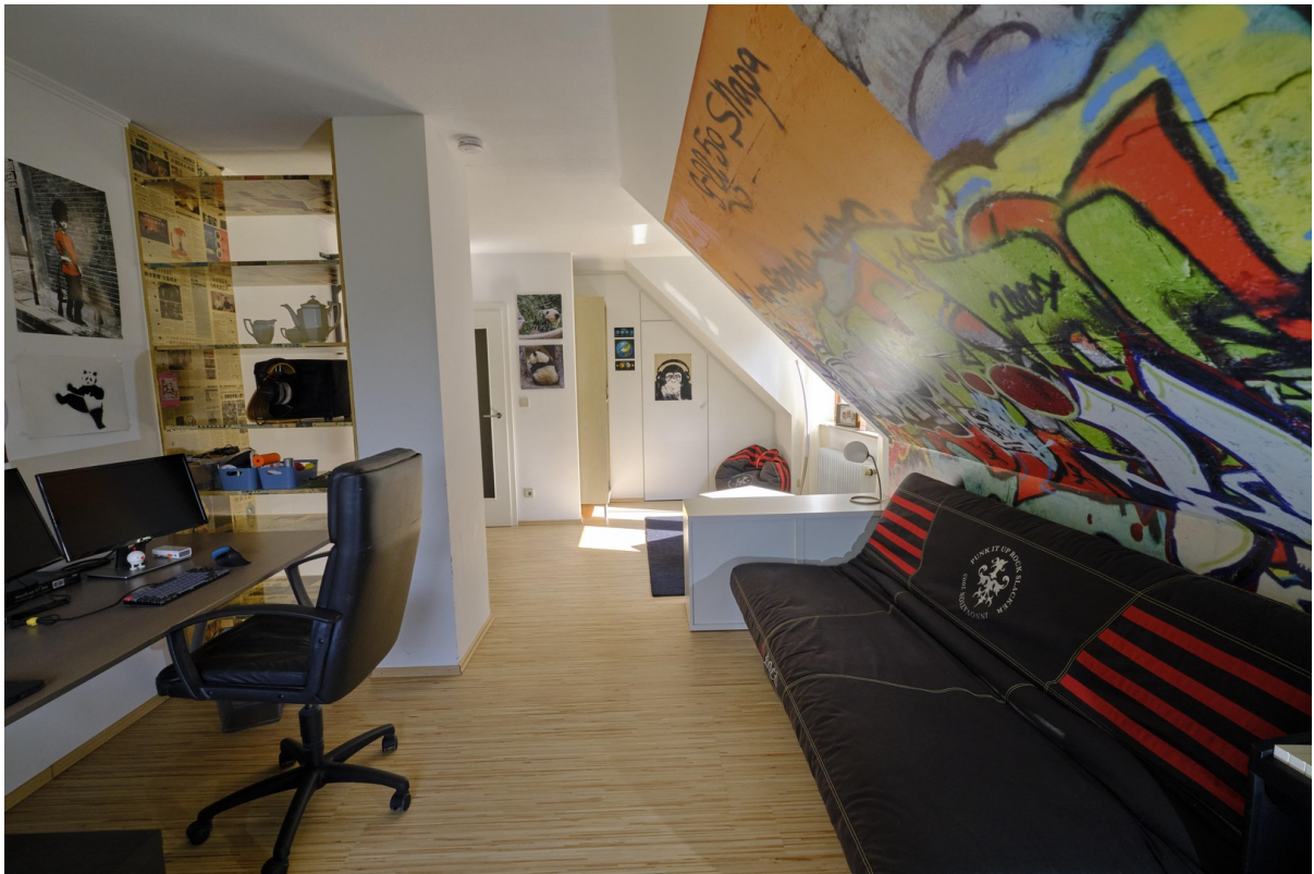
Zimmer 2 Dachgeschoss