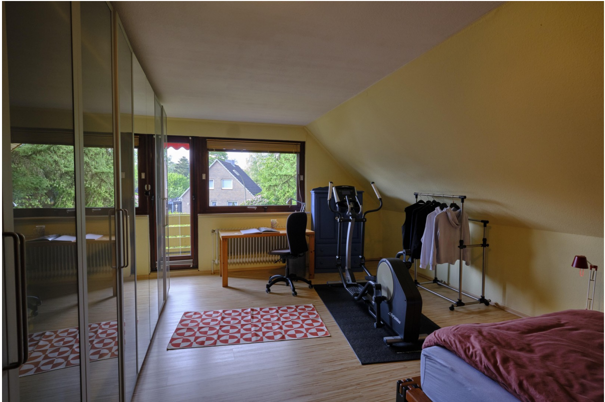
Zimmer 1 Dachgeschoss