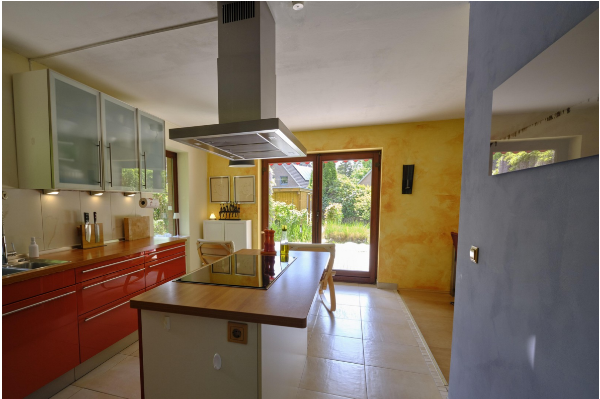
offene Küche mit Kochinsel