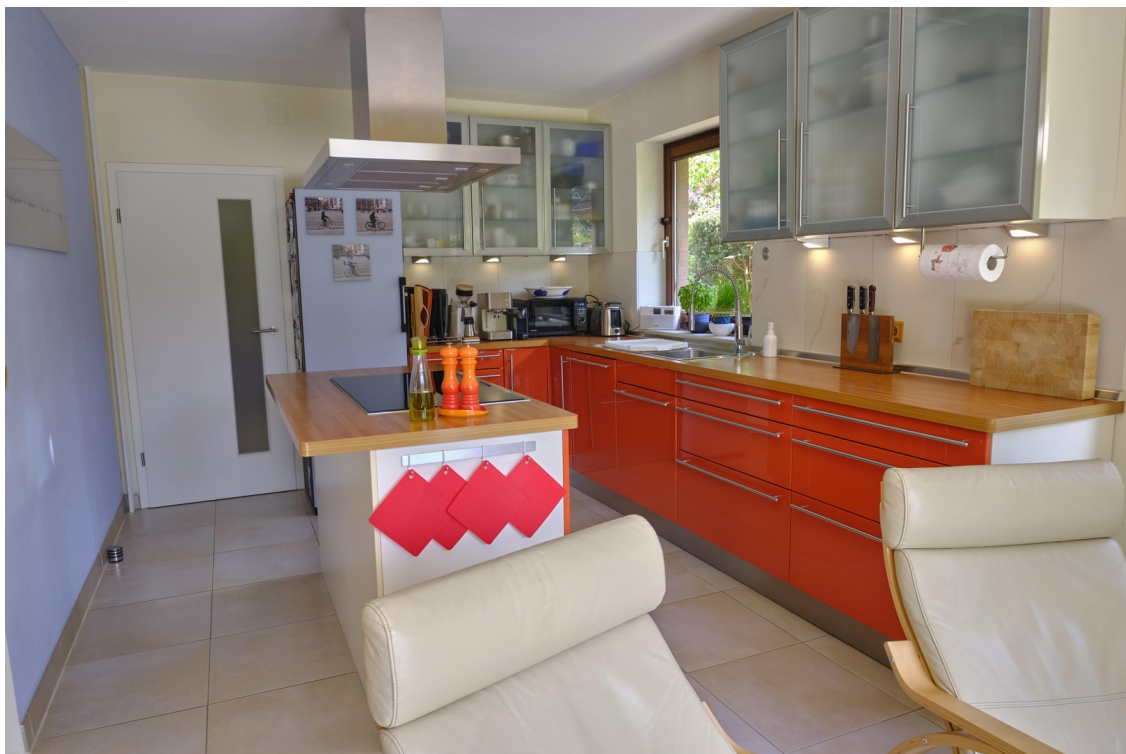
offene Küche mit Kochinsel