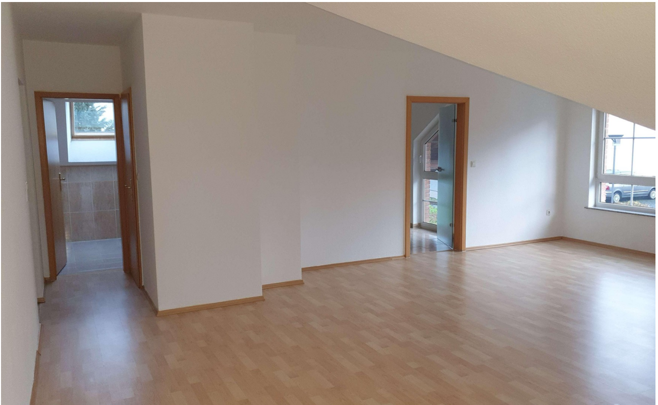
Zugang zur Küche etc