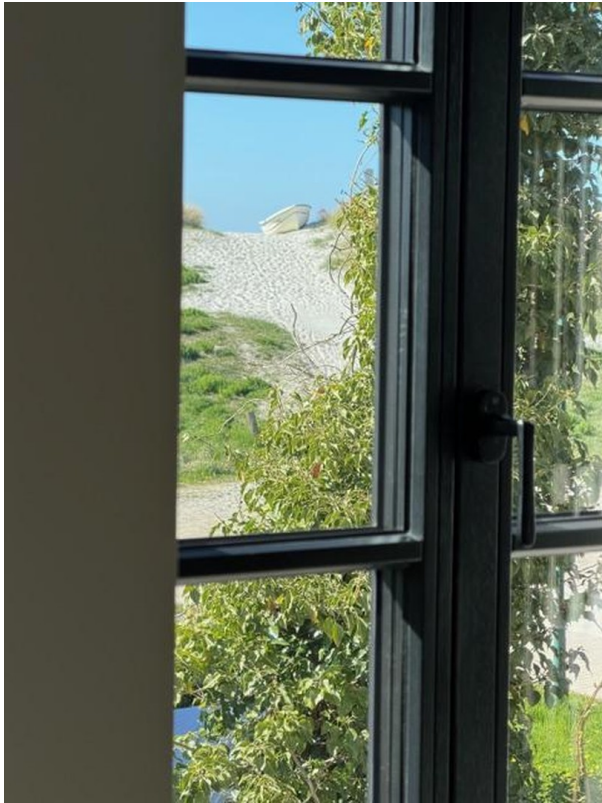
Blick aus der MasterSuite