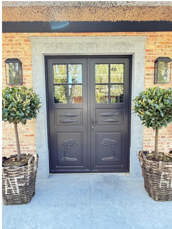
Handgeschnitzte Darßer Tür