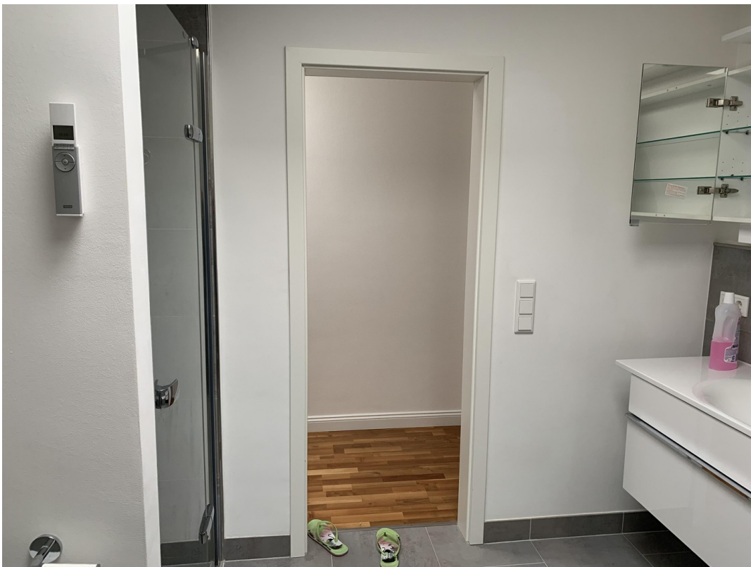
und Tageslicht von oben!