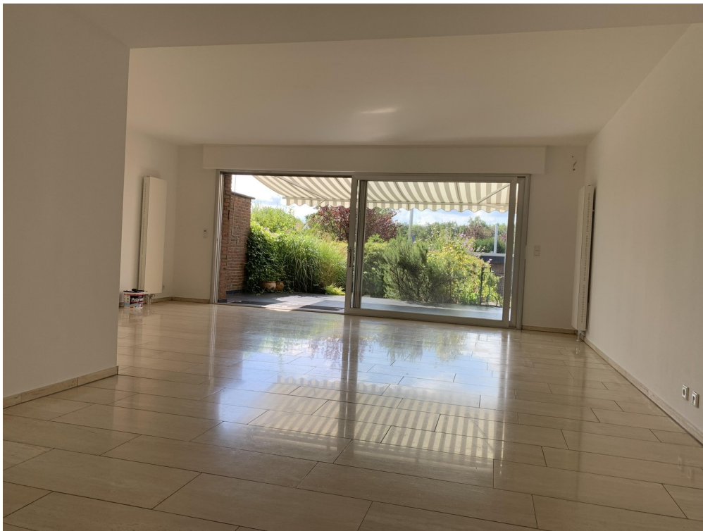
Wohnzimmer mit gr. Schiebetür