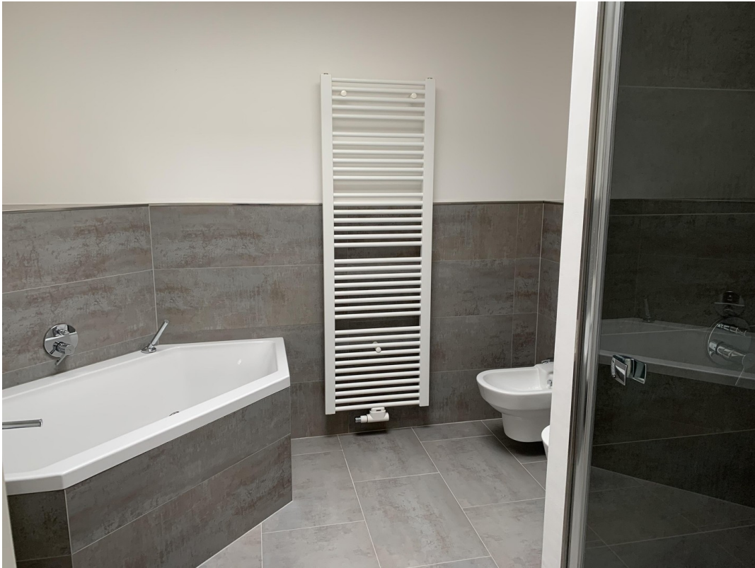
BZ mit Badewanne und Dusche