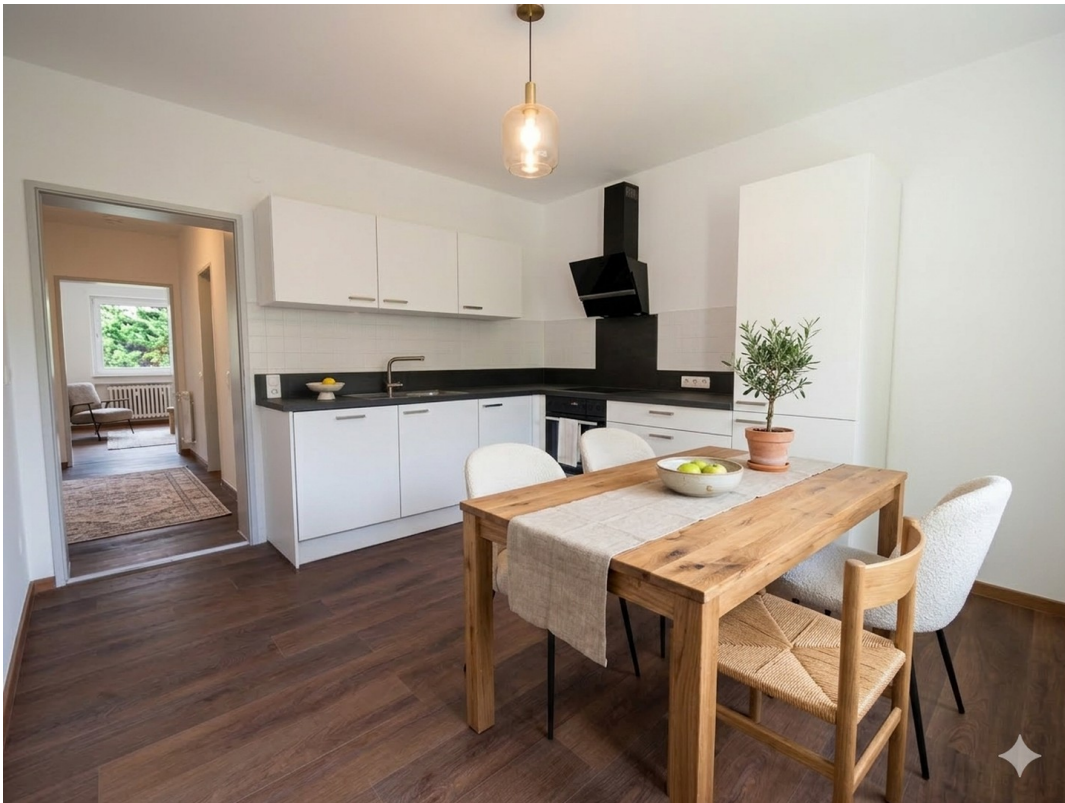
Küche/Esszimmer - kleine Wohnu