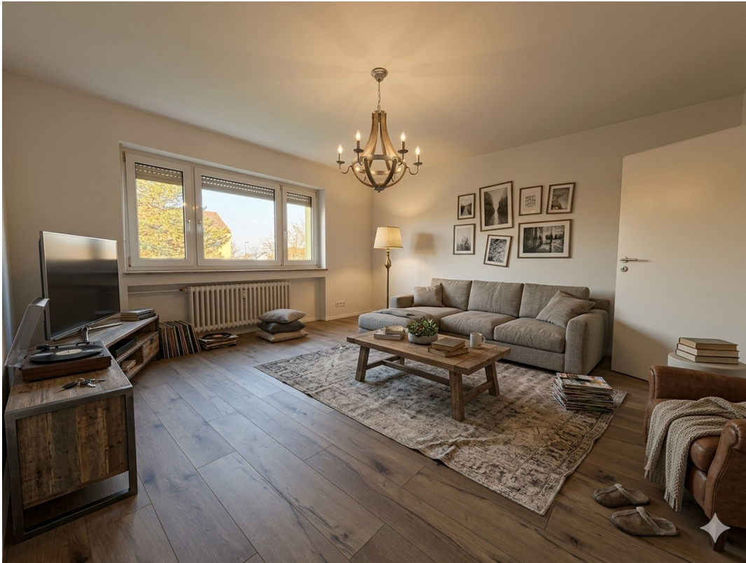
Wohnzimmer - große Wohnung