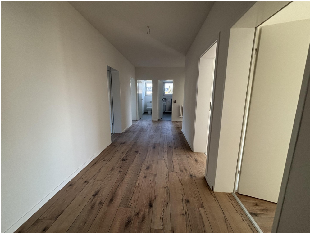
Flur - große Wohnung