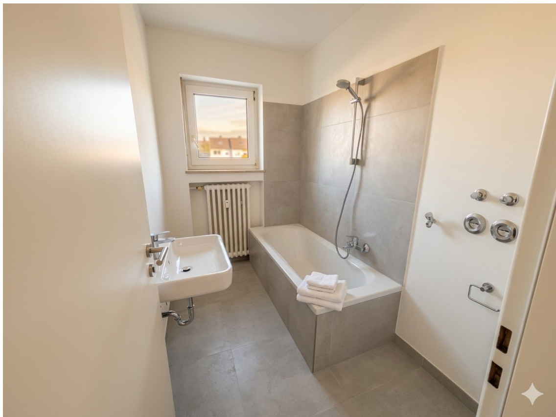
Badezimmer - große Wohnung