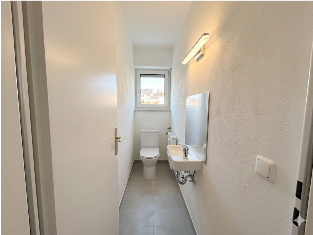
WC - große Wohnung