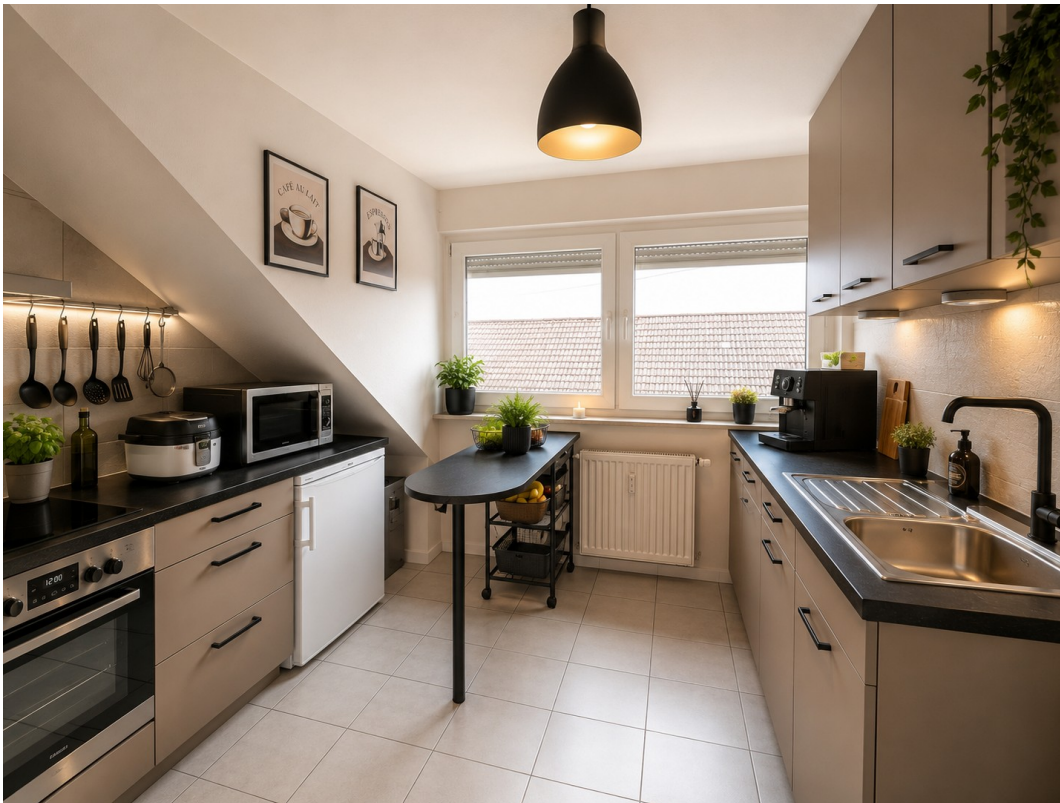
Küche mit KI Visualisiert