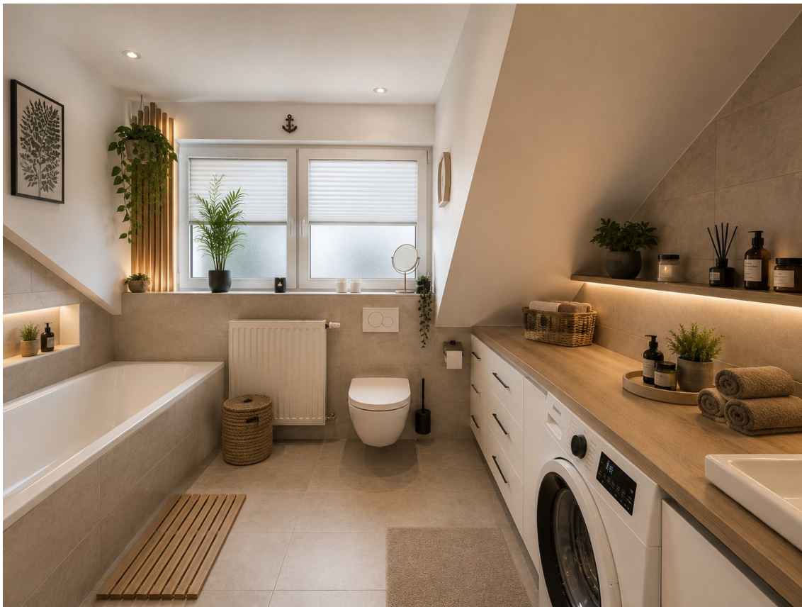
Bad mit KI Visualisiert