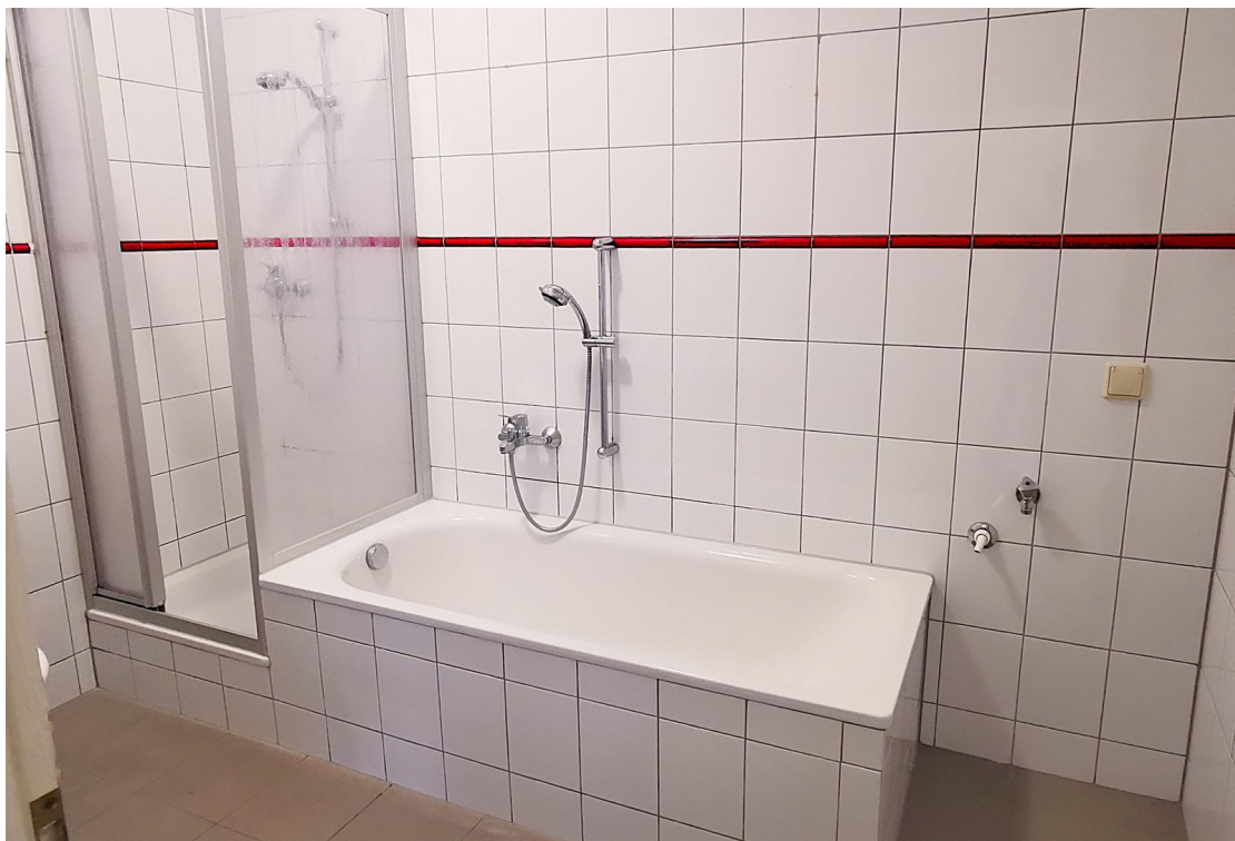
Bad mit Dusche und Badewanne