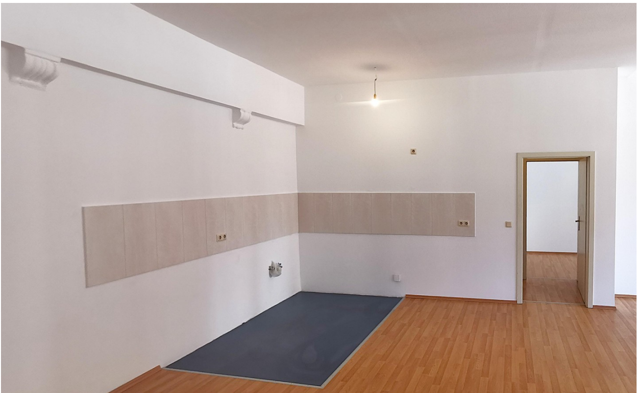
Küche in Wohn-/Esszimmer