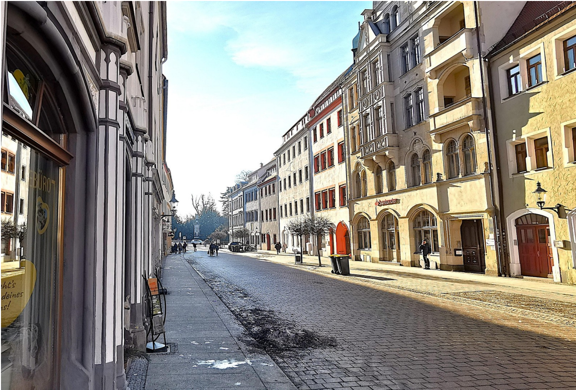
Petersstraße vorm Haus