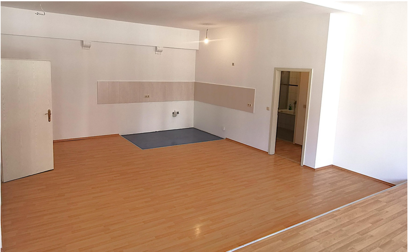
Küche in Wohn-/Esszimmer