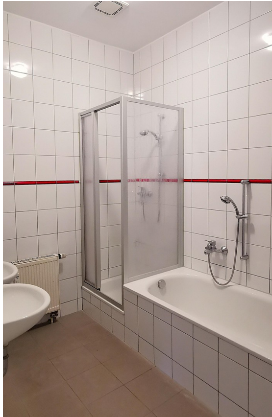
Bad mit Dusche und Badewanne