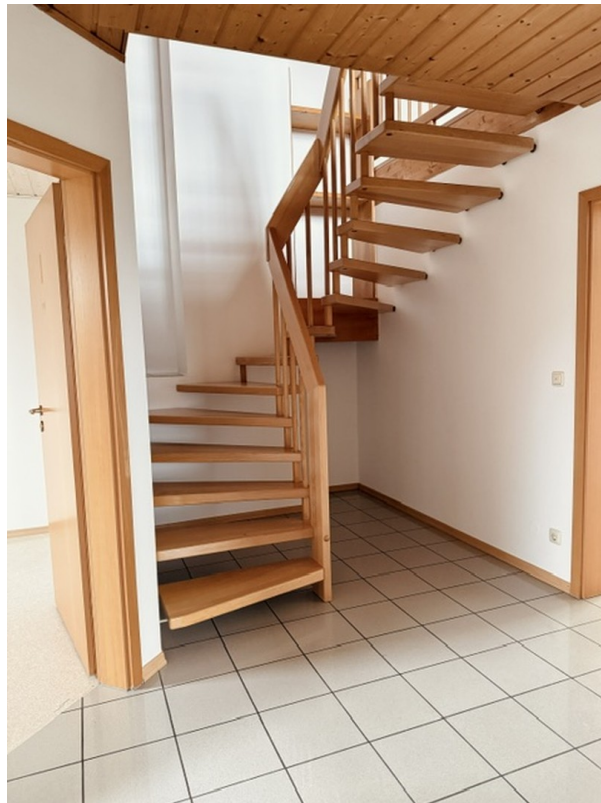
OG Treppe zur Galerie