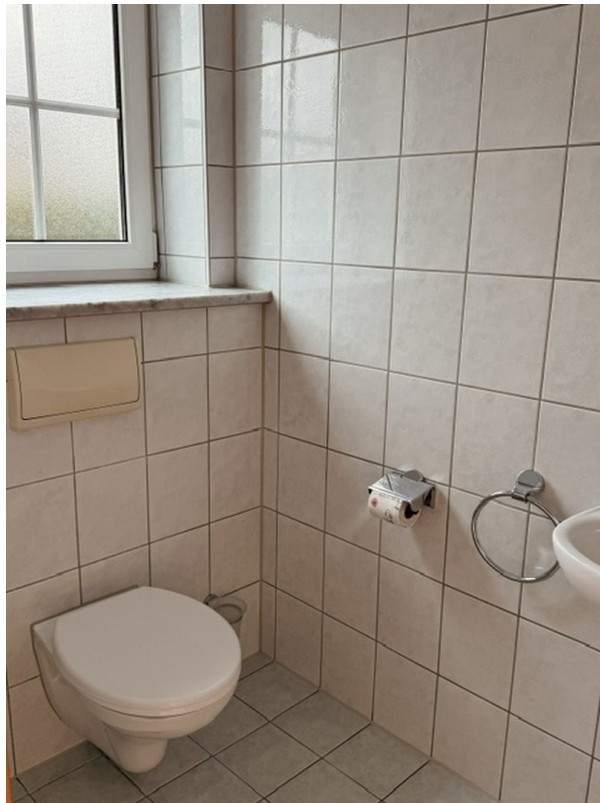
EG Gäste WC