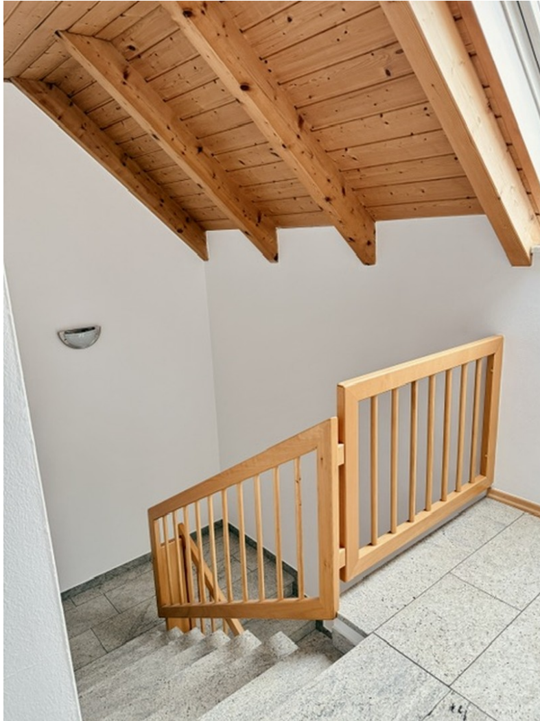
EG Treppe zum EG