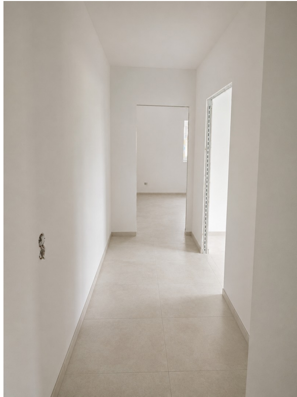
WE 1:Flur - Blick Zimmer 1 + 2