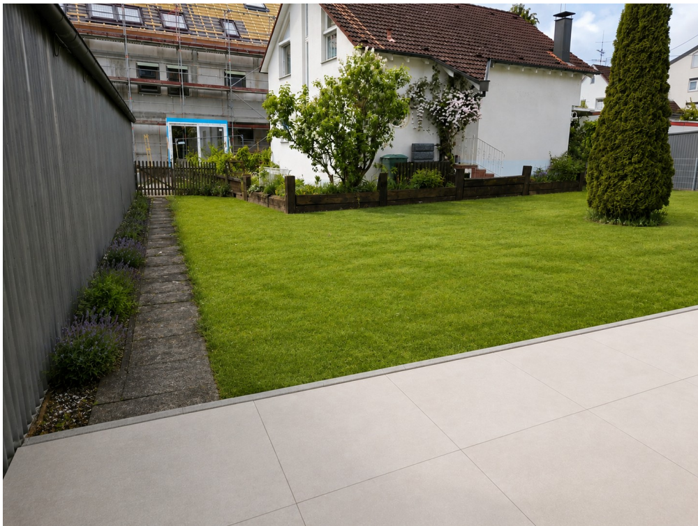
WE 1: Terrasse + Blick Garten