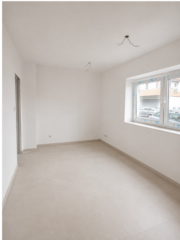
WE 1: Zimmer 1