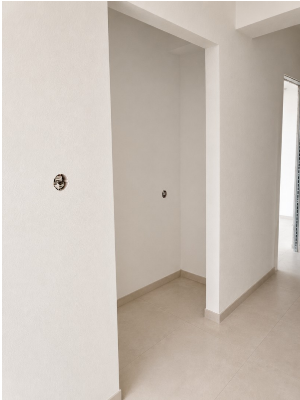
WE 2: Abstellraum