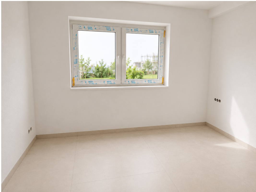
WE 2: Schlafzimmer