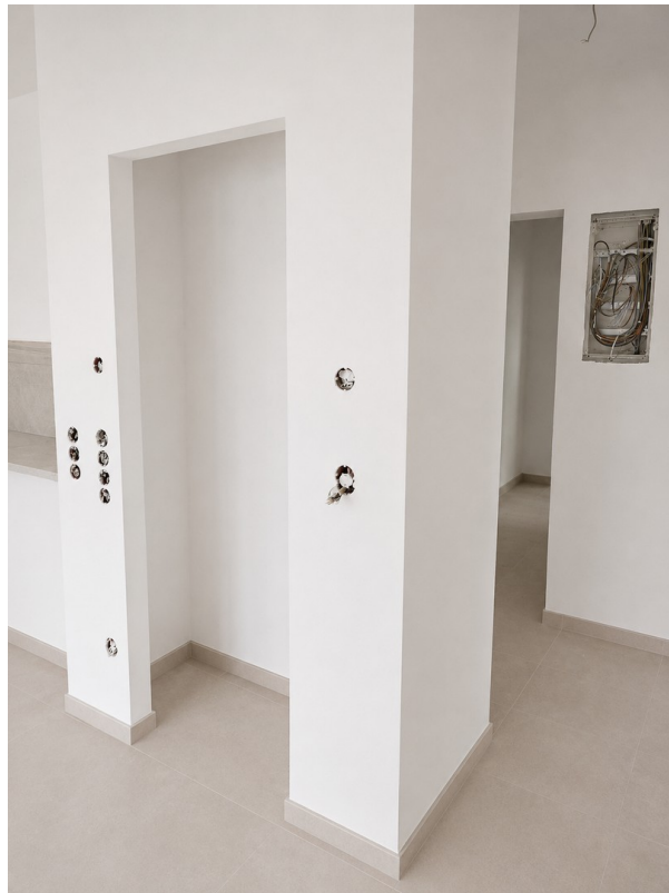
WE 1: Abstellraum neben Küche