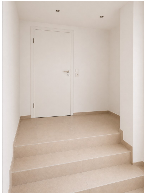
WE 2: Eingangsbereich