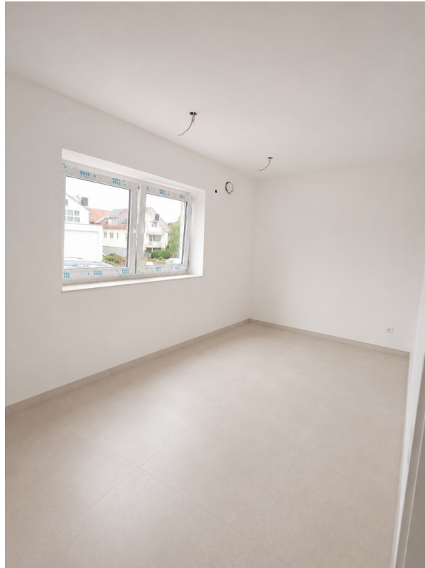
WE 1: Zimmer 1