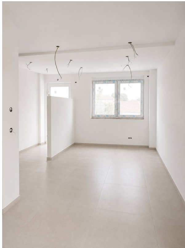
WE 1: Blick Wohnbereich