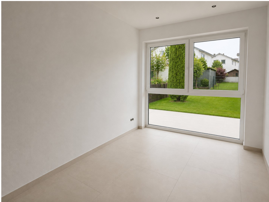
WE 2: Zimmer 2