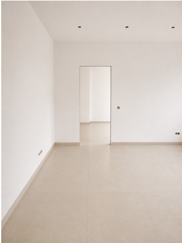
WE 2: Wohnbereich