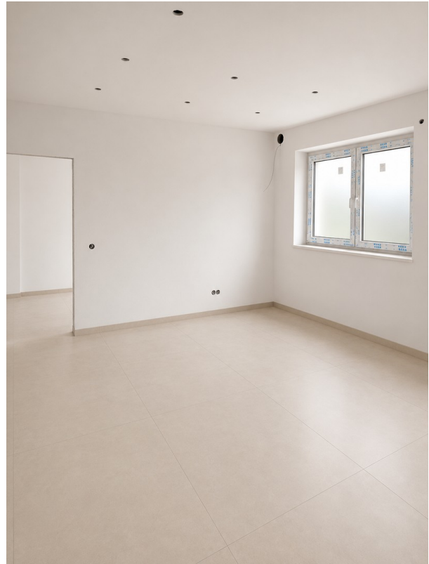
WE 2: Wohnbereich