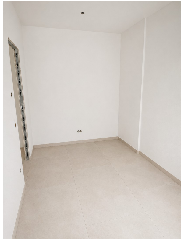
WE 2: Zimmer 2