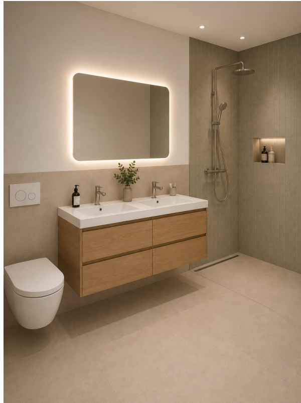
WE 2: Badezimmer Entwurf