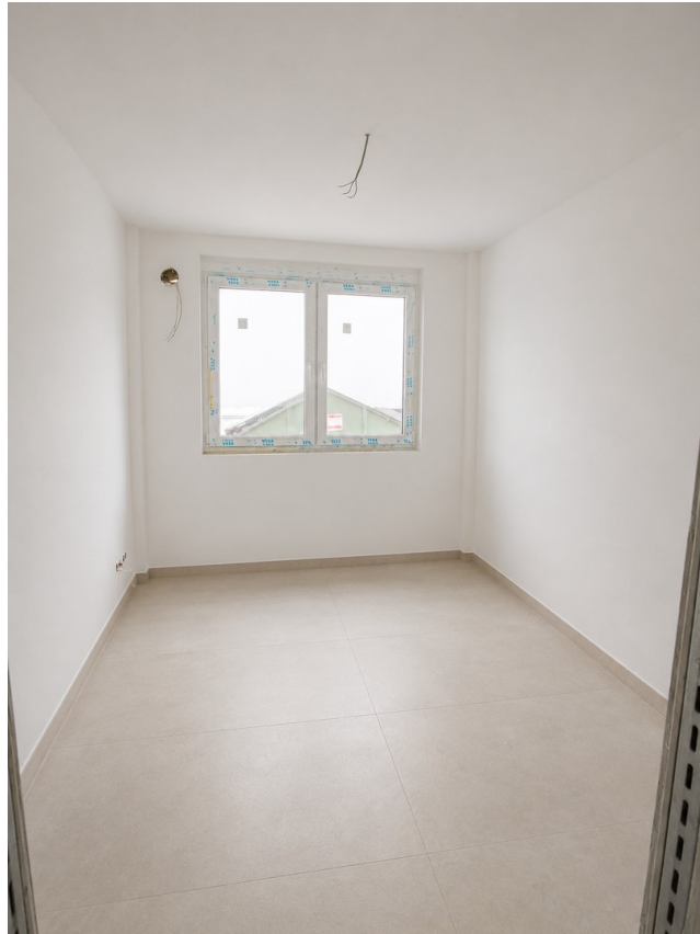
WE 1: Zimmer 2