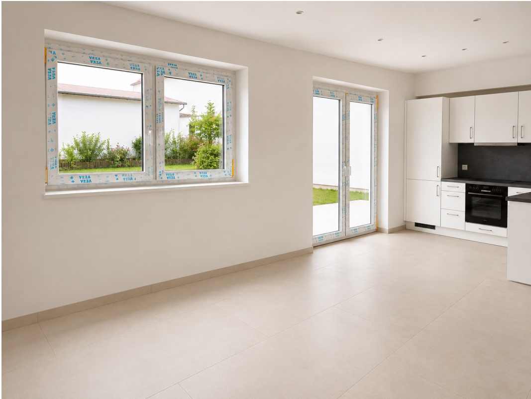
WE 2: Wohn/Essbereich m. Küche