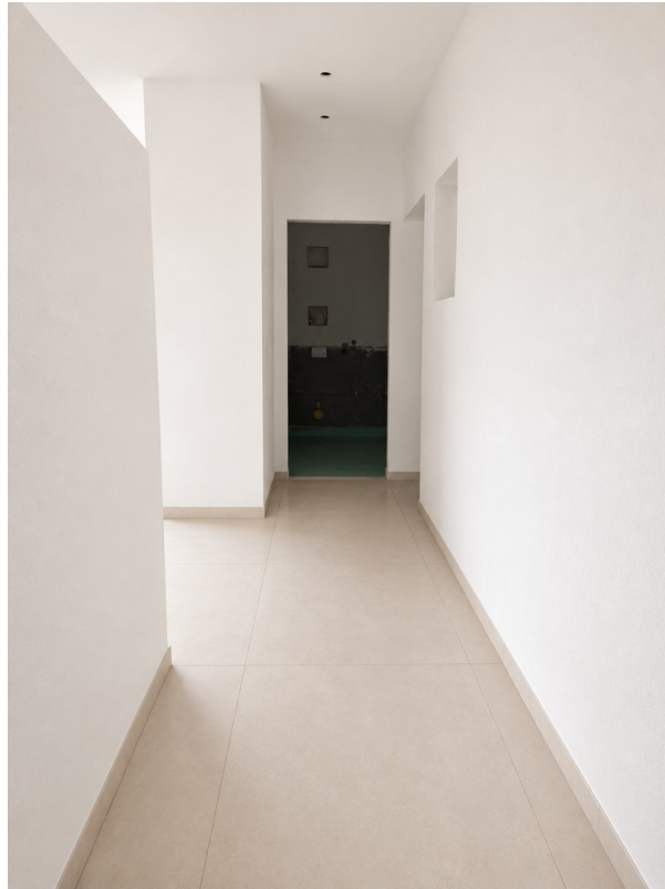
WE 1: Flur/Eingang