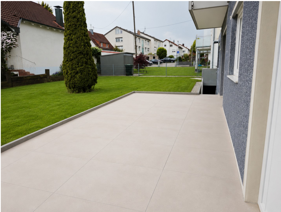
WE 2: Terrasse + Garten