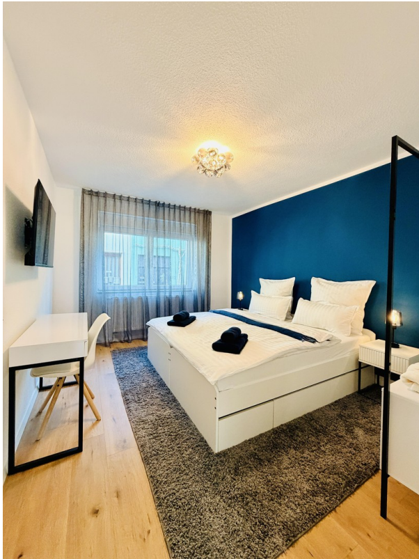
EG Schlafzimmer 1