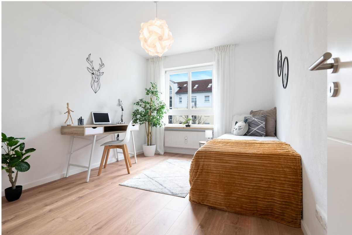
Kinderzimmer / Büro / Gast