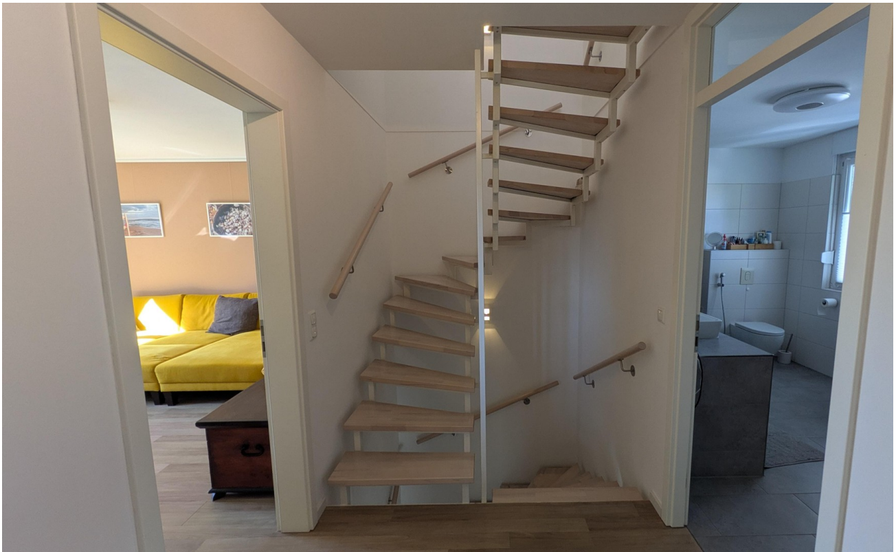
OG - Flur und Treppenaum