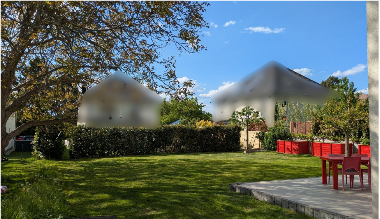
Gartensicht mit Nussbaum