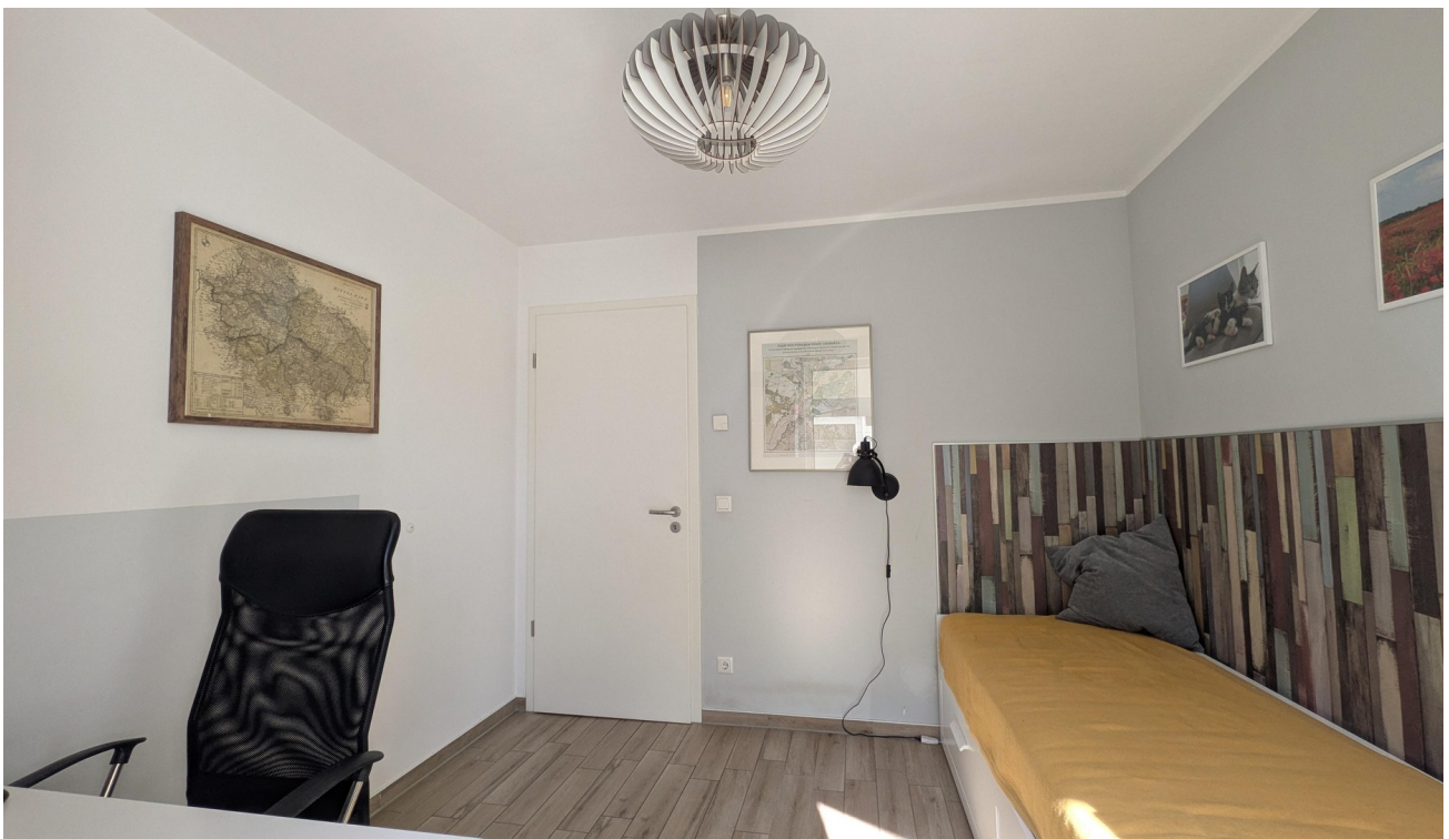
EG - Wohnraum