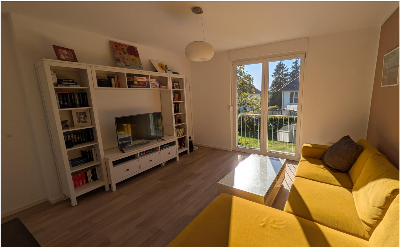
OG - Wohnraum 1