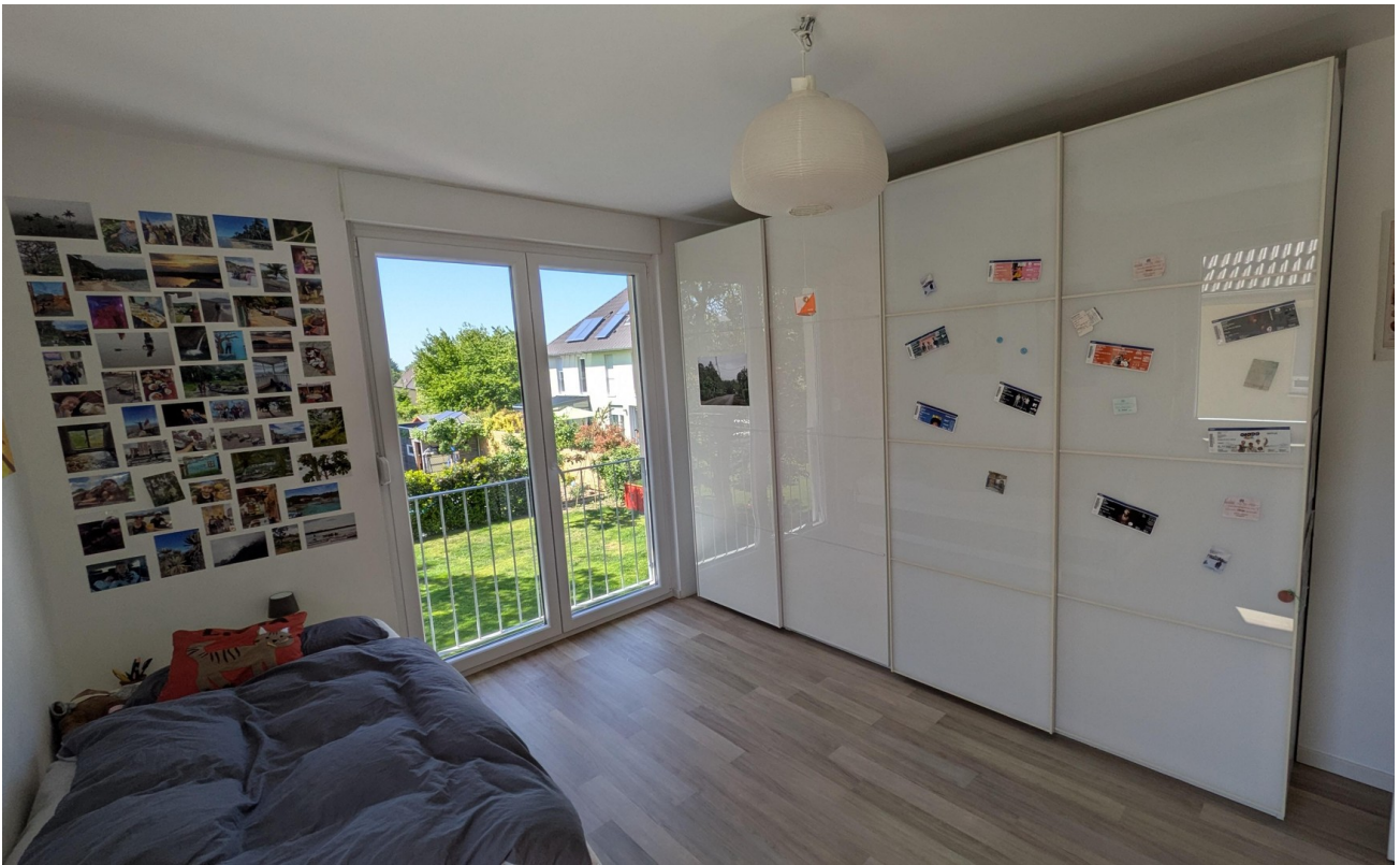
OG - Wohnraum 2