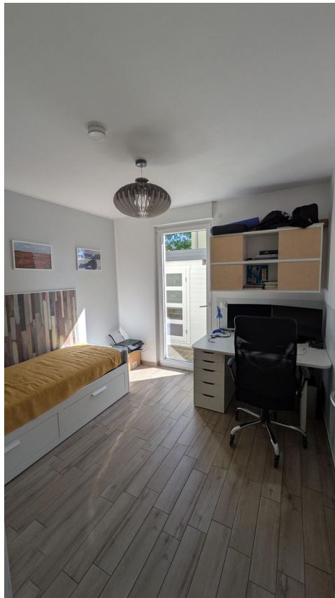
EG - Wohnraum