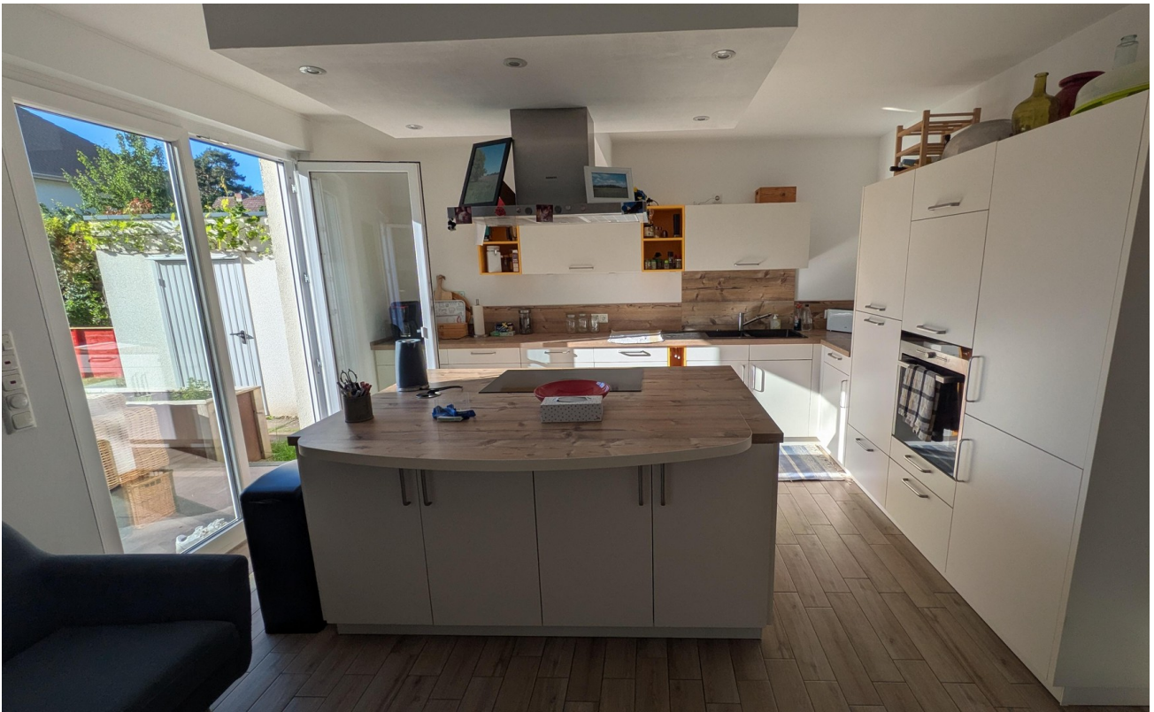
EG - Wohnküche