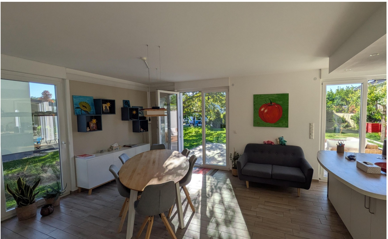
EG - Wohnküche