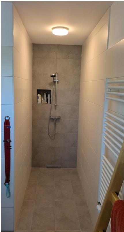
OG - Bad - Dusche