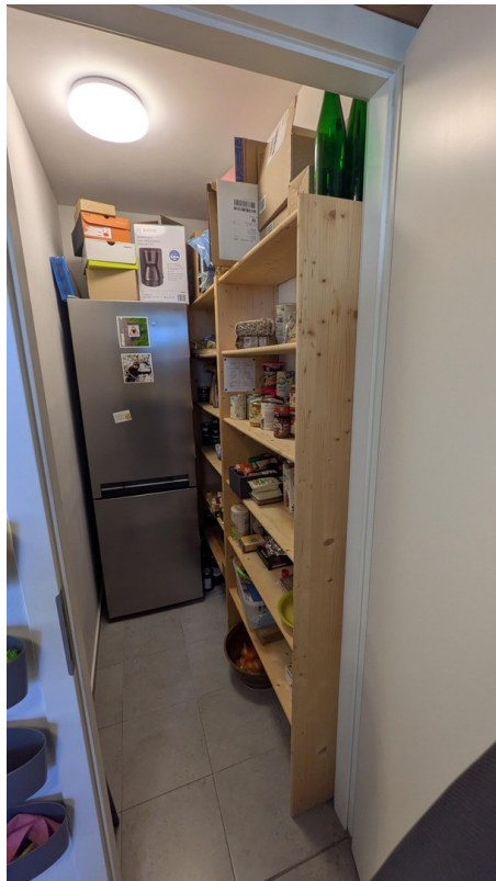
EG - Vorratsraum