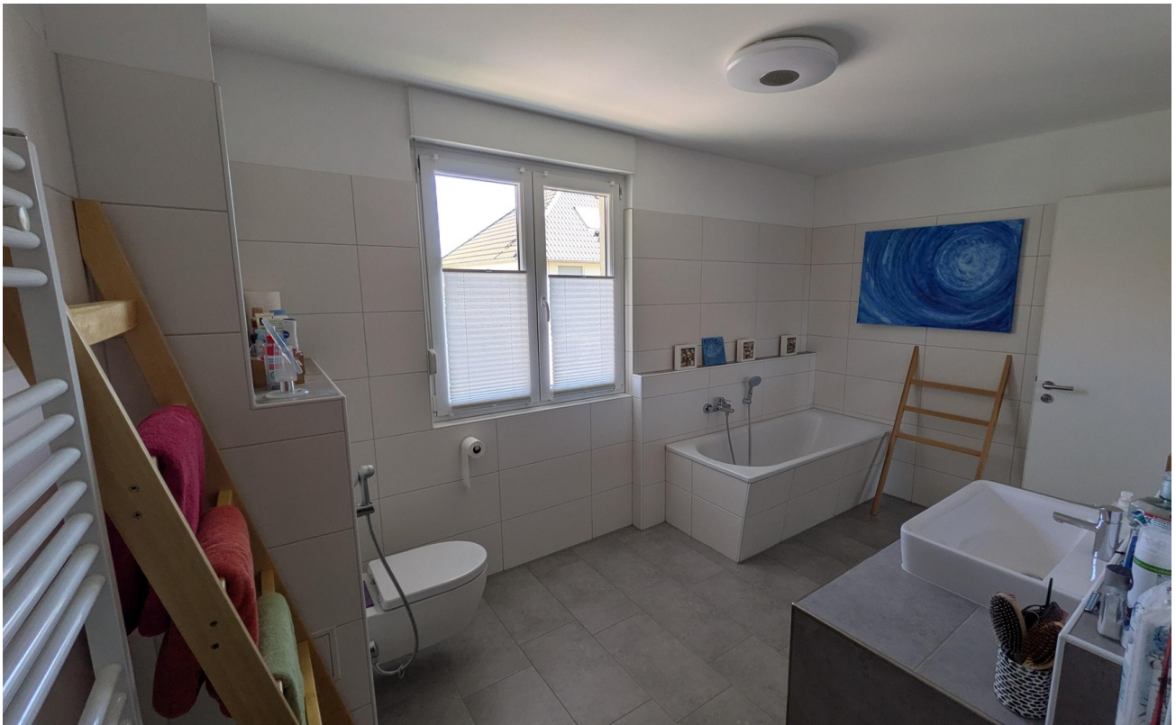
OG - Bad