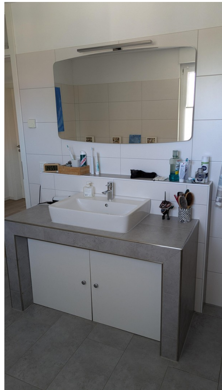
OG - Bad - Waschtisch