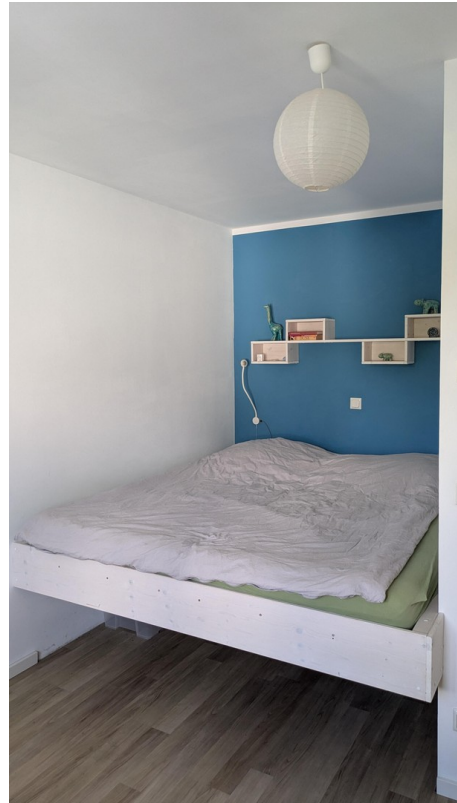
OG - Wohnraum 3