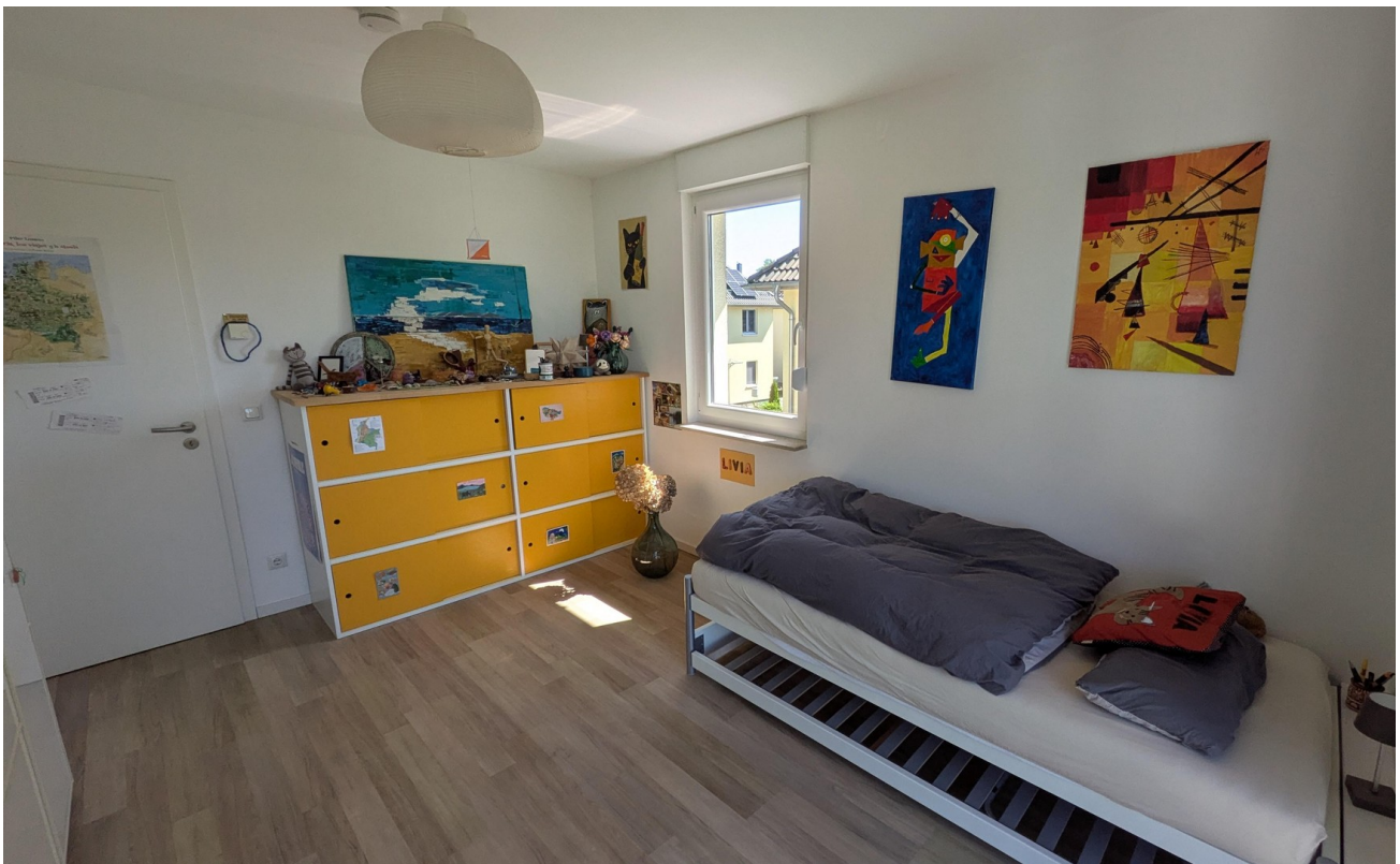
OG - Wohnraum 2