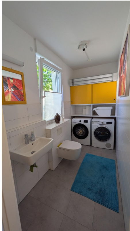
EG - Gäste-WC