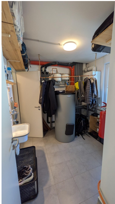
EG - Hausanschlussraum