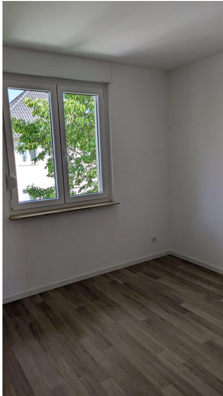
OG - Wohnraum 3