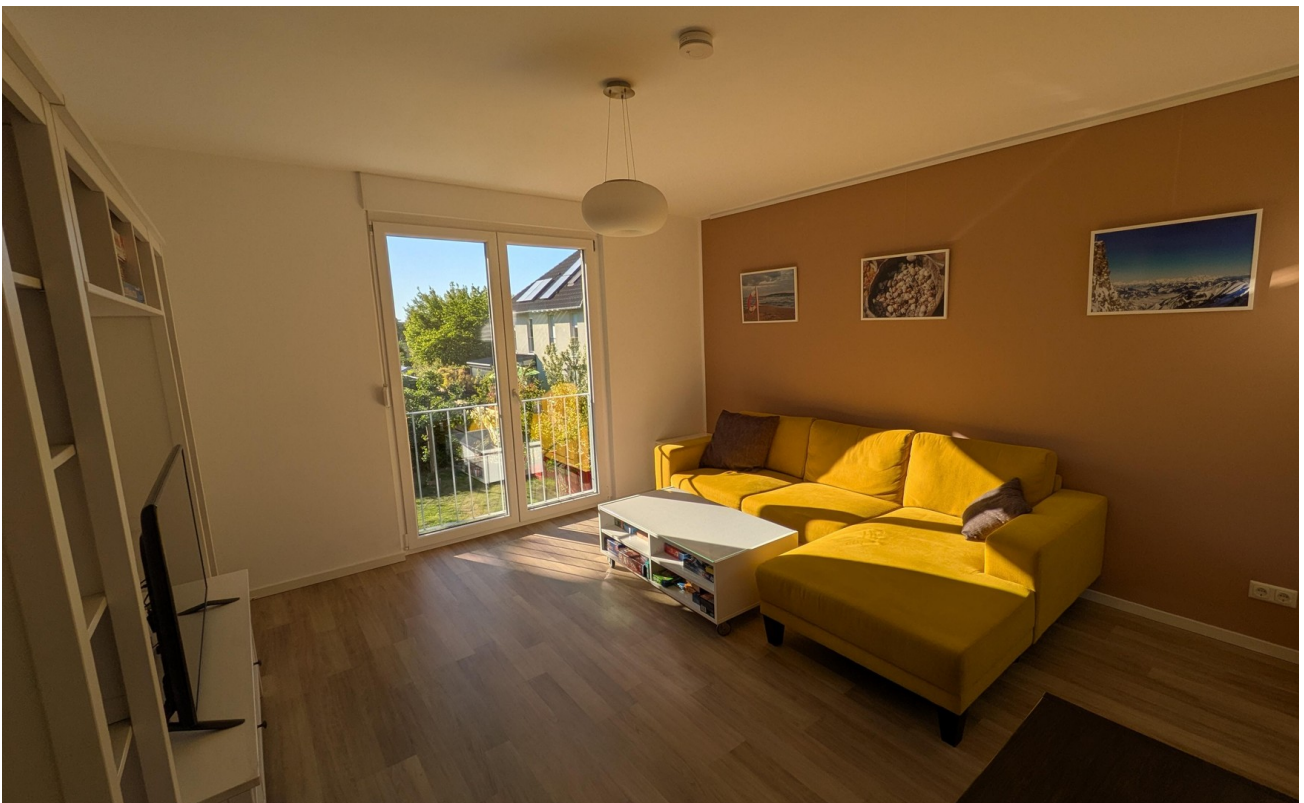
OG - Wohnraum 1