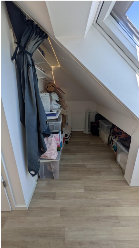
DG - Stauraum