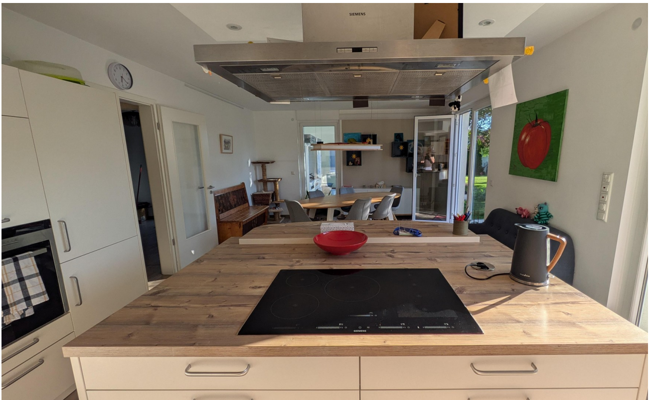
EG - Wohnküche