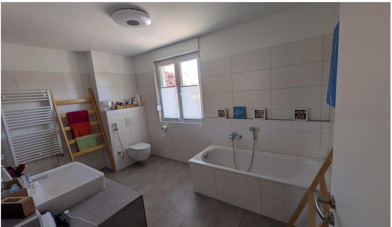
OG - Bad