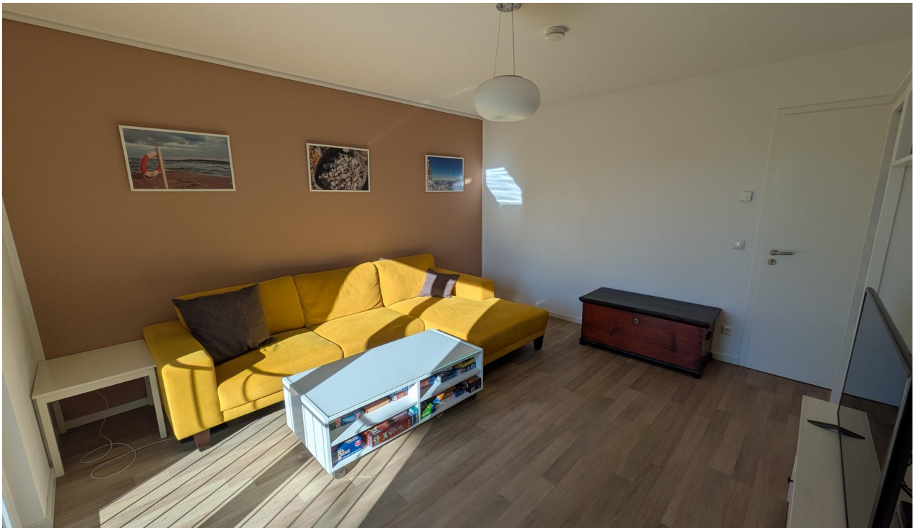
OG - Wohnraum 1