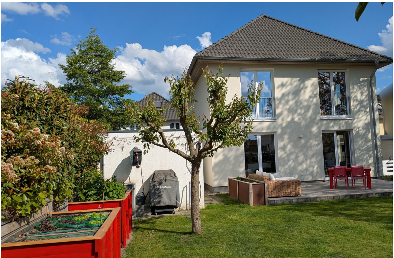
Gartensicht mit Terrasse