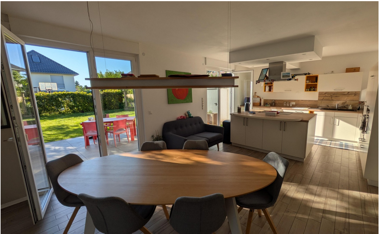
EG - Wohnküche