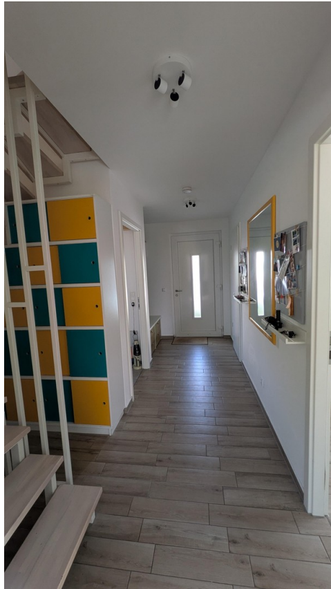
EG - Flur und Hauseingangstür