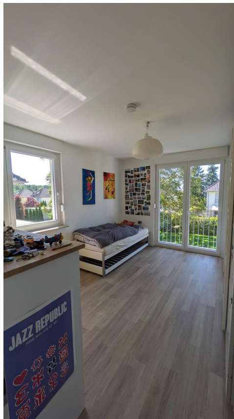
OG - Wohnraum 2