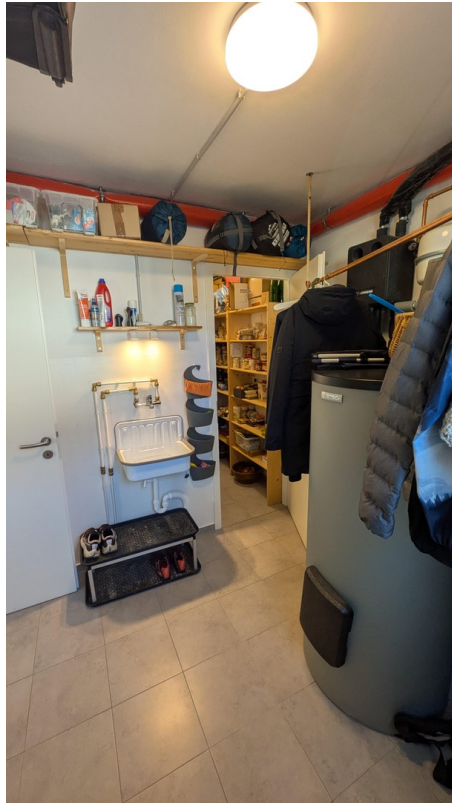
EG - Hausanschlussraum