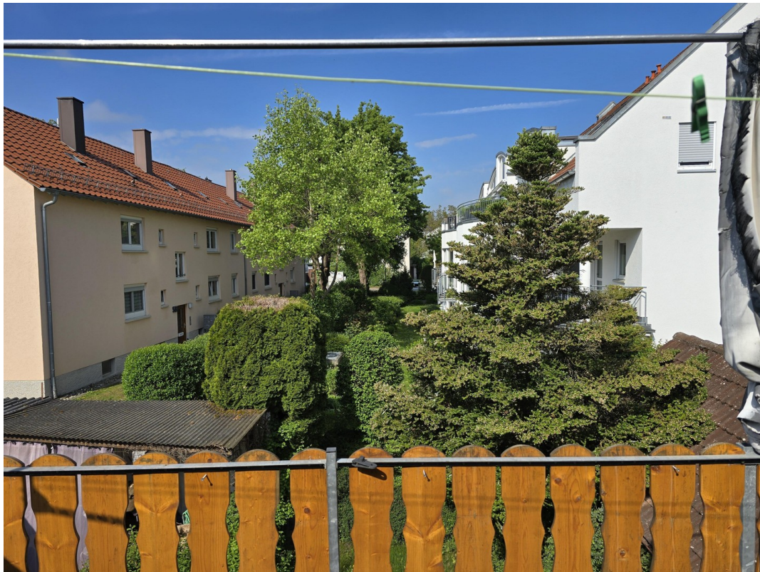
Balkon, westlich ausgerichtet