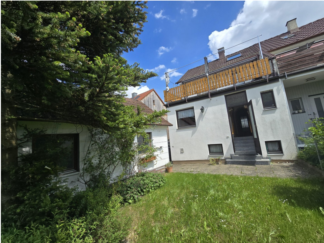
Blick zum Hauseingang