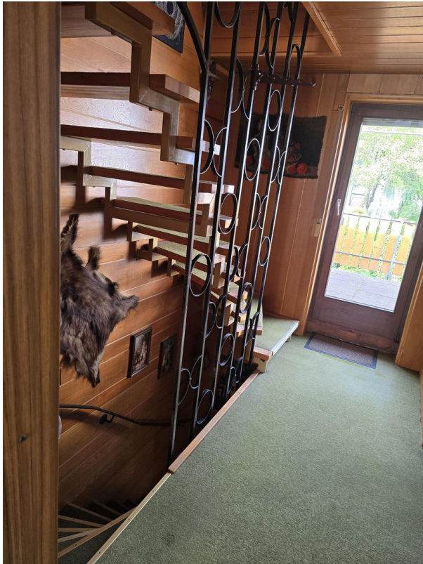
1.OG Blick zum Balkon