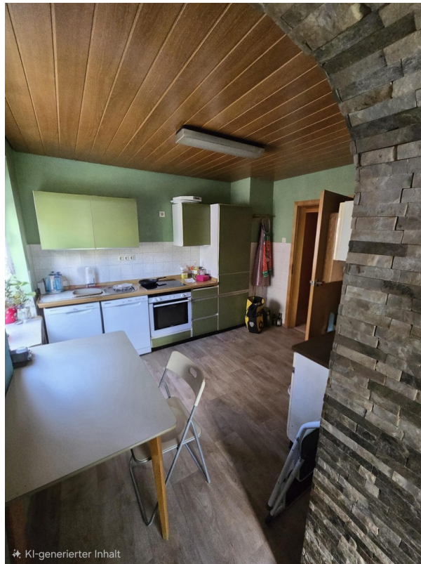
Blick vom Esszimmer zur Küche