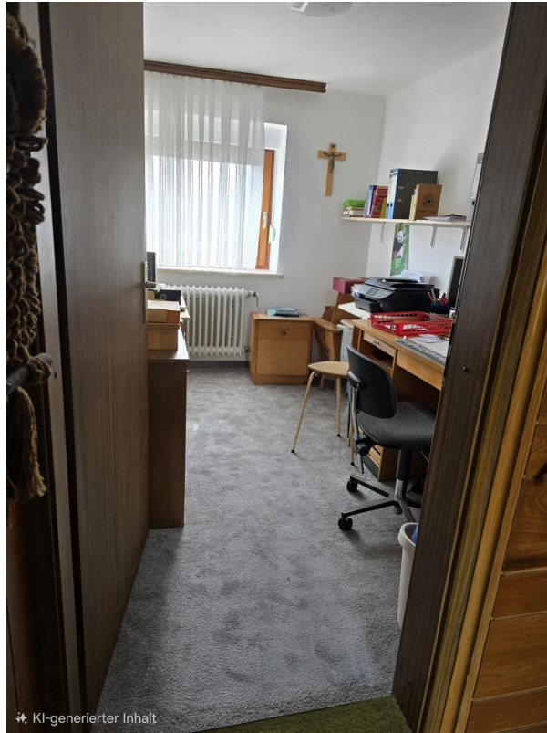
1.OG 1. Zimmer