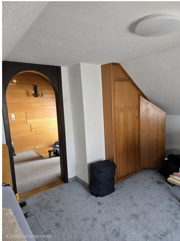
DG Zimmer mit Vorraum