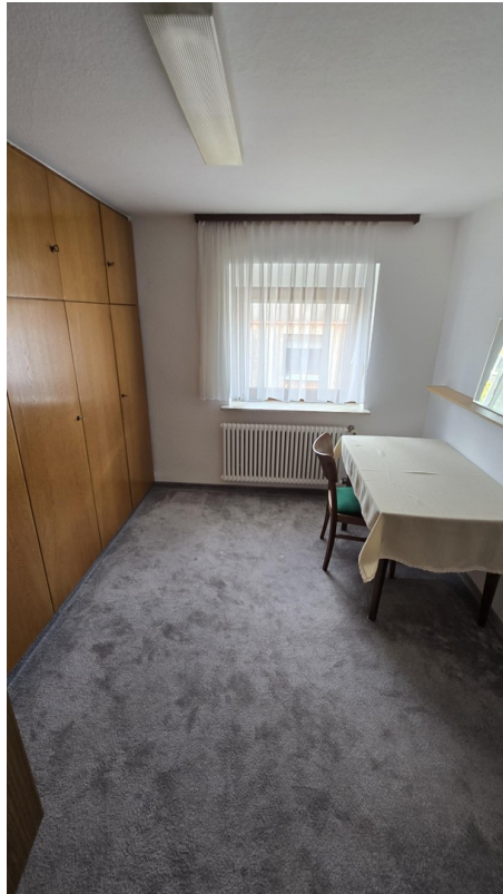
1.OG 3. Zimmer