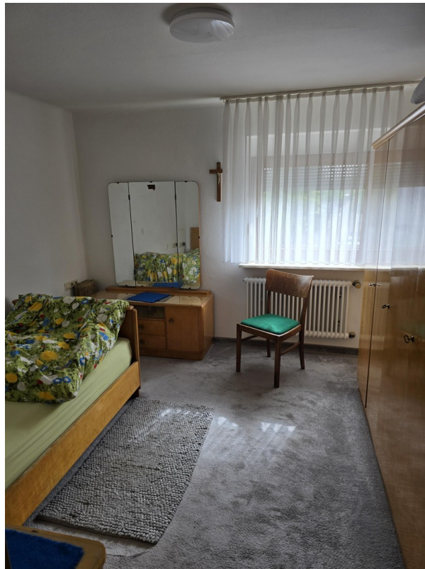
1. OG 2. Zimmer