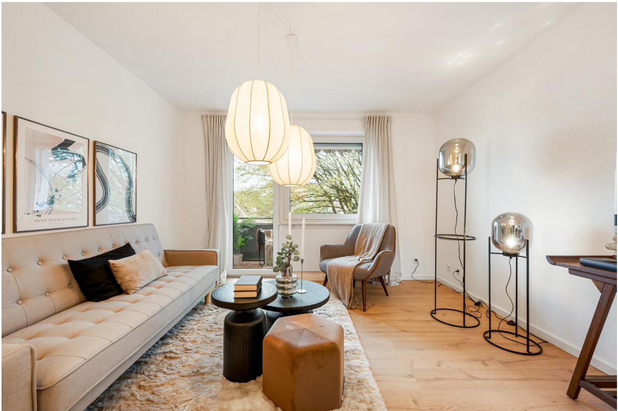
Wohnzimmer mit Zugang zum Balkon