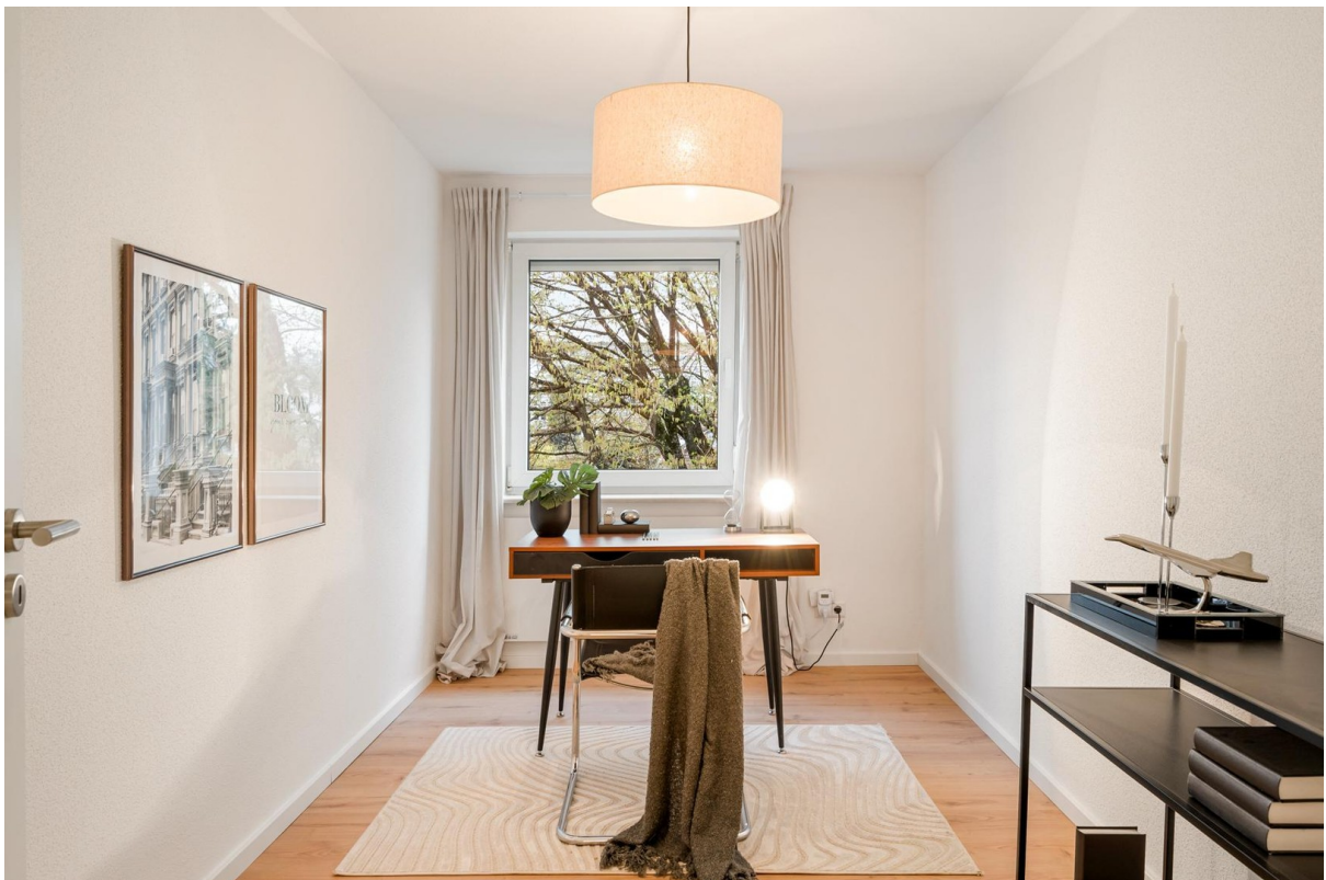
Individuell nutzbares Zimmer