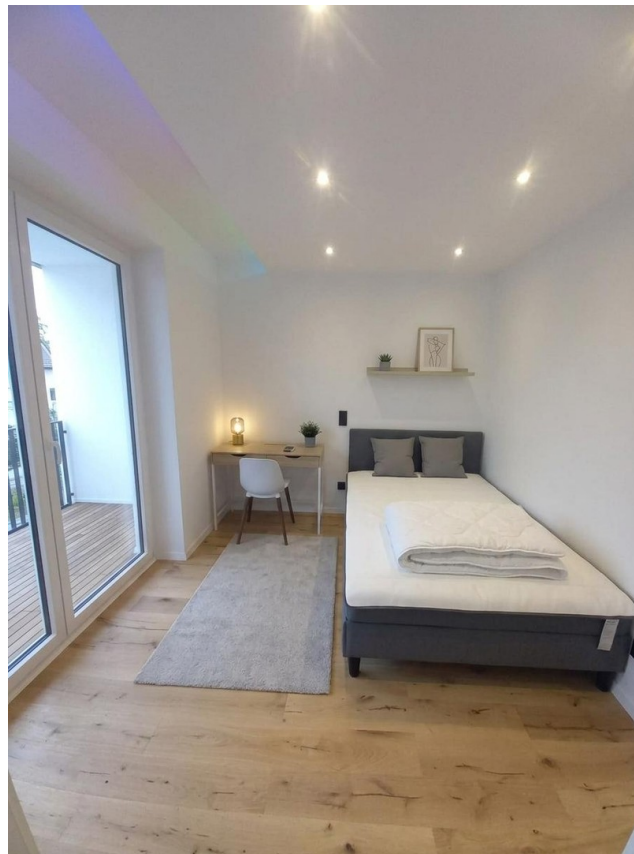
Zimmer 1 mit Balkon