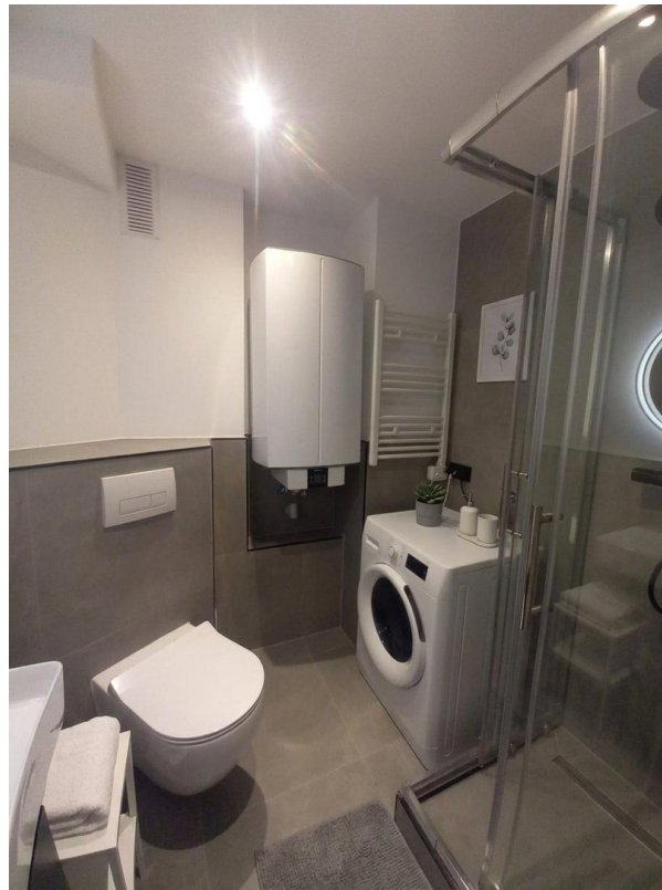
Bad mit Waschmaschine