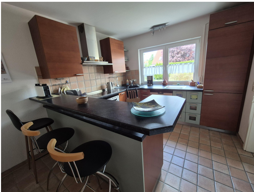
Theke in der Küche