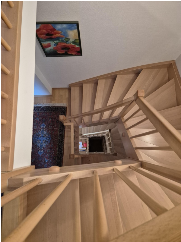
Treppenhaus vom Spitzboden