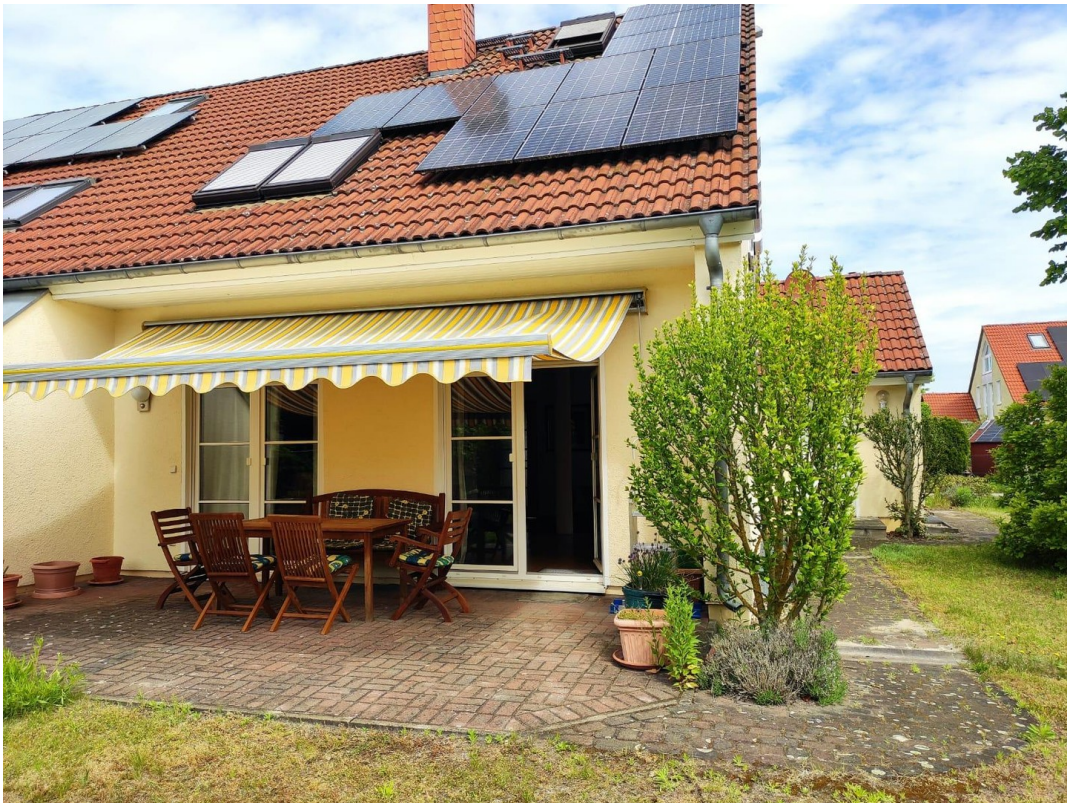
Dach mit PV Anlage