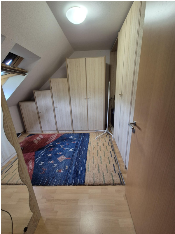
Begehbarer Kleiderschrank (BKS)