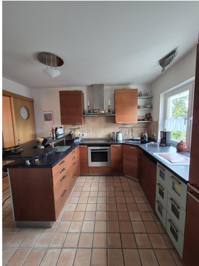
Küche vom HauswirtschaftsR.