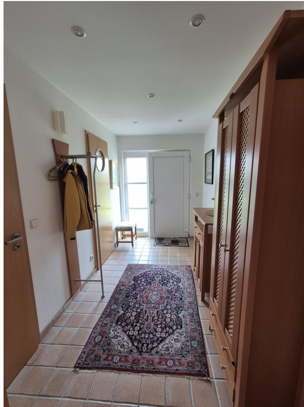
Eingangflur, Sicht Wohnraum