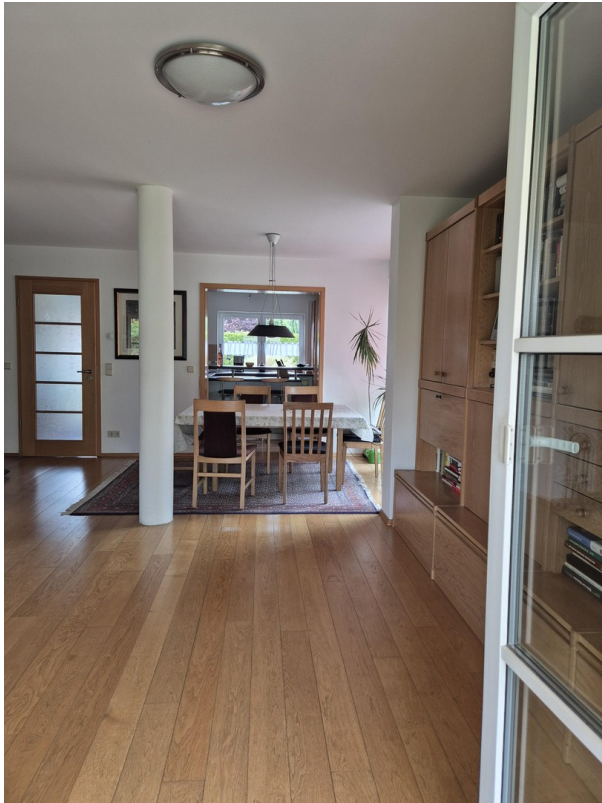
Terrasse Blick Küche