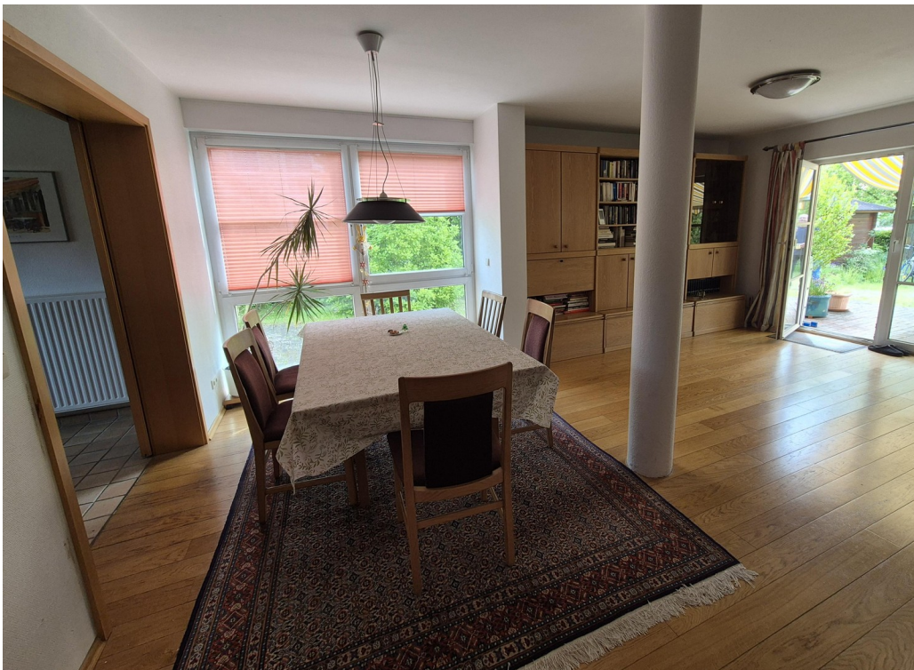
Blick in Wohnbereich