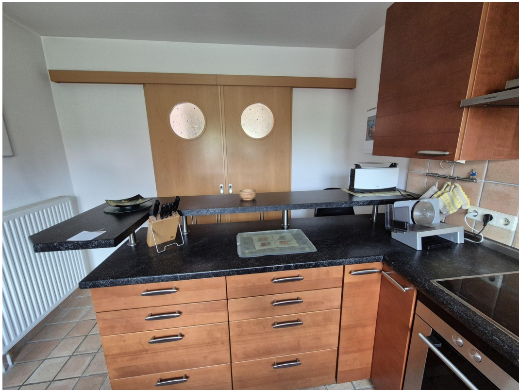
Küche mit Schiebetür zum Wohnbereich