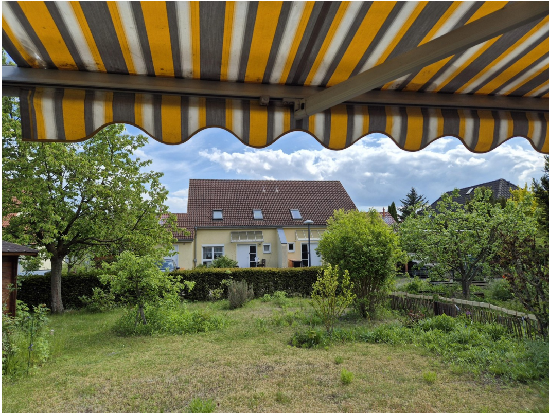
Blick zum Nachbarhaus gegenüber