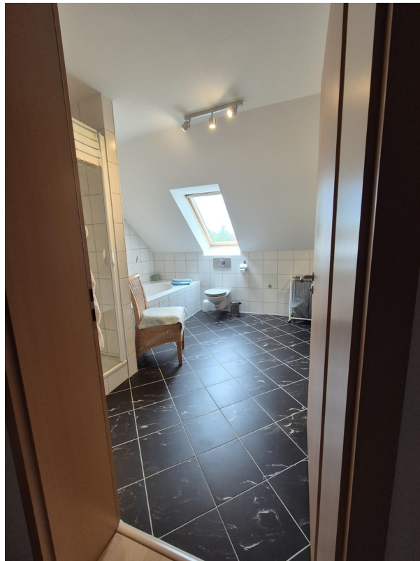
Einblick Bad 1.OG