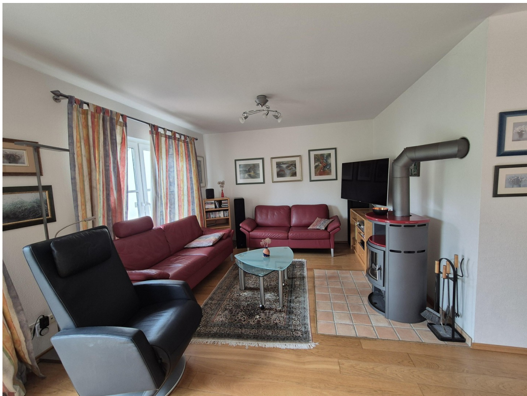
Sitzecke, Fernsehen, Kamin