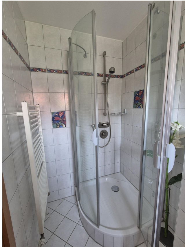
Dusche im GästeWC