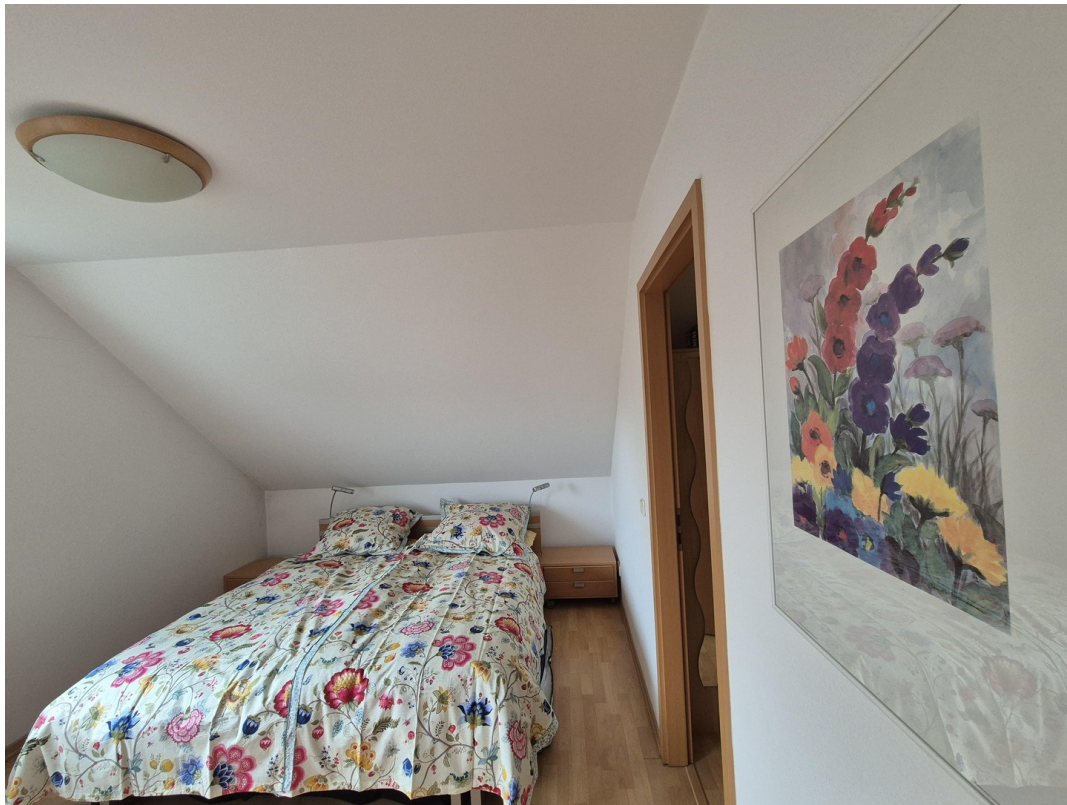
Schlafzimmer 1, Tür BKS