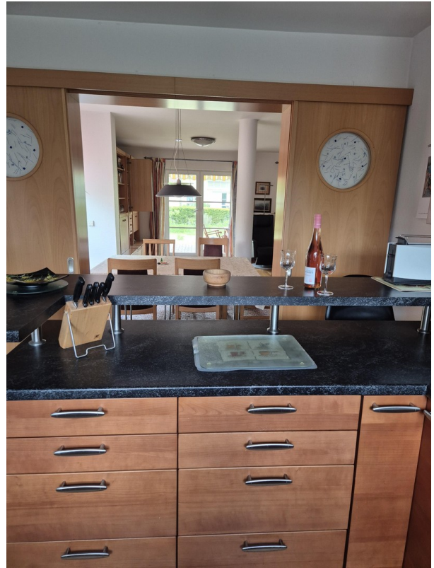
Blick Küche in Wohnbereich