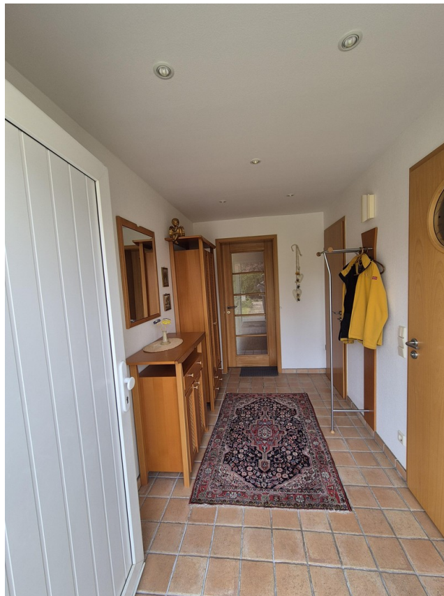
Eingangslur, Sicht Haustür