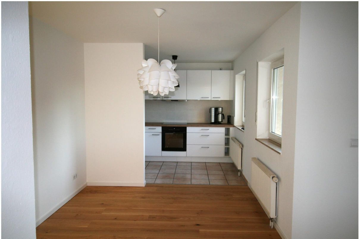
Ess- / Arbeitsbereich