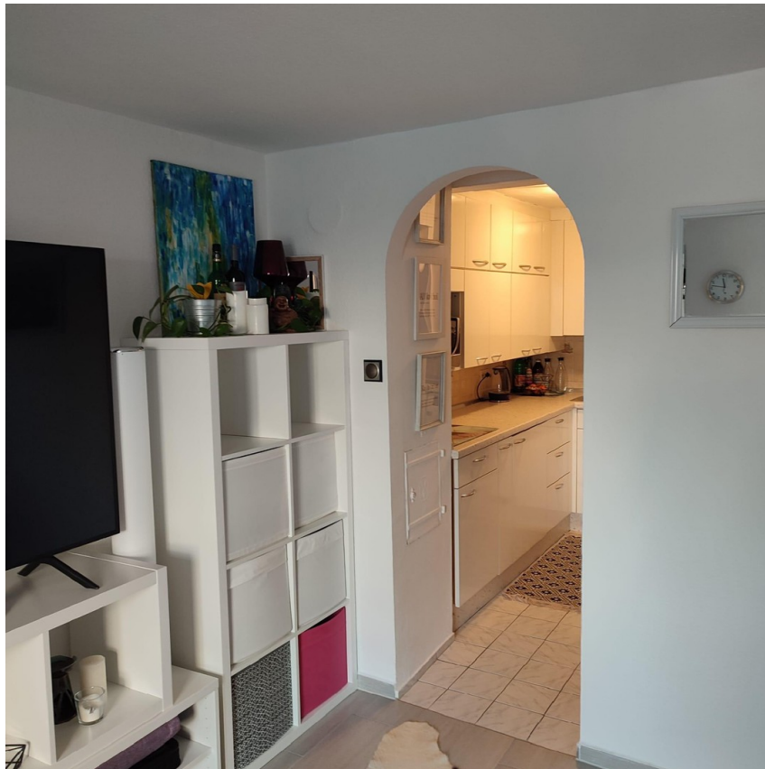
Zugang zur Küche