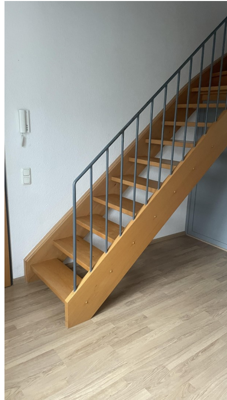
Treppe zum Dachgeschoss