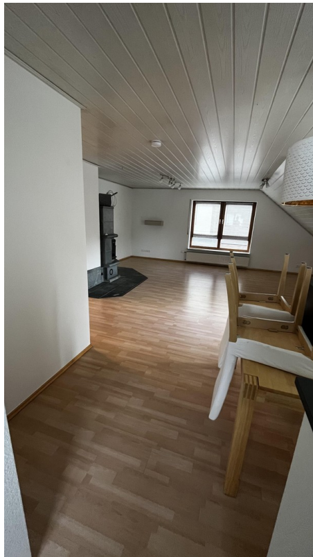
Esszimmer / Wohnzimmer