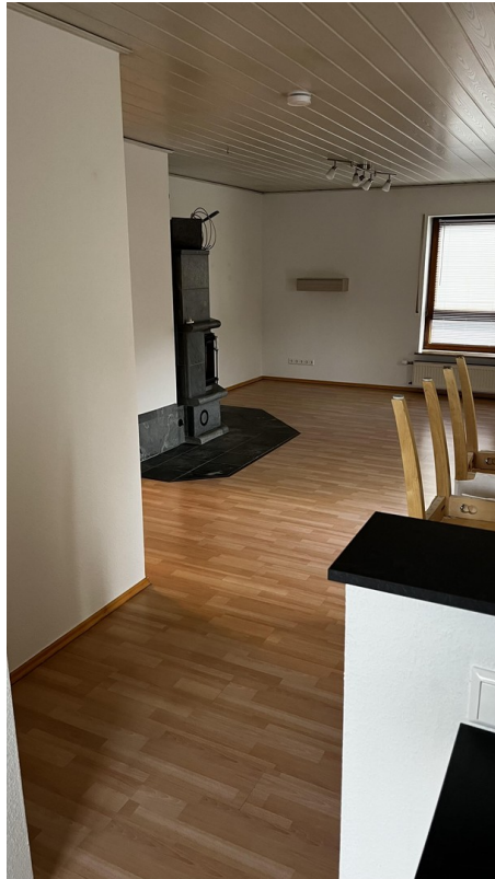
Esszimmer / Wohnzimmer