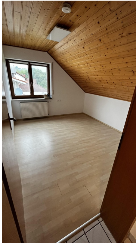
Büro / 2. Schlafzimmer