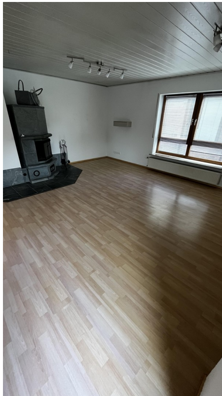
Esszimmer / Wohnzimmer