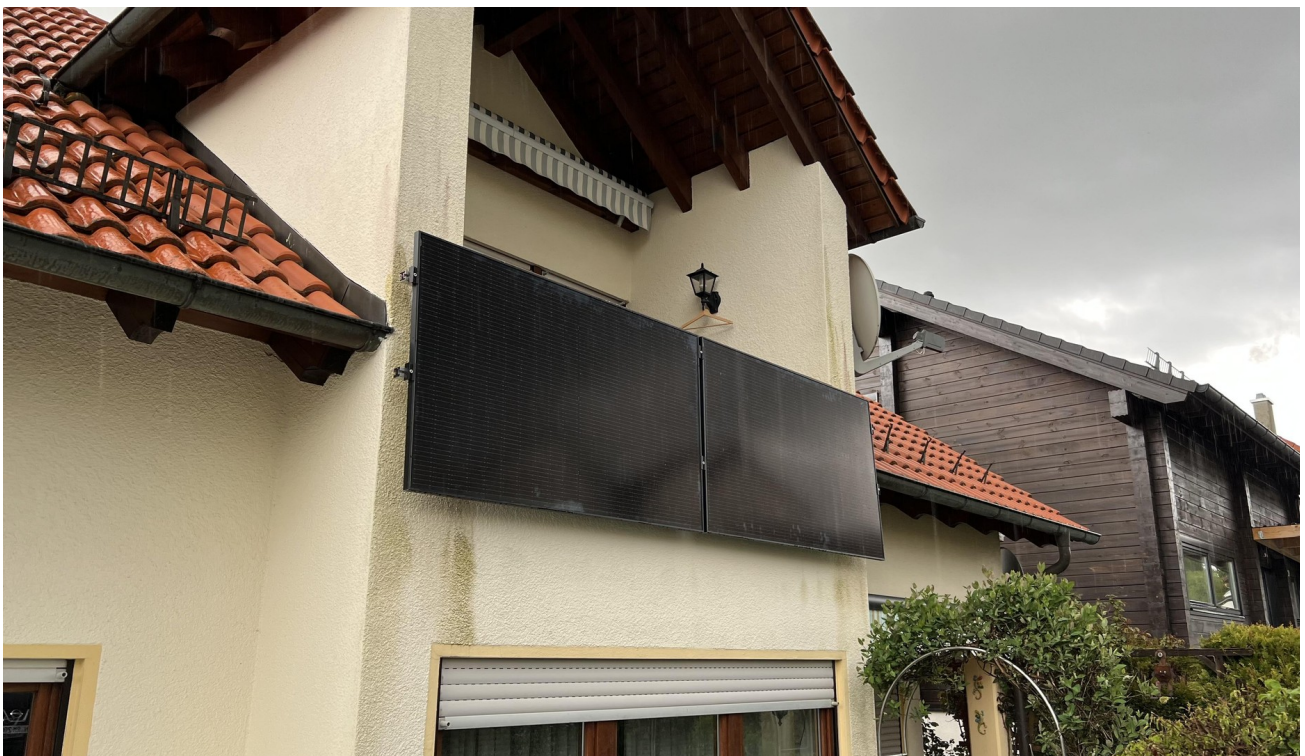
Außenansicht / Balkonkraftwerk