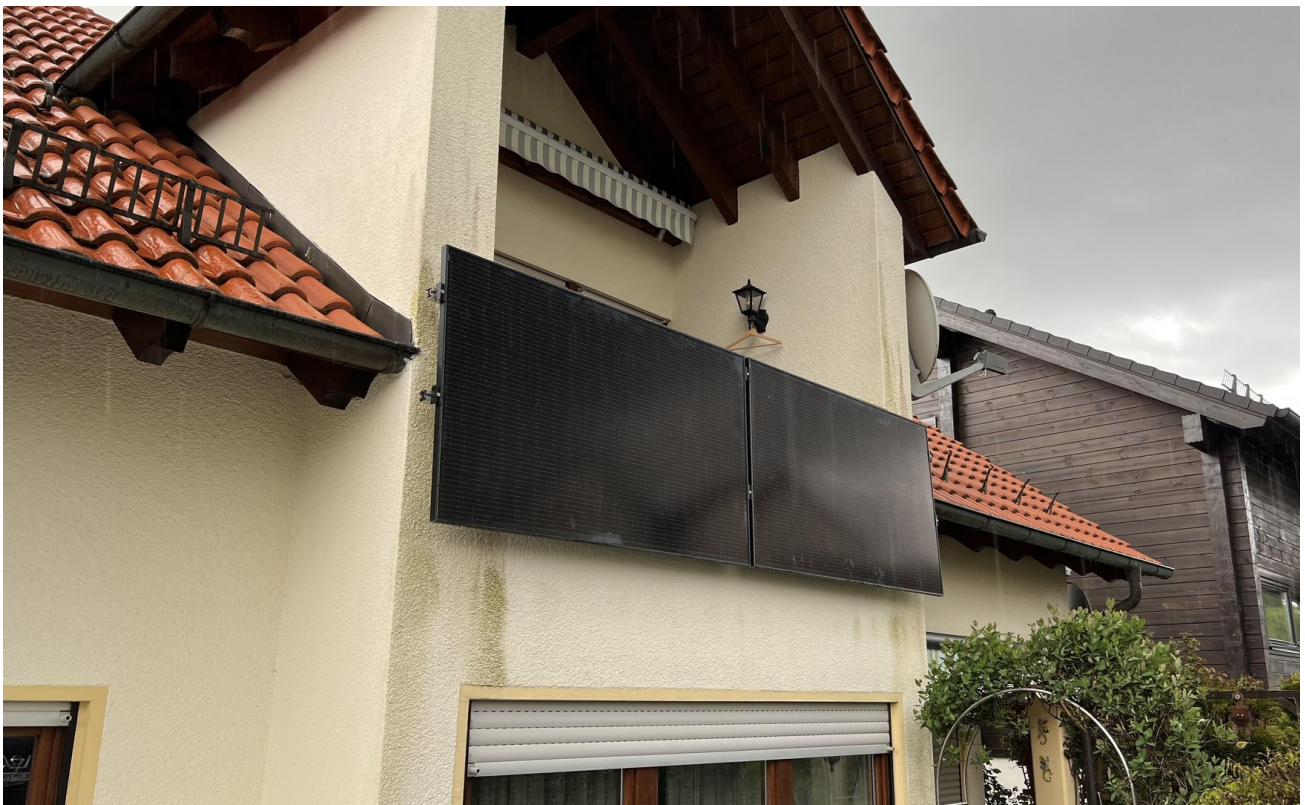
Außenansicht / Balkonkraftwerk