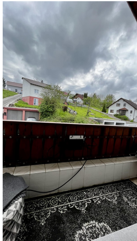
Balkon / Aussicht