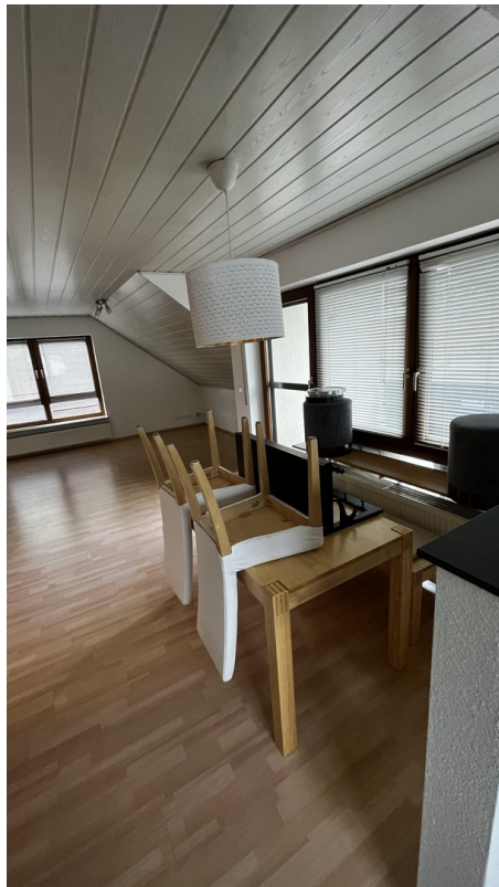
Esszimmer / Wohnzimmer