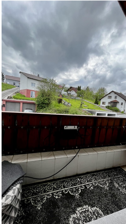
Balkon / Aussicht