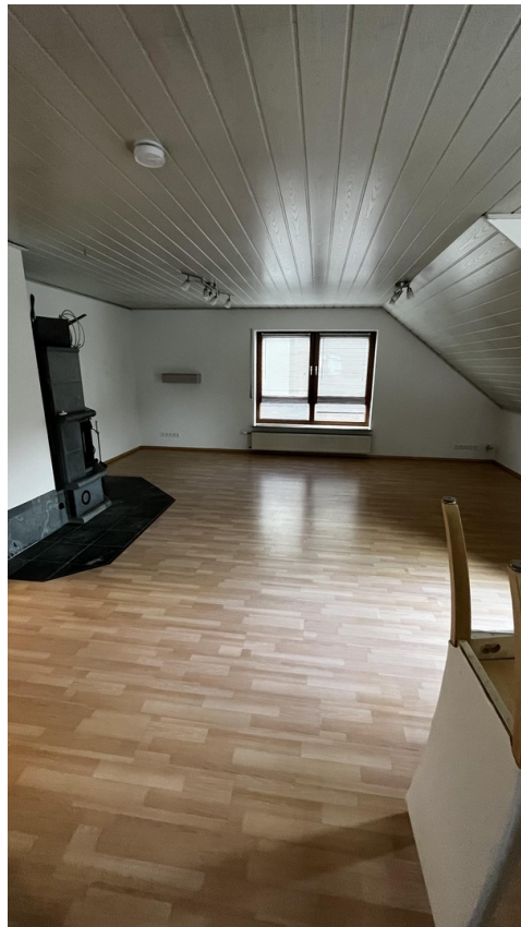
Esszimmer / Wohnzimmer