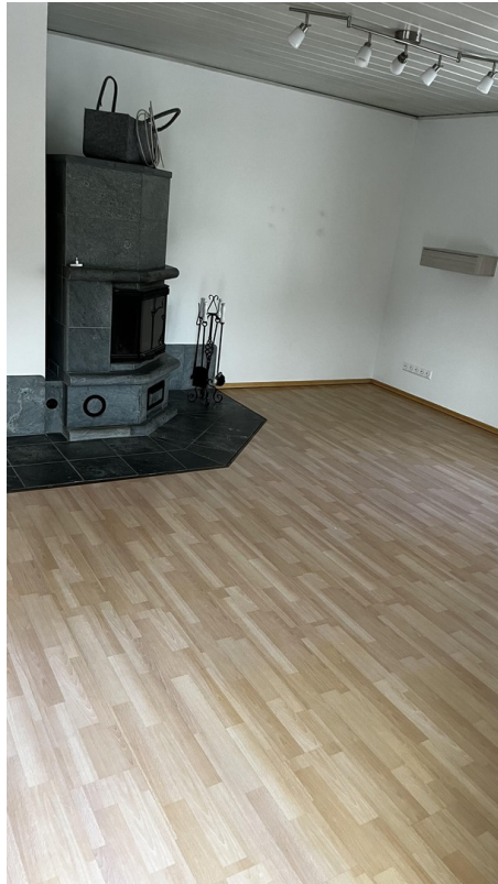
Esszimmer / Wohnzimmer