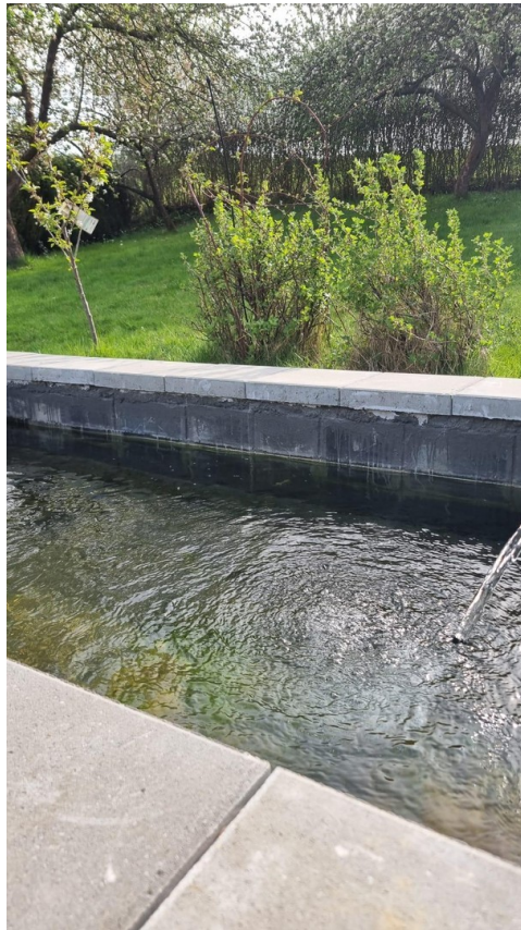
Bachwasser 7m vom Haus