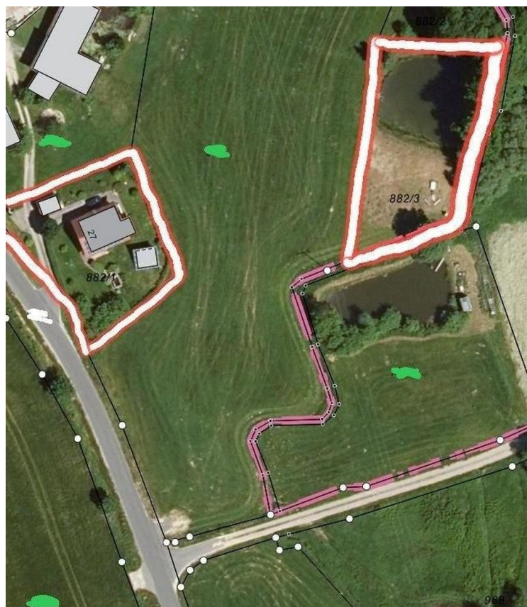
2 markierte Grundstücke