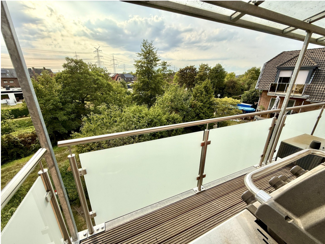
Balkon mit Aussicht