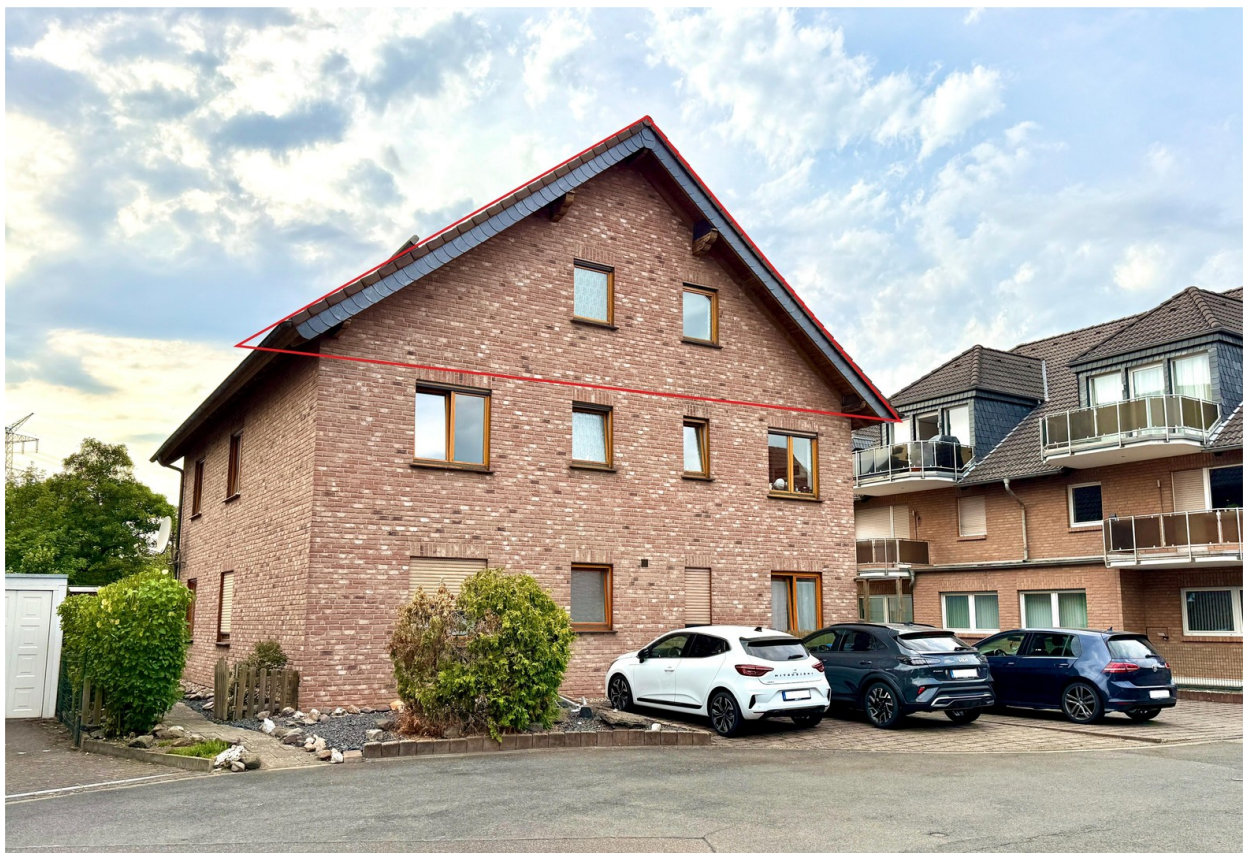
Vorderansicht des Hauses