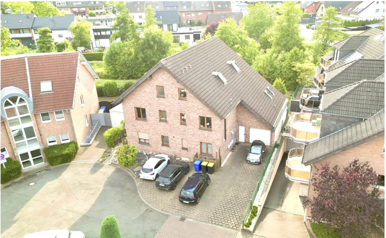
Luftaufnahme von vorne