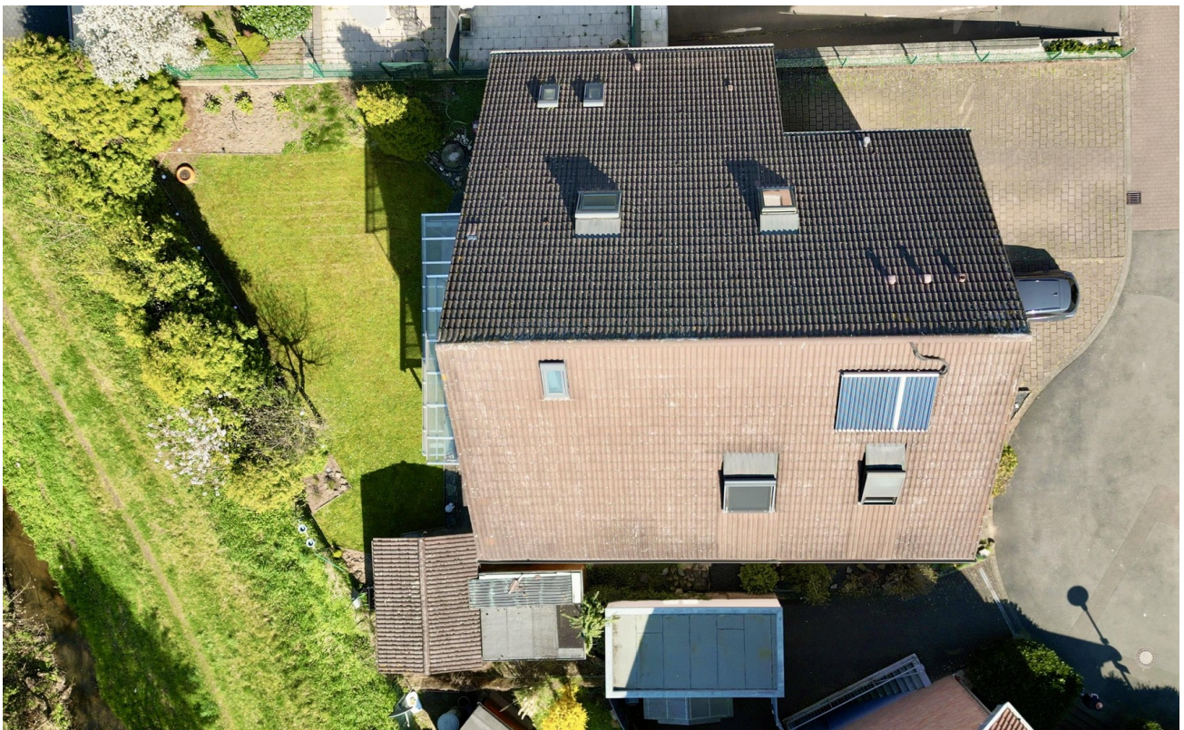
Luftaufnahme vom Dach