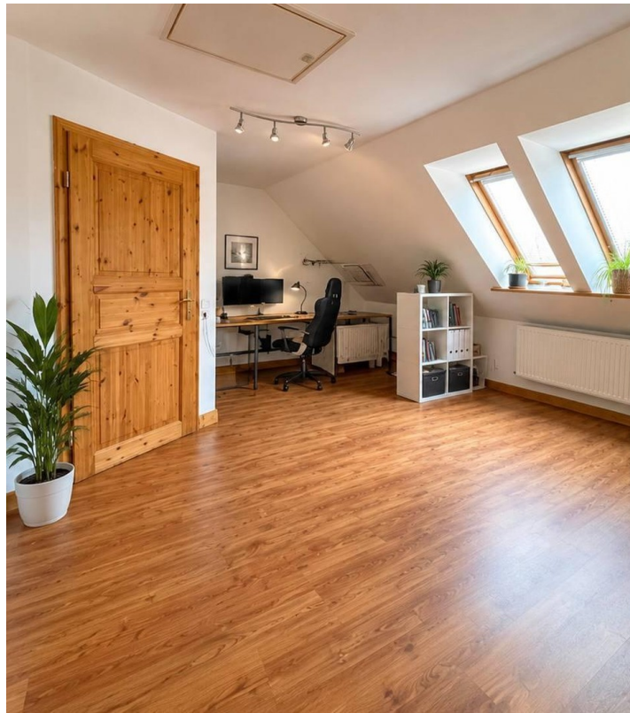
Schlafzimmer 1 OG