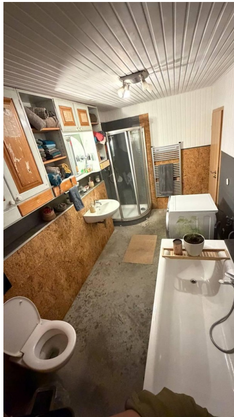
Bad EG, Dusche + Badewanne