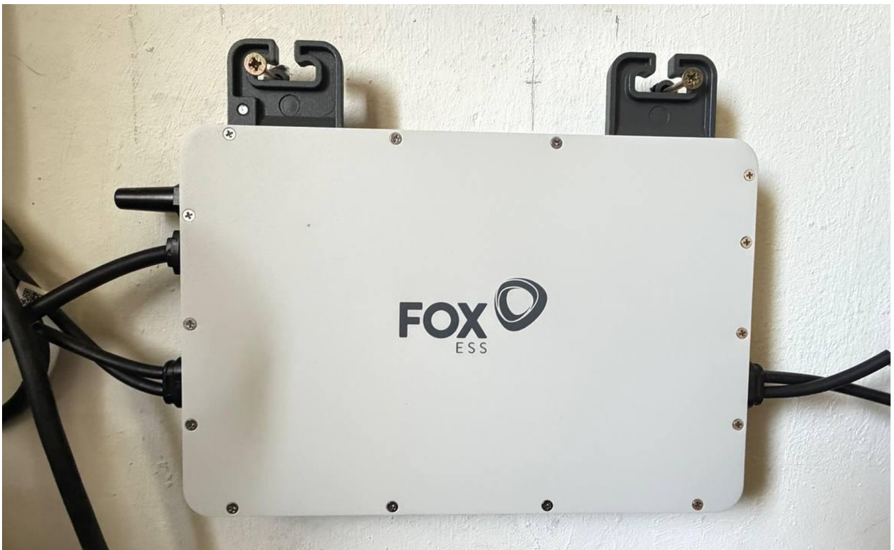
Solar Balkonkraftwerk 2 kW