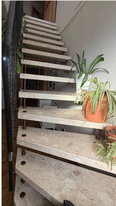
Treppenaufgang zum OG