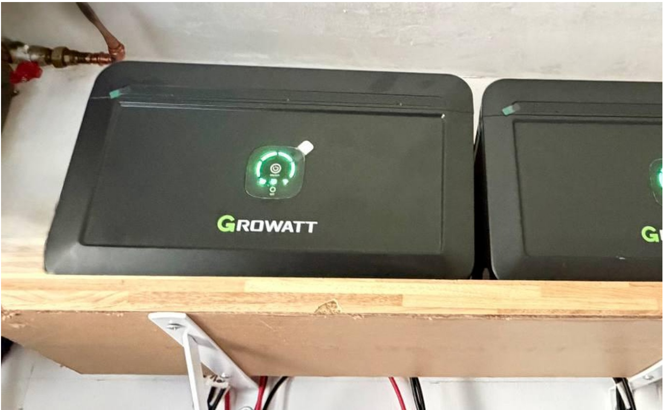
Solarspeicher Module 4 kW