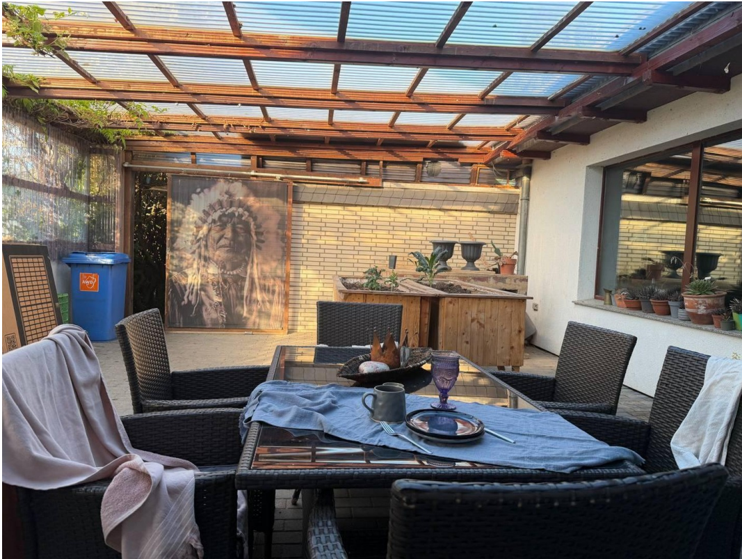
Windgeschützte Terasse 2