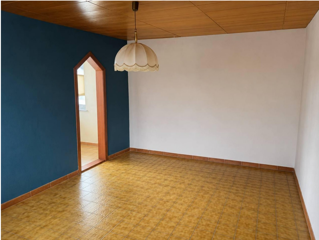
Master Schlafzimmer EG