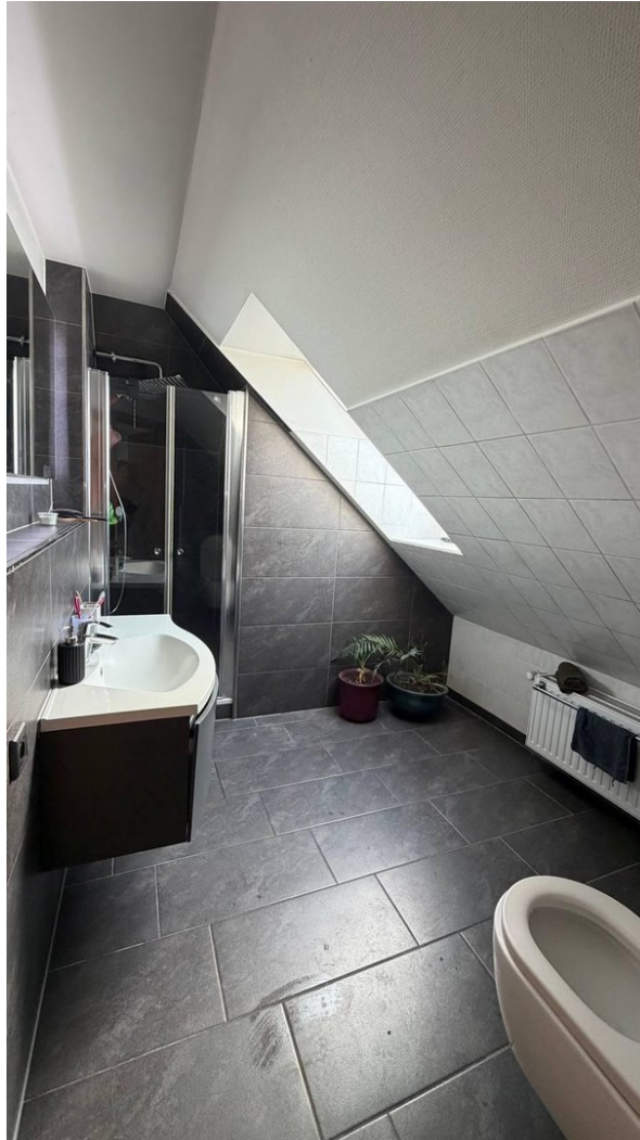
Badezimmer OG, Dusche