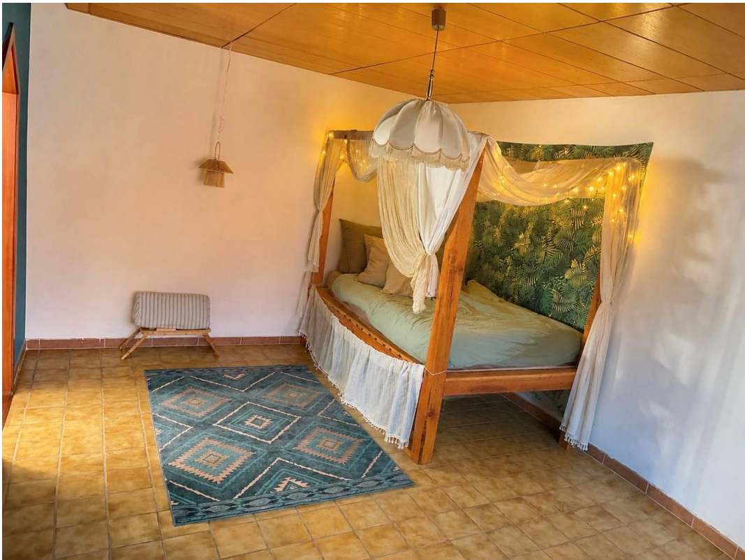
Master Schlafzimmer EG 2