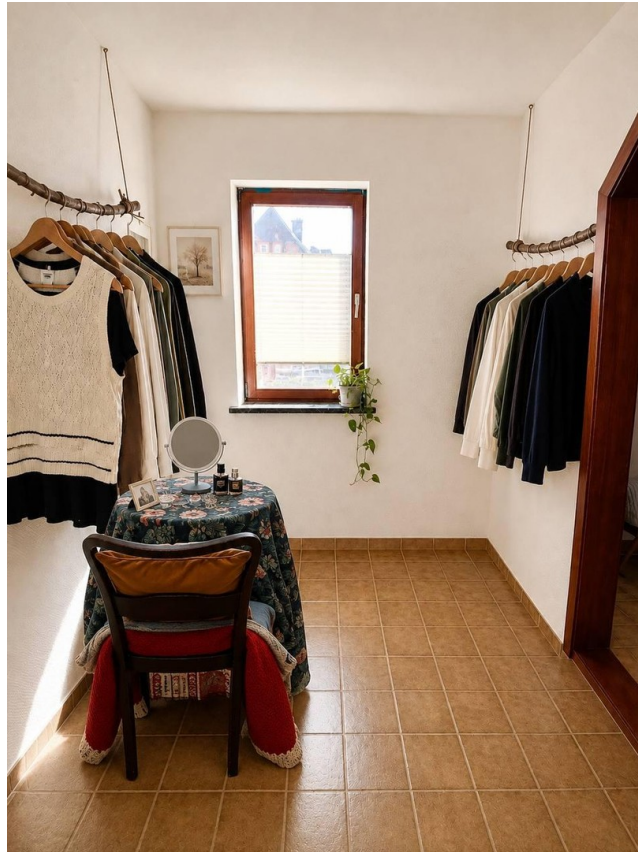
Ankleidezimmer vom Masterschl.