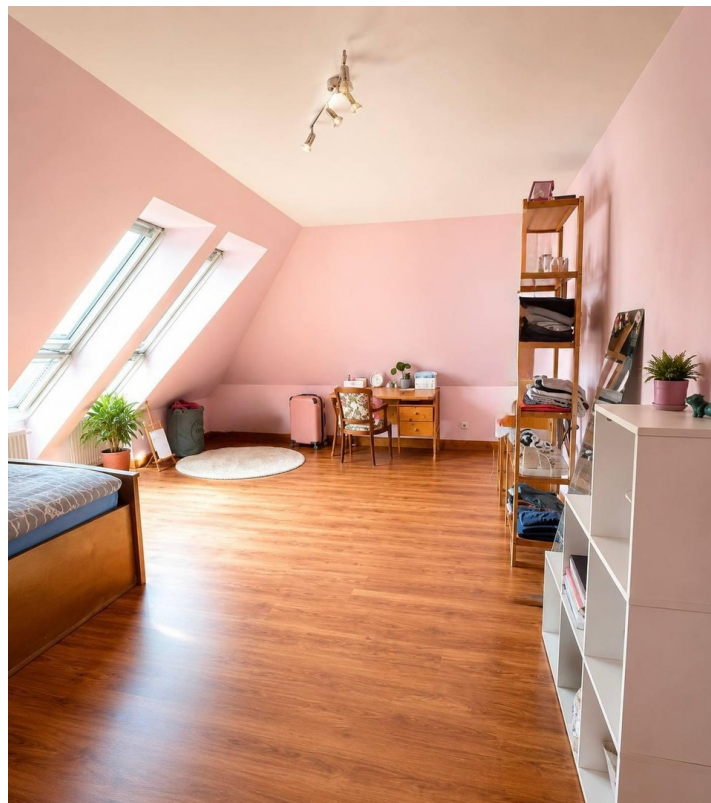
Schlafzimmer 3 OG