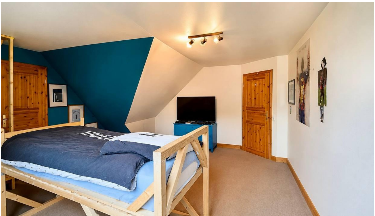
Schlafzimmer 2 OG