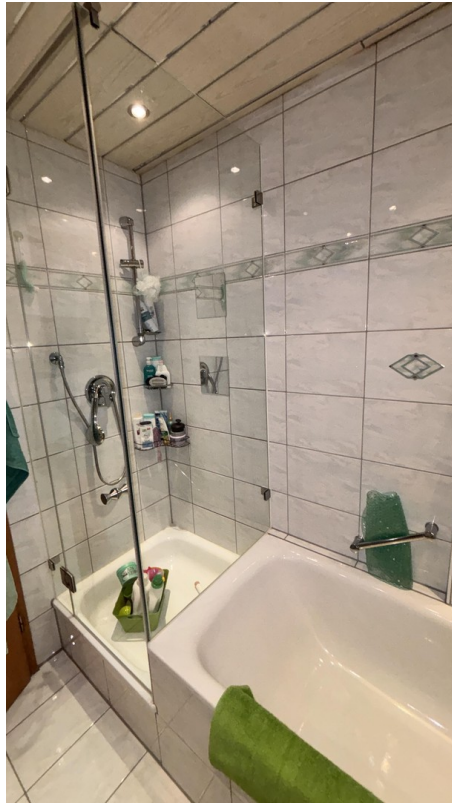
Dusche + Badewanne