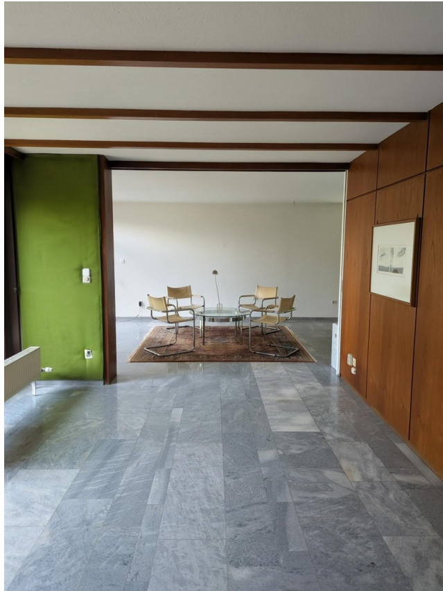
Blick auf das Wohnzimmer