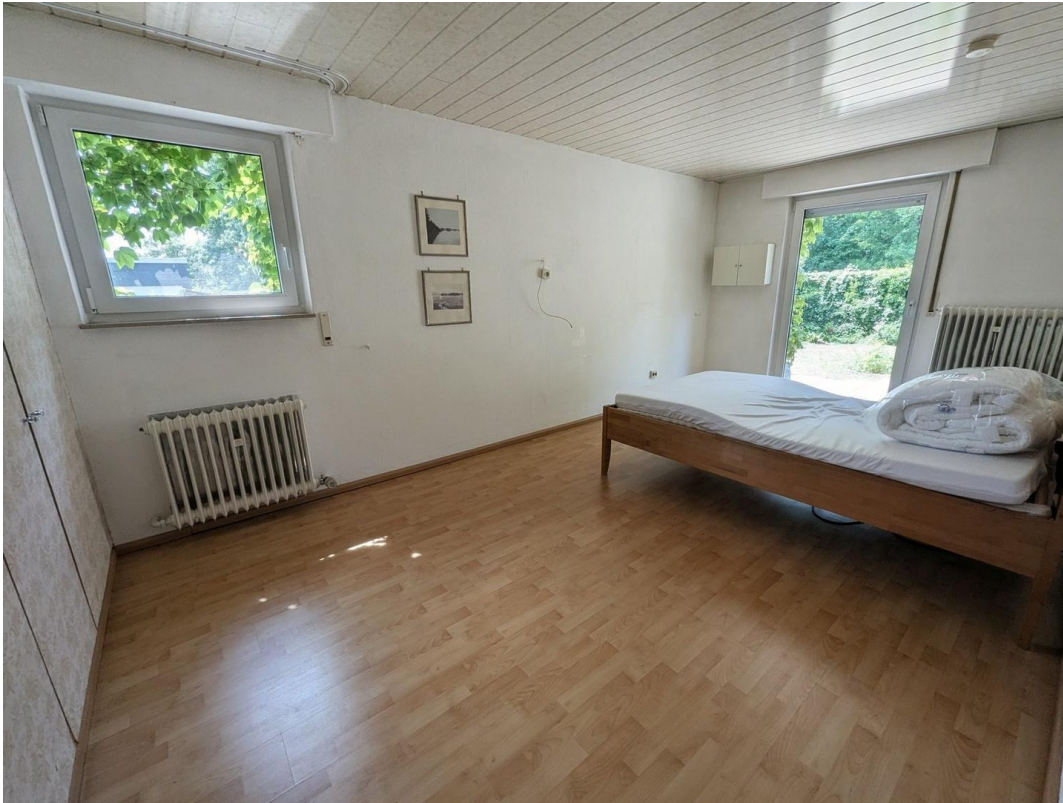
Zimmer 3 mit Zugang zum Garten