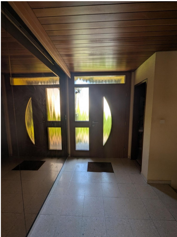
Haustür von innen