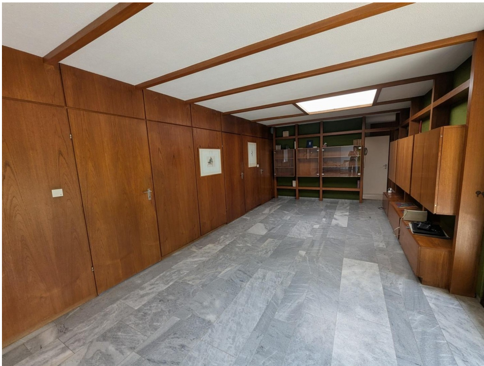
Esszimmer mit Einbauschränken