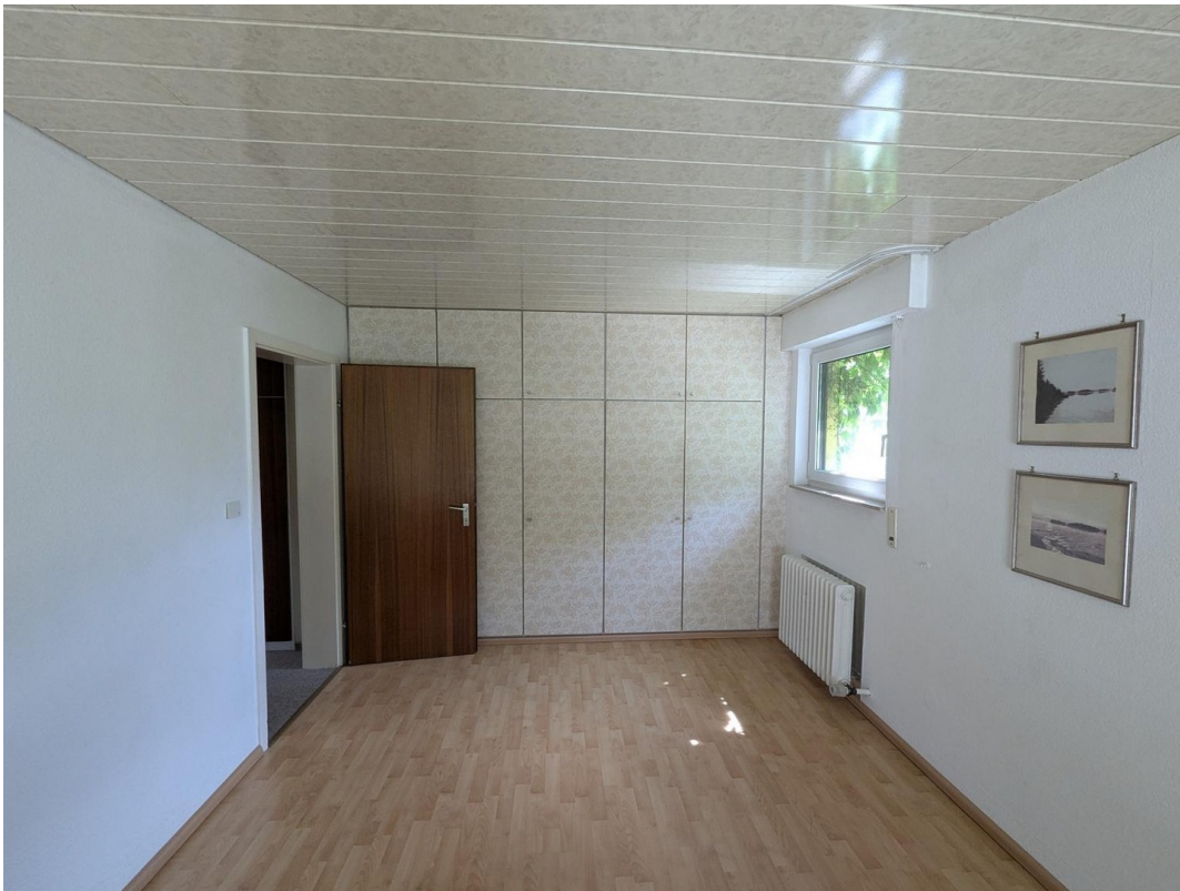
Raum 3 mit Einbauschränk