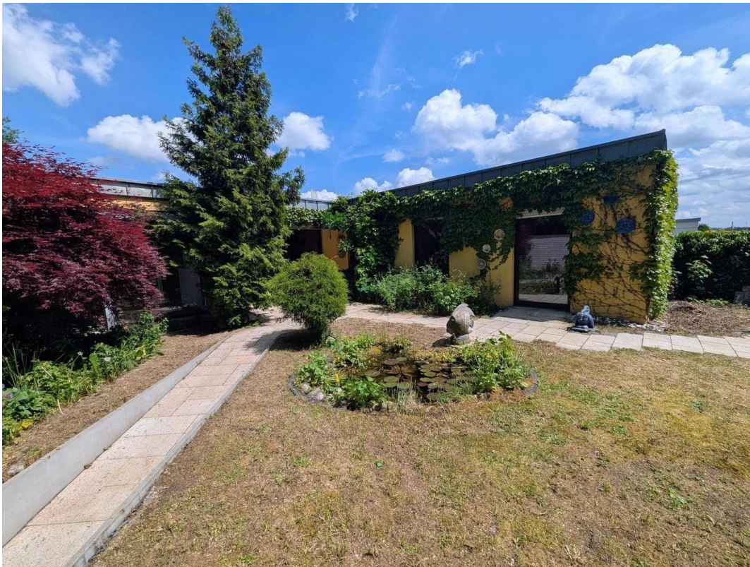
Blick auf den Schlaftrakt