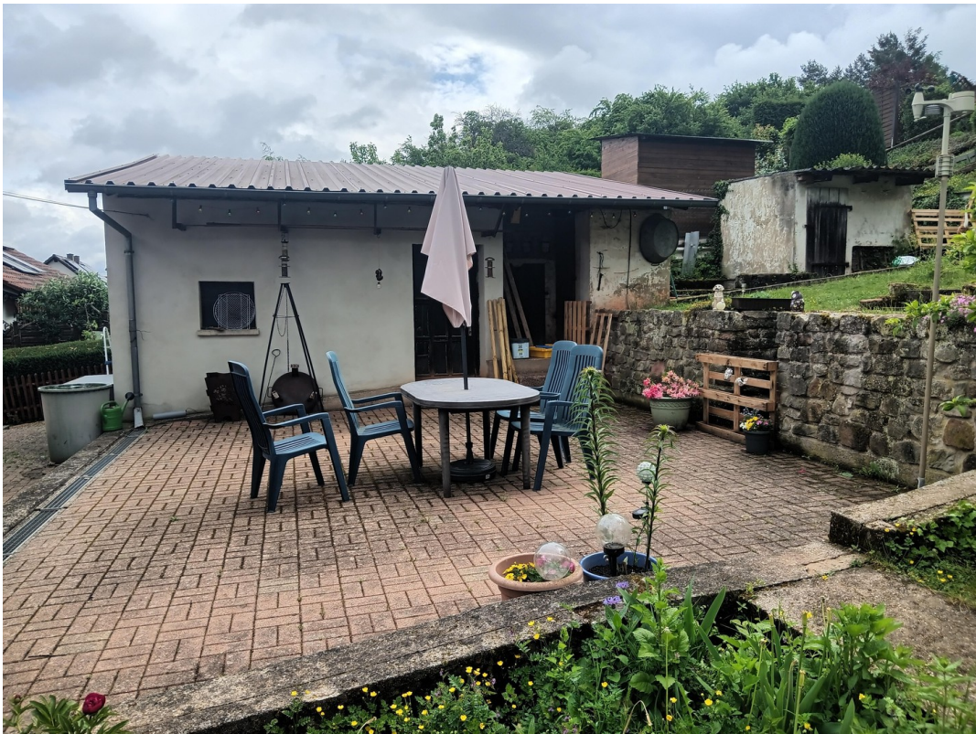
Garten mit Schuppen