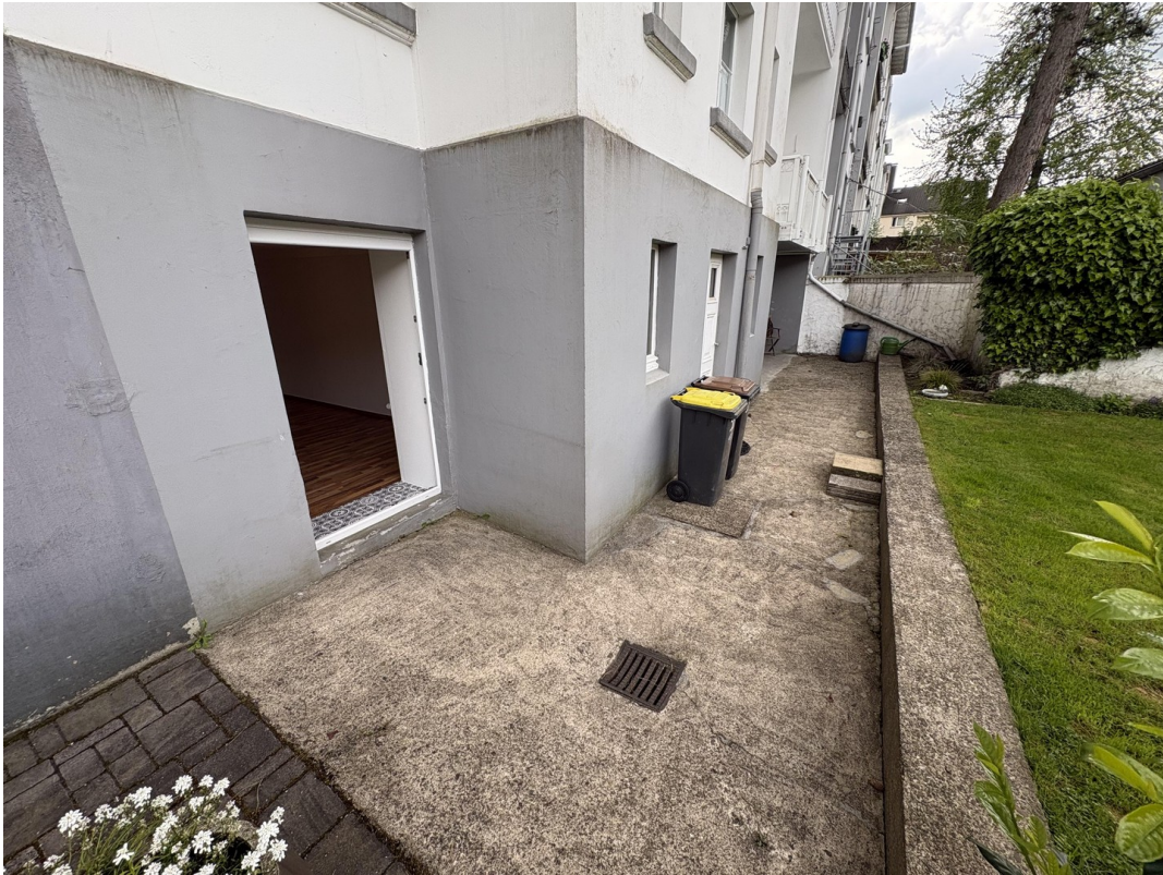
Terrasse zur Wohnung