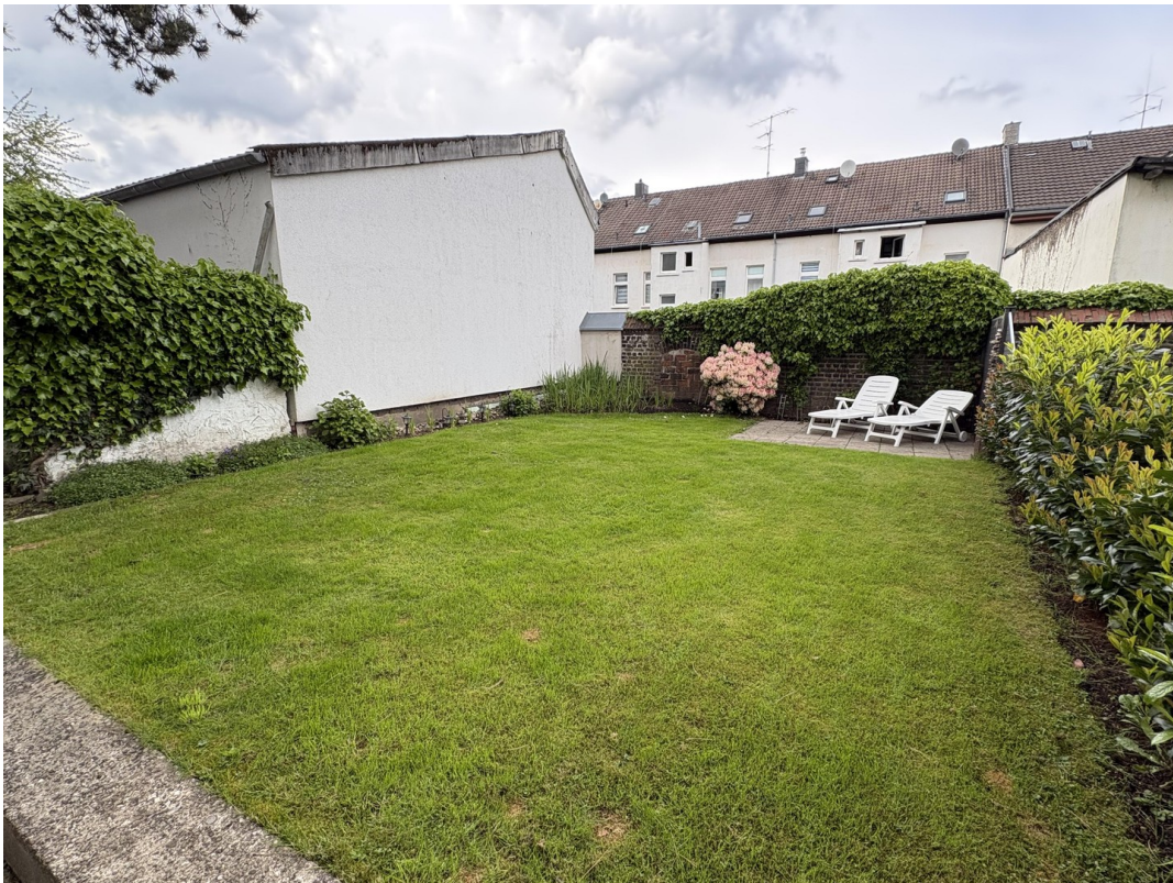
Garten zur Mitbenutzung