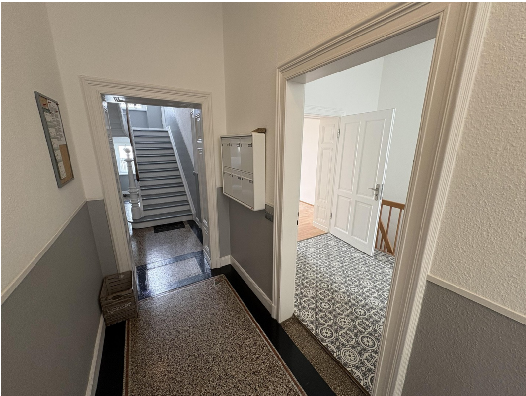
Zugang zur Wohnung EG