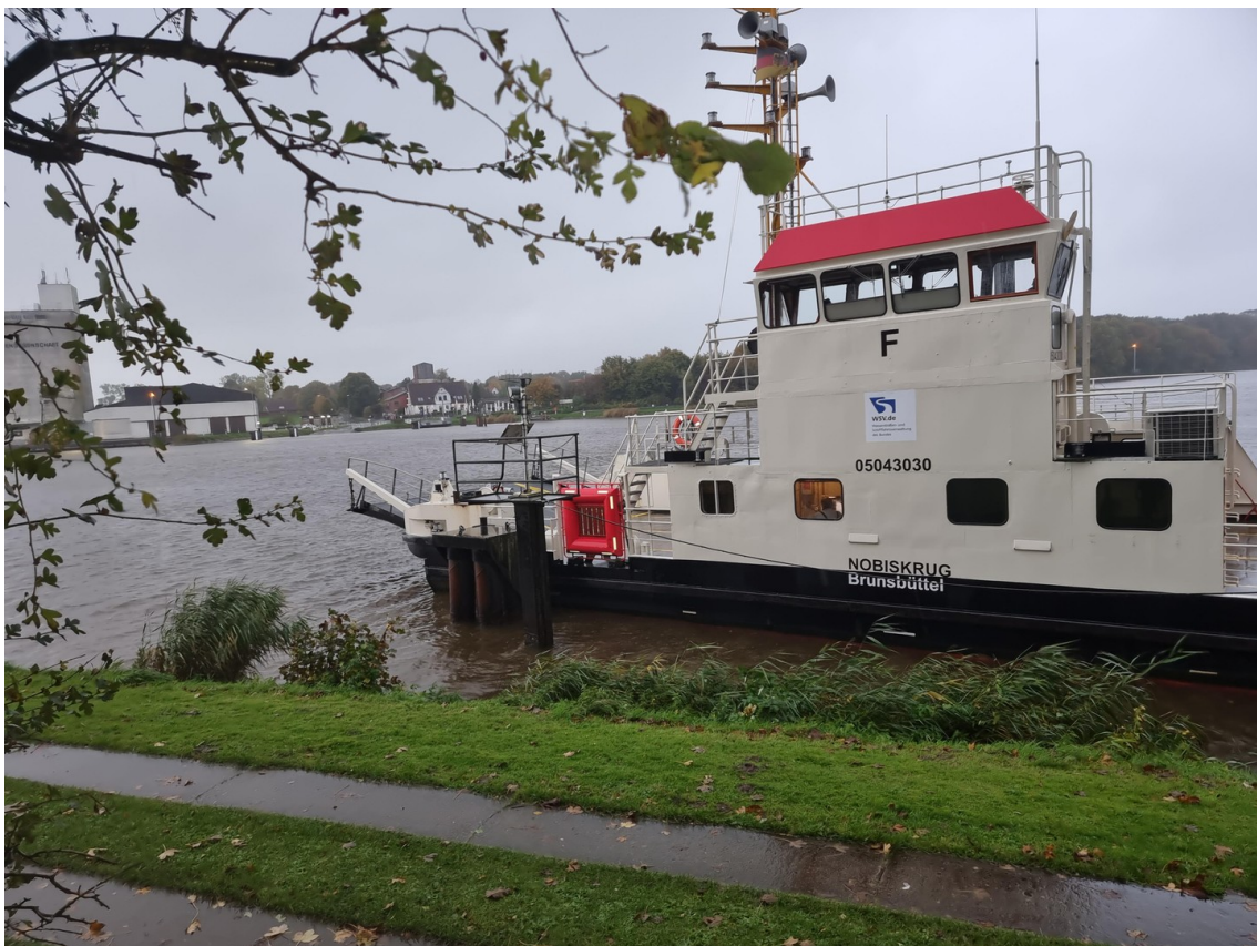
Nah am Nord-Ostsee-Kanal