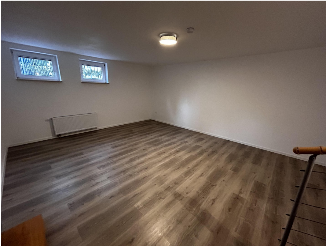
Hobby/Wohnraum UG 2