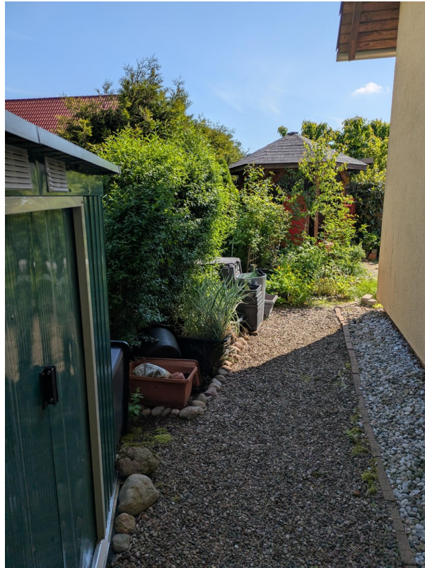
Garten mit Gerätehaus