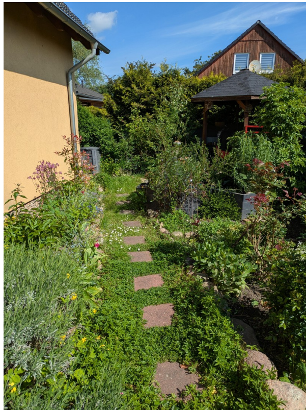
Garten mit Pavillion