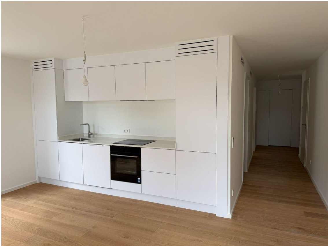
Küche + Wohnzimmer