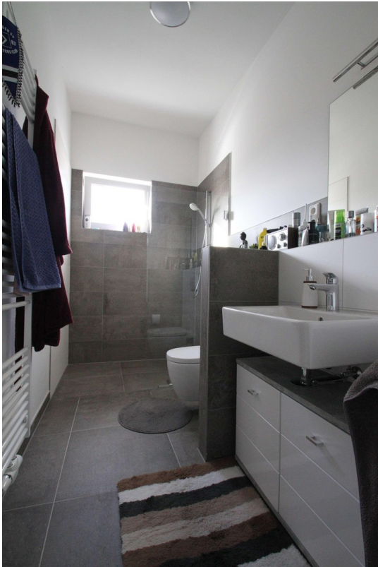
Bad mit begehbare Dusche