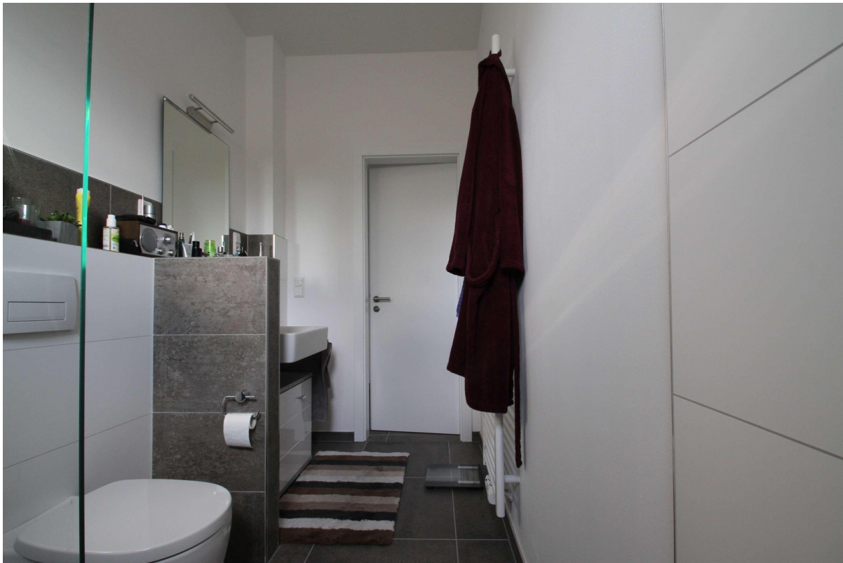
Bad mit begehbare Dusche