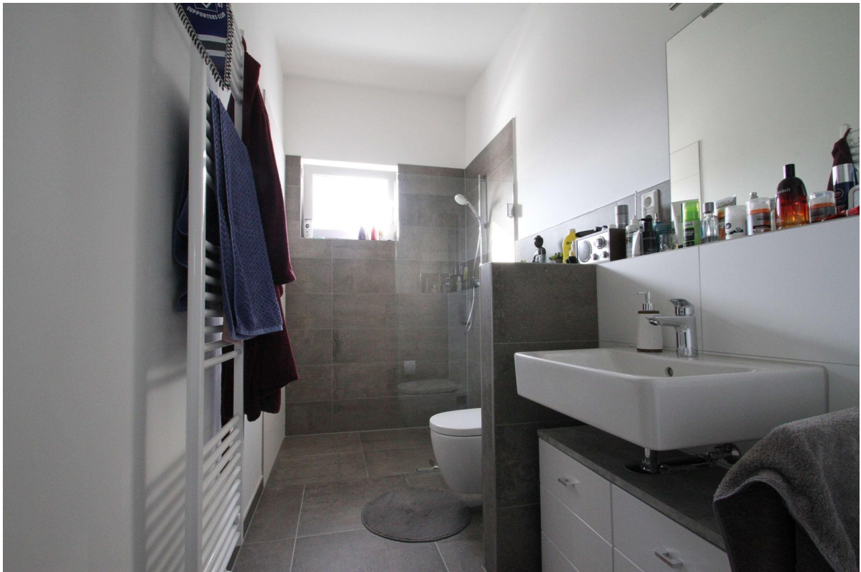
Bad mit begehbare Dusche