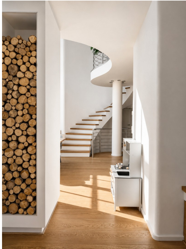
Blick zur Treppe