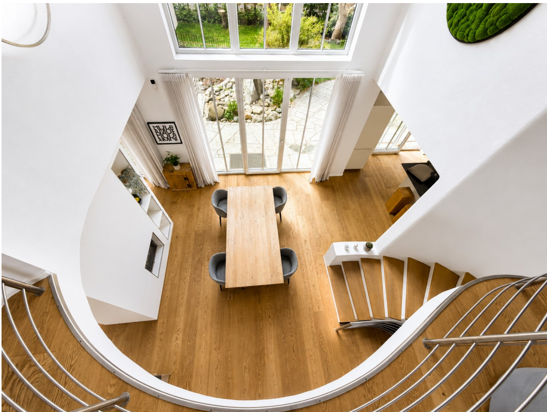
Blick von Galerie