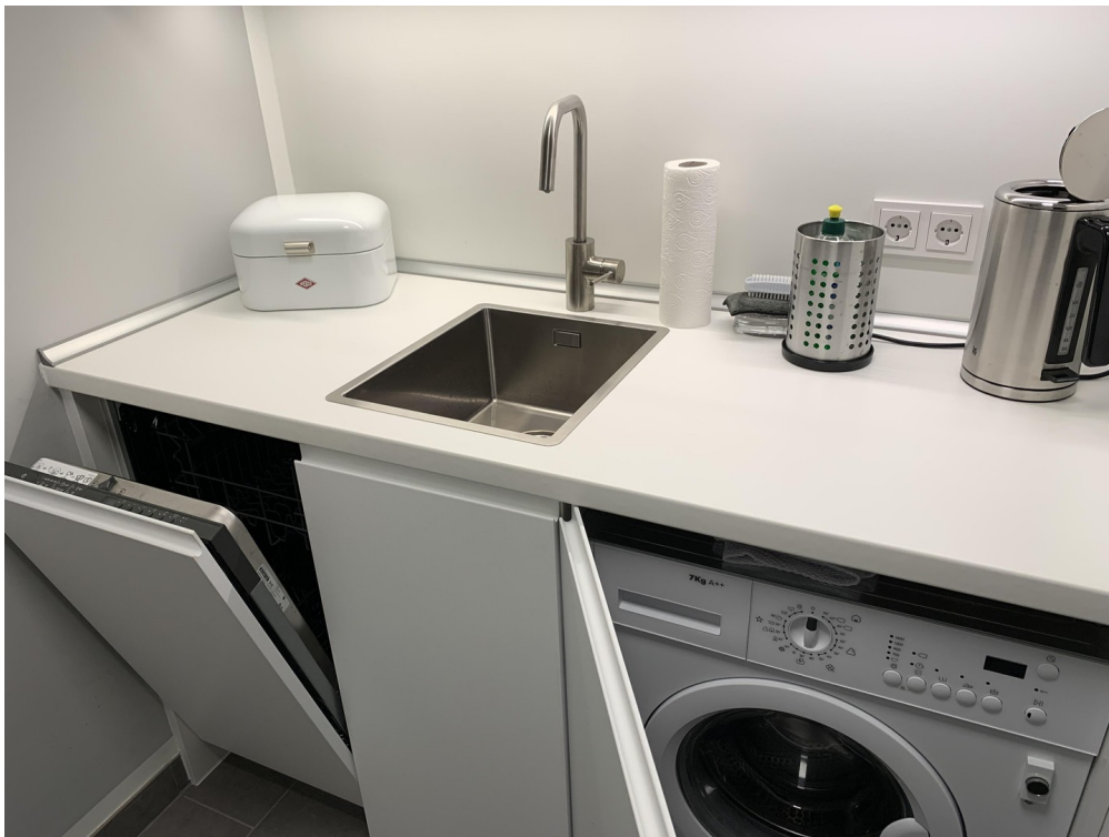
Küche mit Kühlschrank und TK