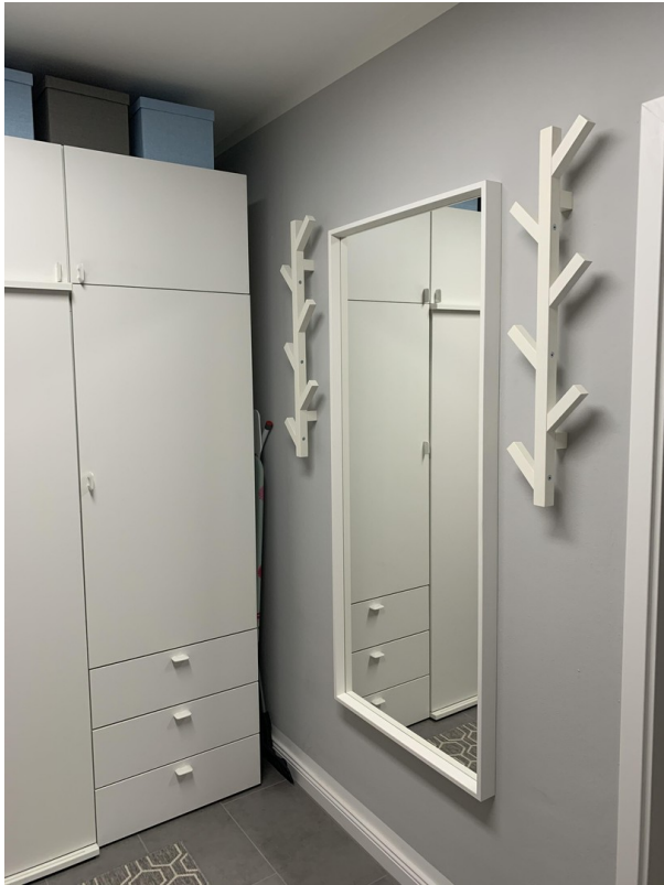
Küche mit Waschmaschine