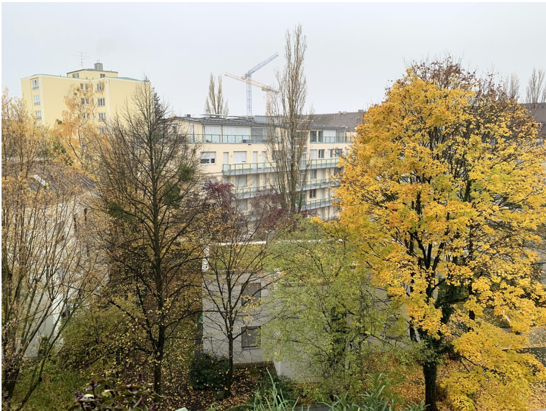
Balkon Trennwand/Boden saniert