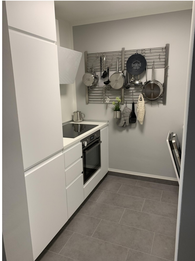
Küche mit WM und Spülmaschine