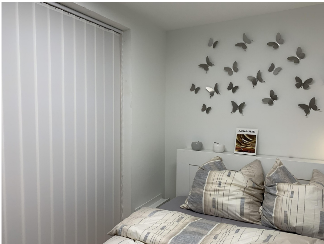
Wohninnenraum Blick Essplatz