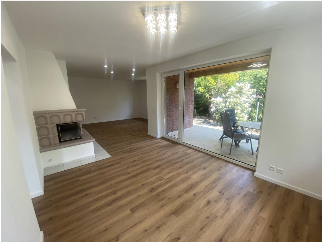
Esszimmer, Kamin und Wohnzimmer