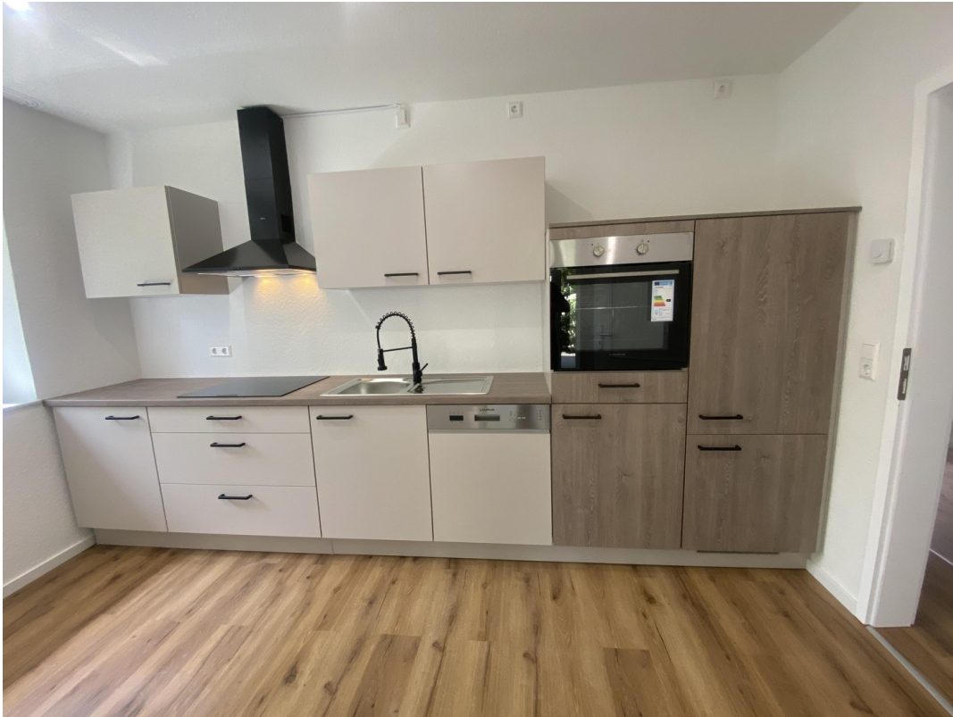
Neue Höffner Küche