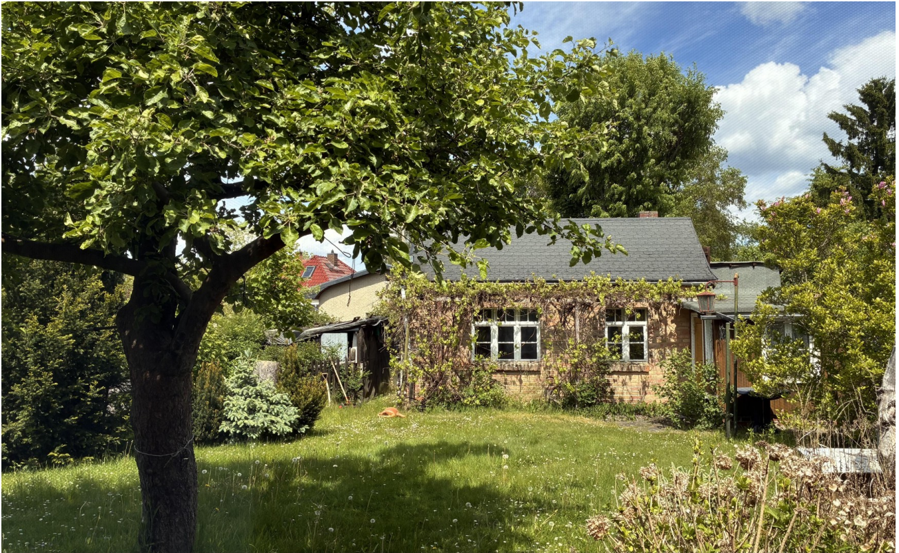
Garten hinten und Laube