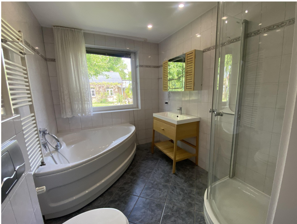
Bad mit Badewanne und Dusche