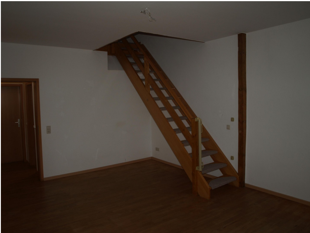
Treppe zur 2. Ebene