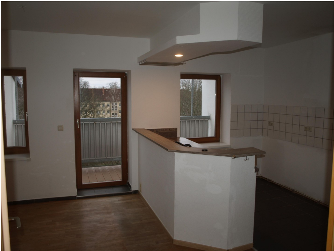
Küche mit Austritt zum Balkon