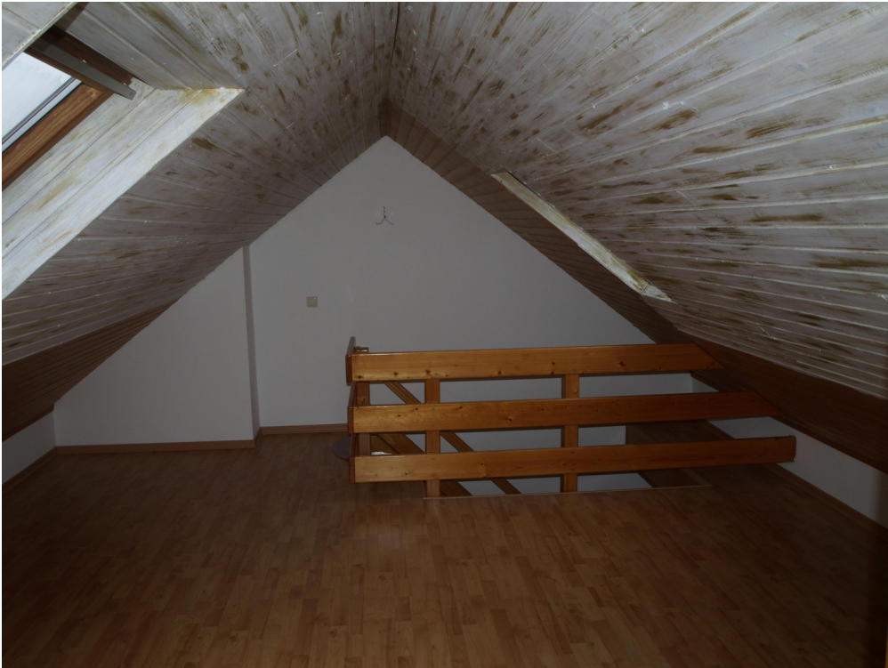
Schlafzimmer 2. Ebene