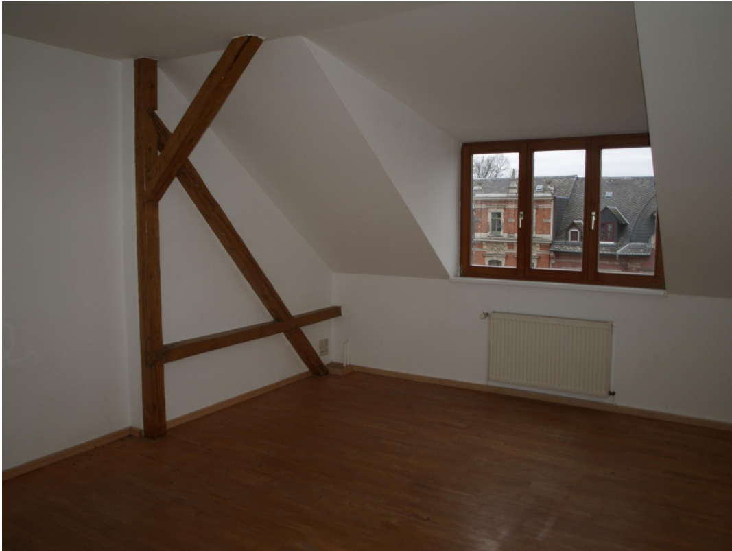
Schlafzimmer 1. Ebene