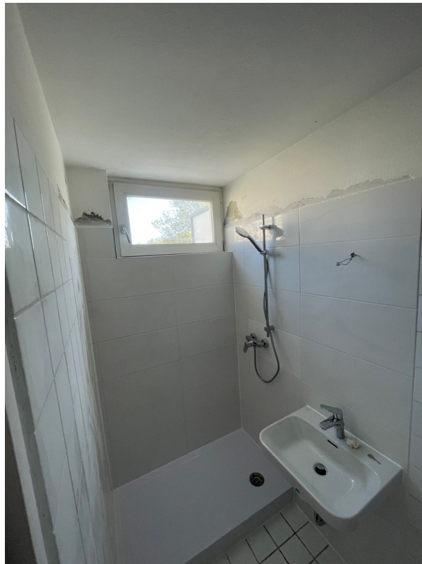
Bad (in Fertigstellung)