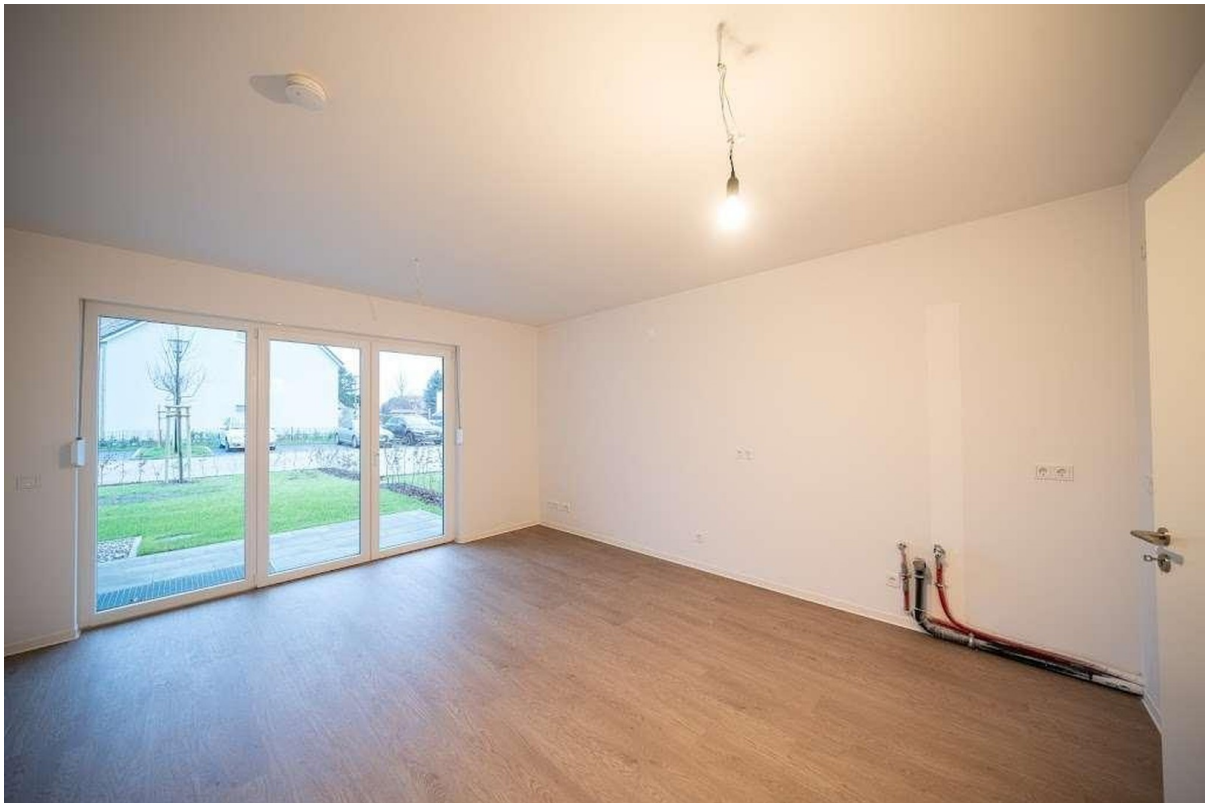
offener Wohn und Küchenber