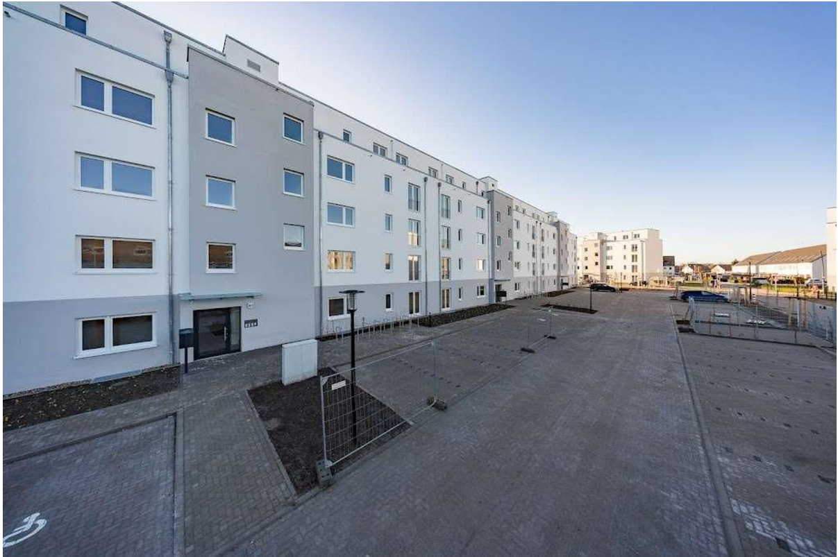
David Friedländer Weg 98