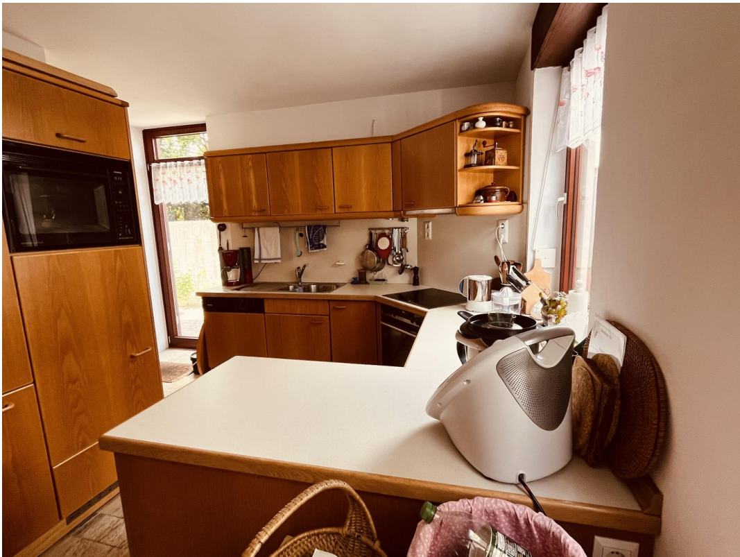
Küche mit Zugang zum Garten