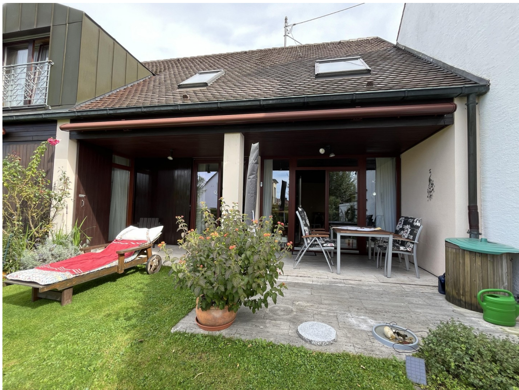
Zur Ruhe kommen