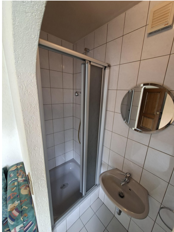
Gästezimmer Bad EG