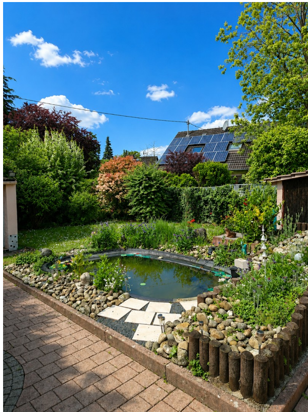
Garten mit Grünfläche