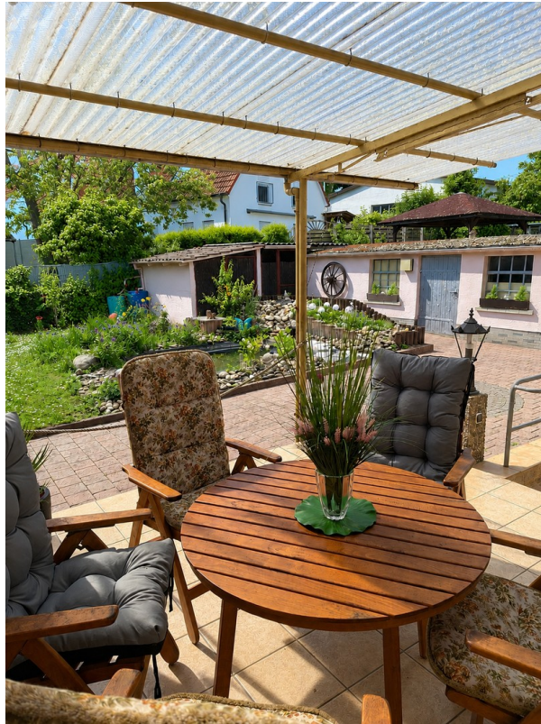
Terrasse mit Gartenblick