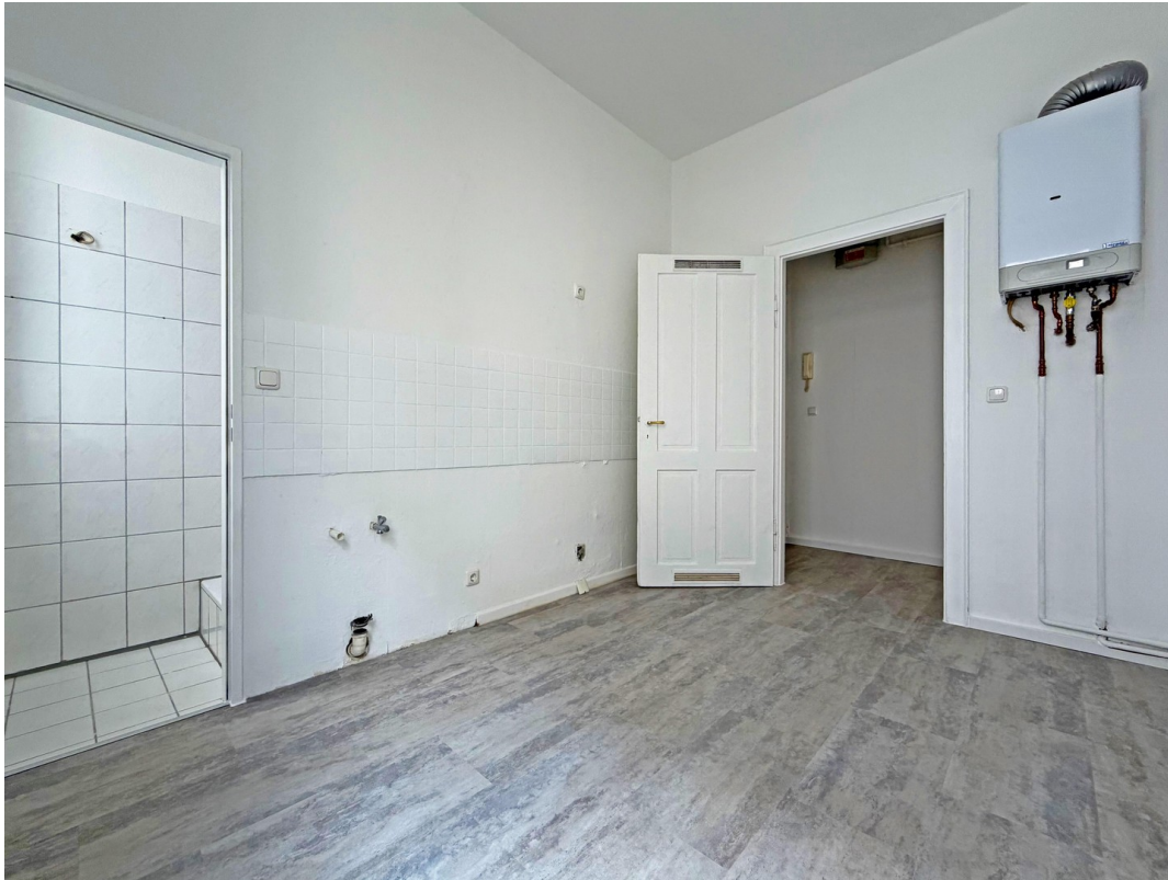
Großzügige Küche II