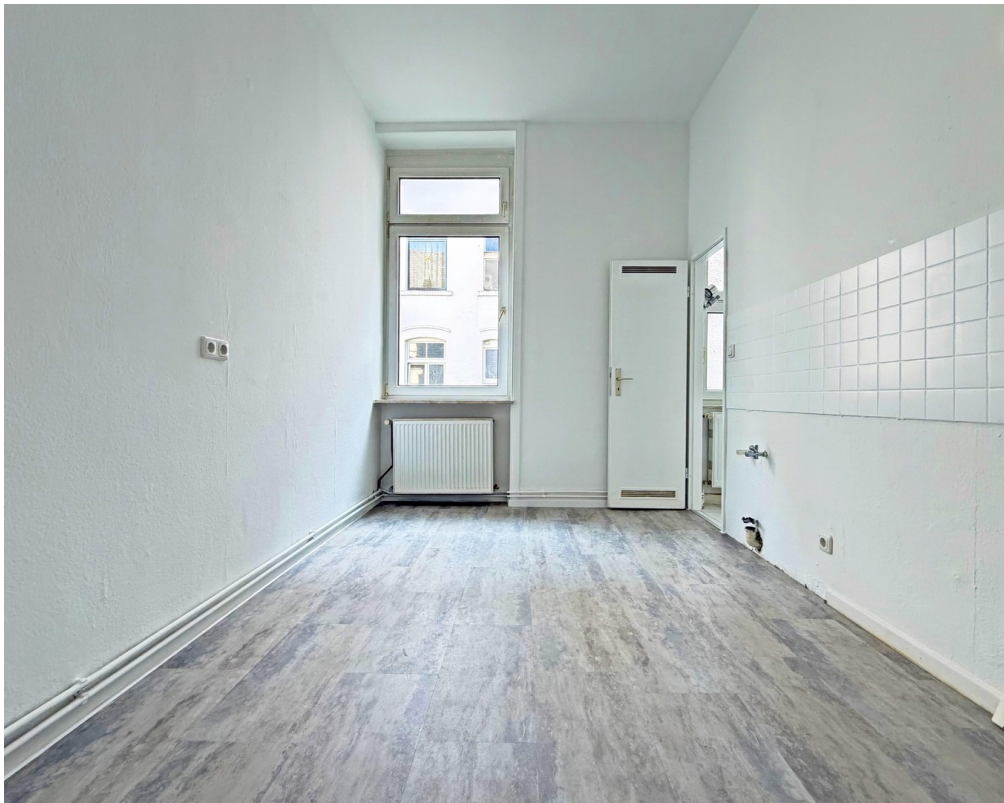
Großzügige Küche I